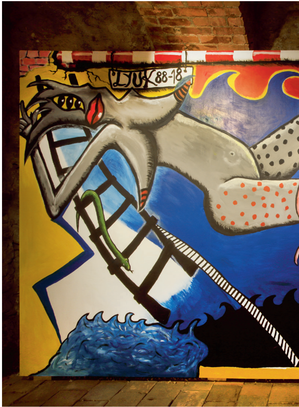
Részlet a kiállításból, Szilágyi Zoé Fekete Lyukban alkotott fafestményének újrakonodolt változata