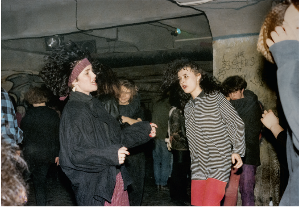
Cure Club a Fekete Lyukban