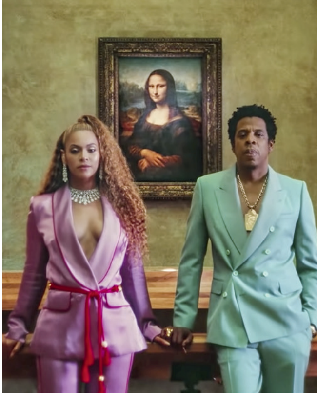
Beyoncé és Jay-Z a Mona Lisa előtt az Apesh**t című videóklipben