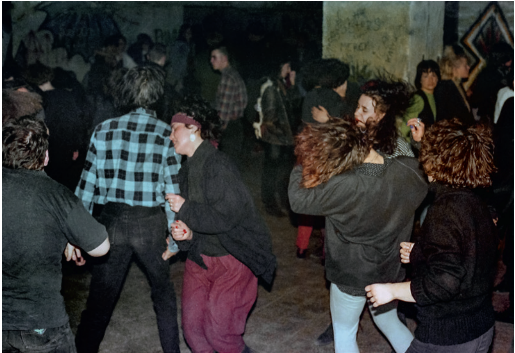
Cure Club a Fekete Lyukban