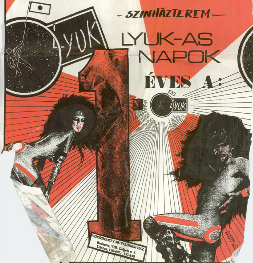
1 éves a Lyuk! A Lyukas napok plakátja