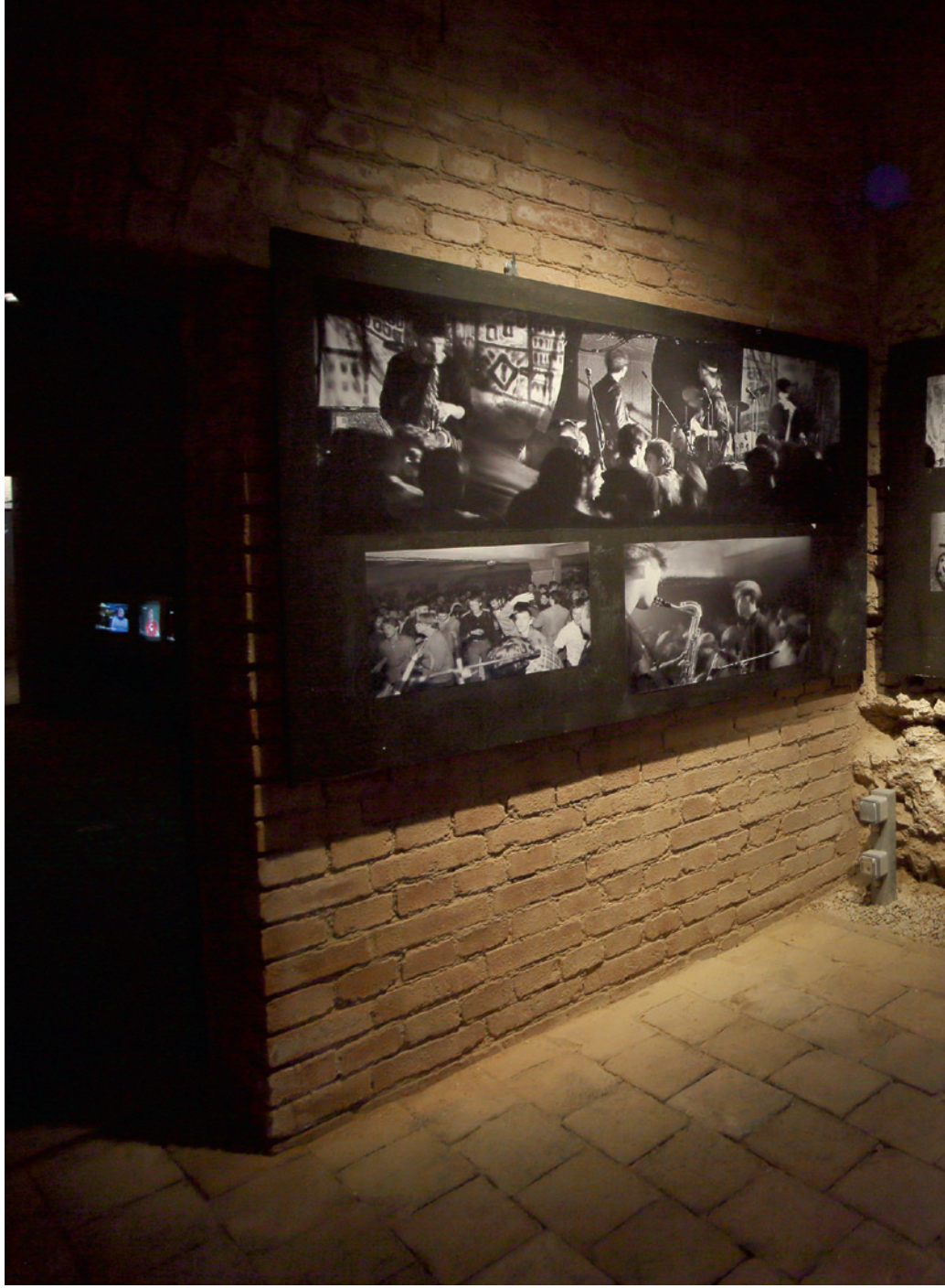
Részlet a kiállításból. Úrhán Tamás fotói a Fekete Lyukból