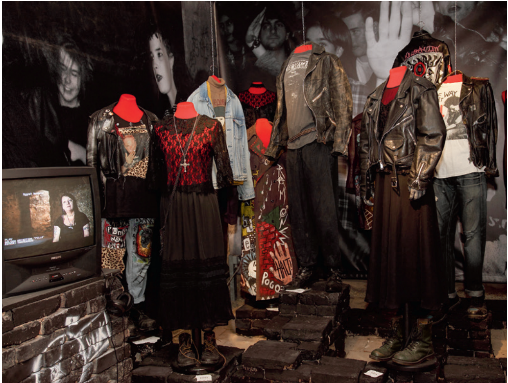
Részlet a kiállításból, a szubkultúrák öltözéke