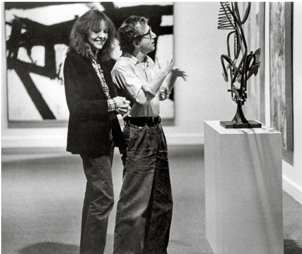
Woody Allen és Diane Keaton a Manhattan című filmben