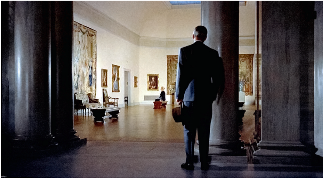
Jelenet Alfred Hitchcock Szédülés című filmjéből