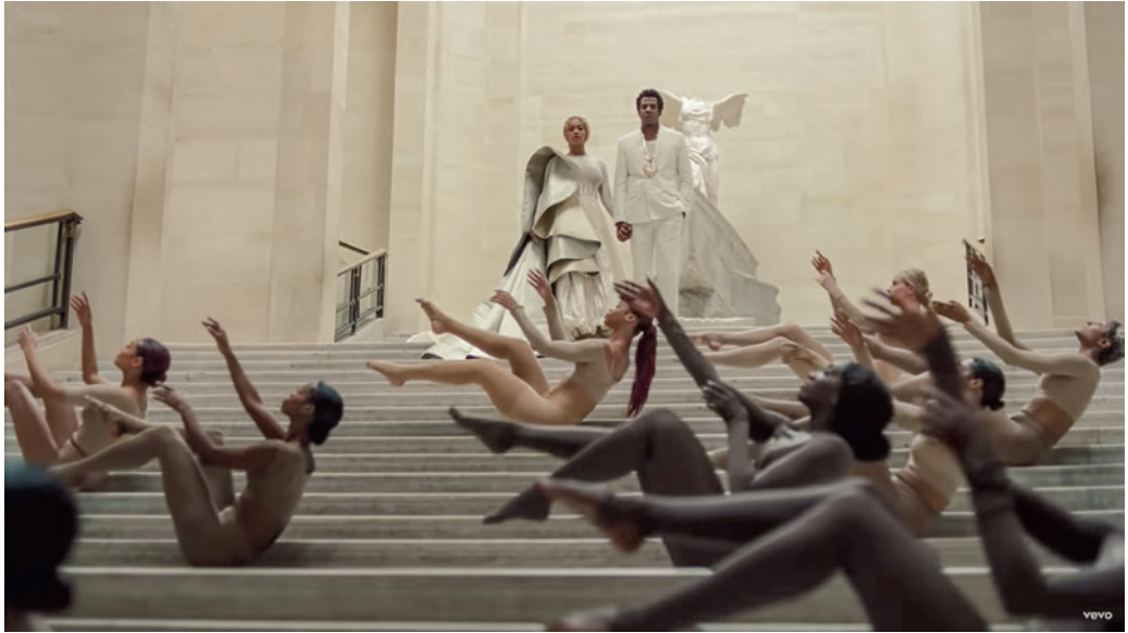
The Carters: Apes**t, videóklip, részlet