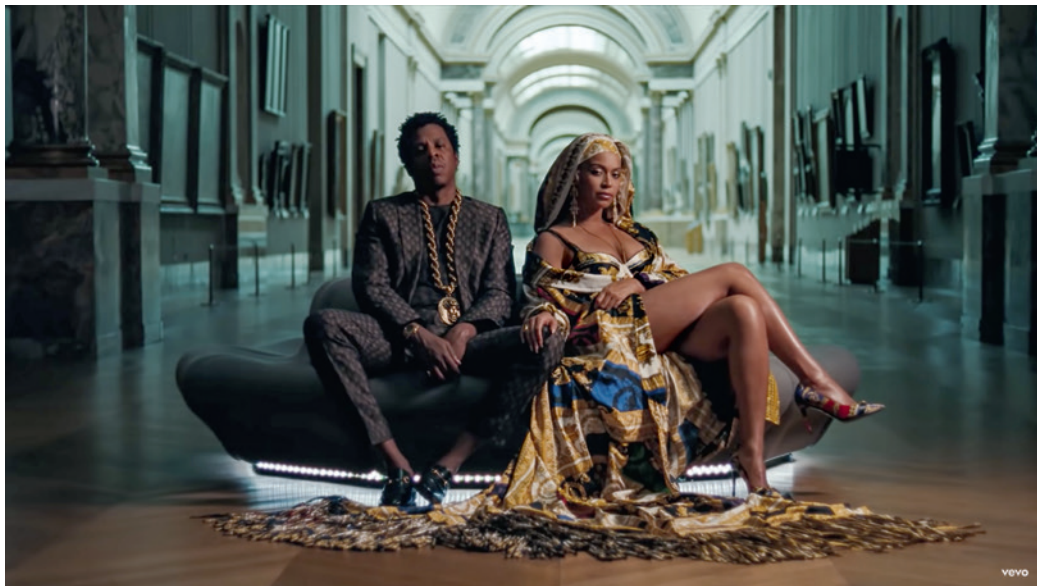
The Carters: Apes**t, videóklip, részlet