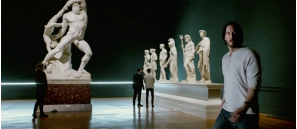
A John Wick című film jelenete Keanu Reeveessel a római Galleria Nazionale d'Arte Moderna kiállításában