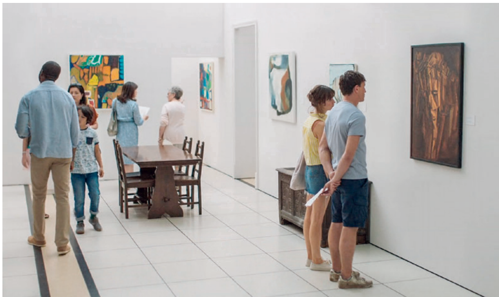
A Normális emberek sorozat jelenete Marcel Duchamp festményének reprodukciója előtt