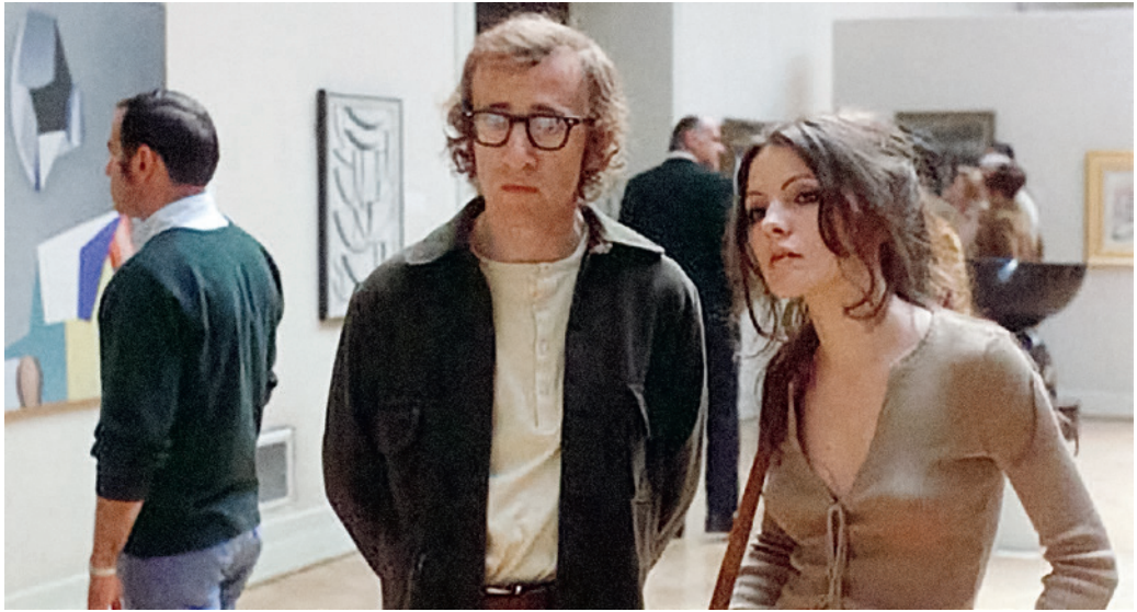
Részlet a Játszd újra Sam! című filmből