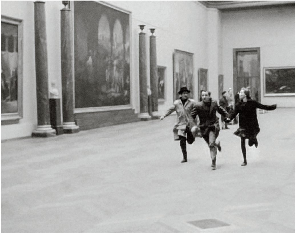
Jean-Luc Godard Külön banda című filmjének emblematikus jelente a Louvre-ban