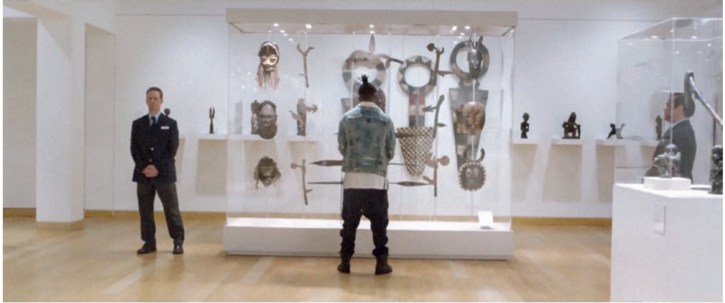
Kultúrák találkozása a Fekete Párduc című filmből