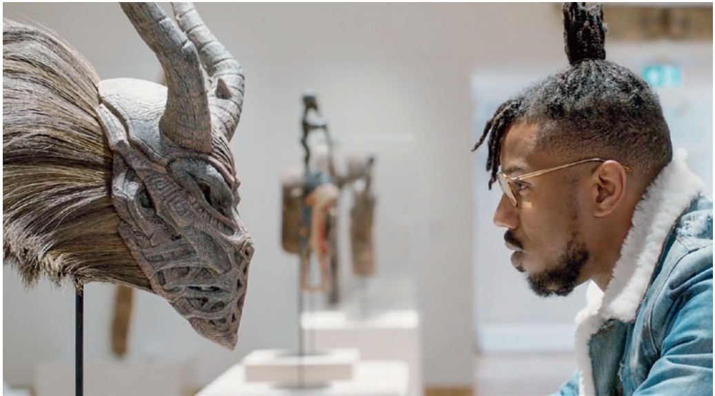
Részlet a Fekete Párduc című filmből