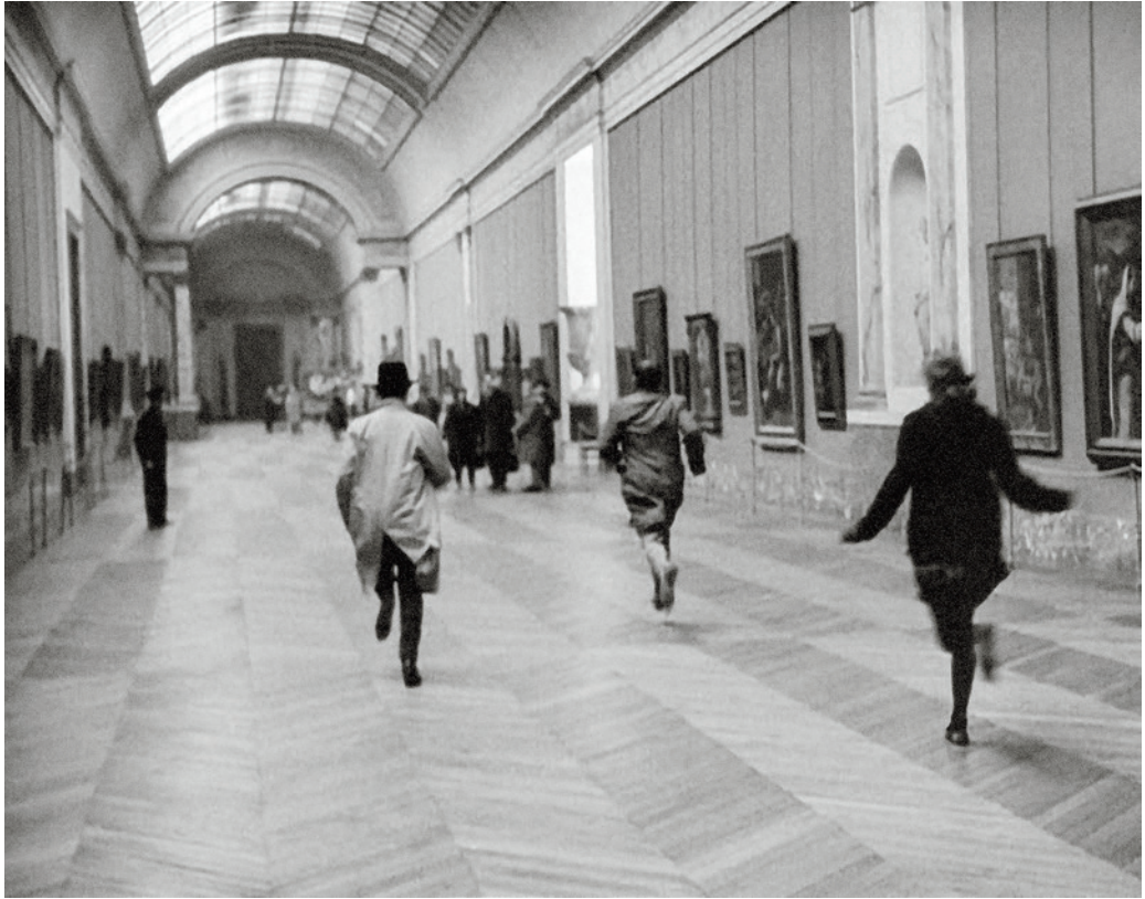
Jean-Luc Godard Külön banda című filmjének emblemikus jelente a Louvre-ban