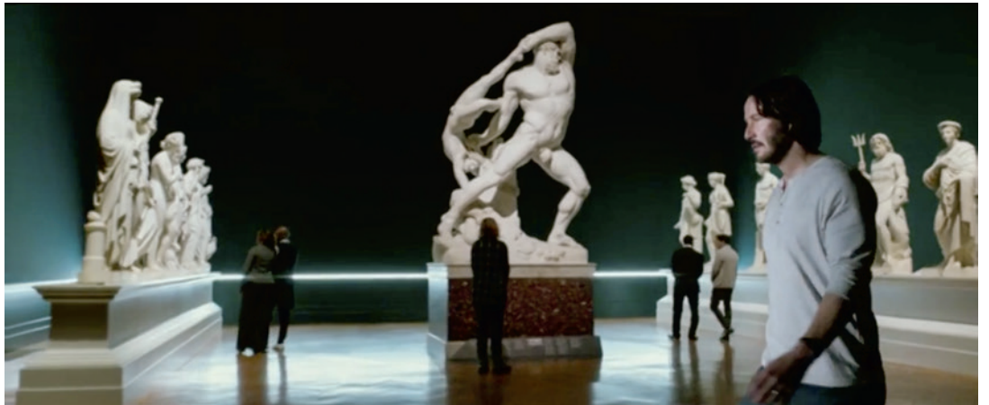
A John Wick című film jelenete Keanu Reeveessel a római Galleria Nazionale d'Arte Moderna kiállításában