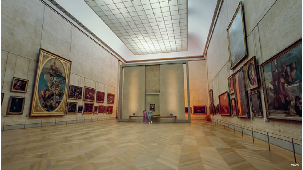
The Carters: Apes**t, videóklip, részlet