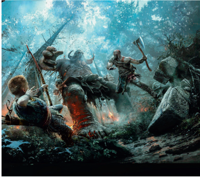
God of War 4 Concept art