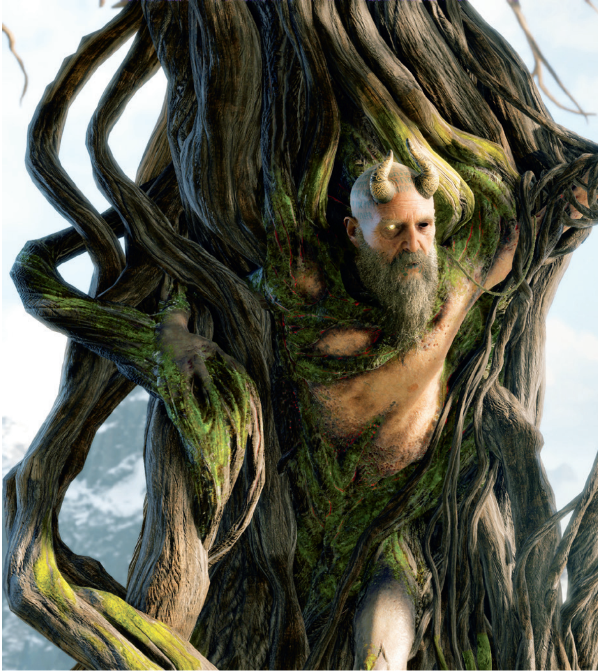
Mimir és Kratos első találkozásása