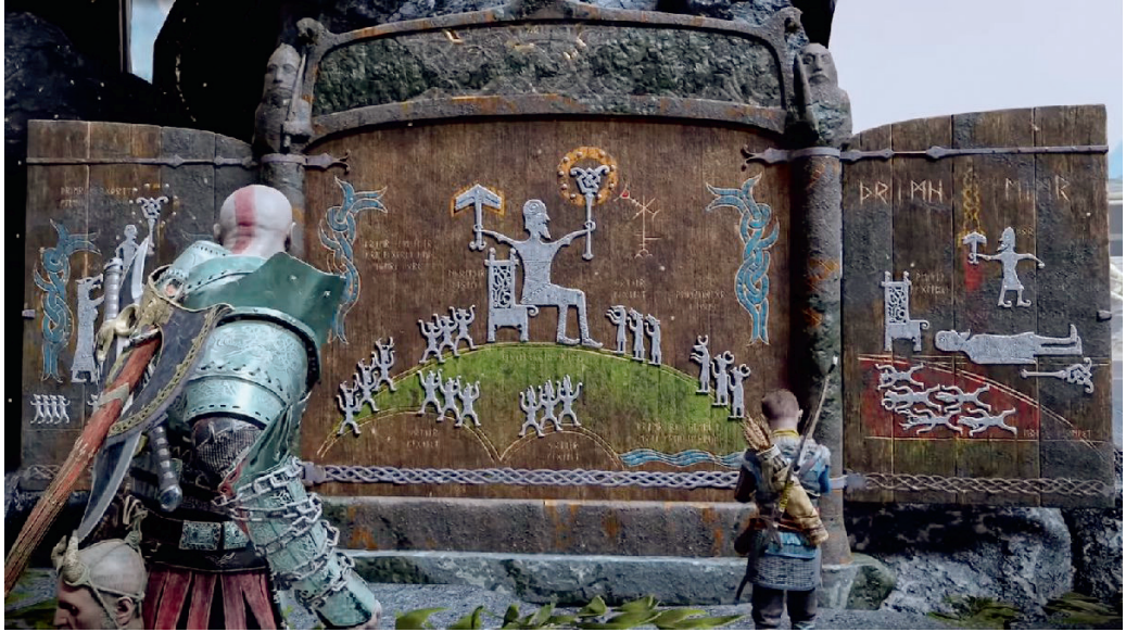
Jotnar-szentély, rajta Thrym óriás története