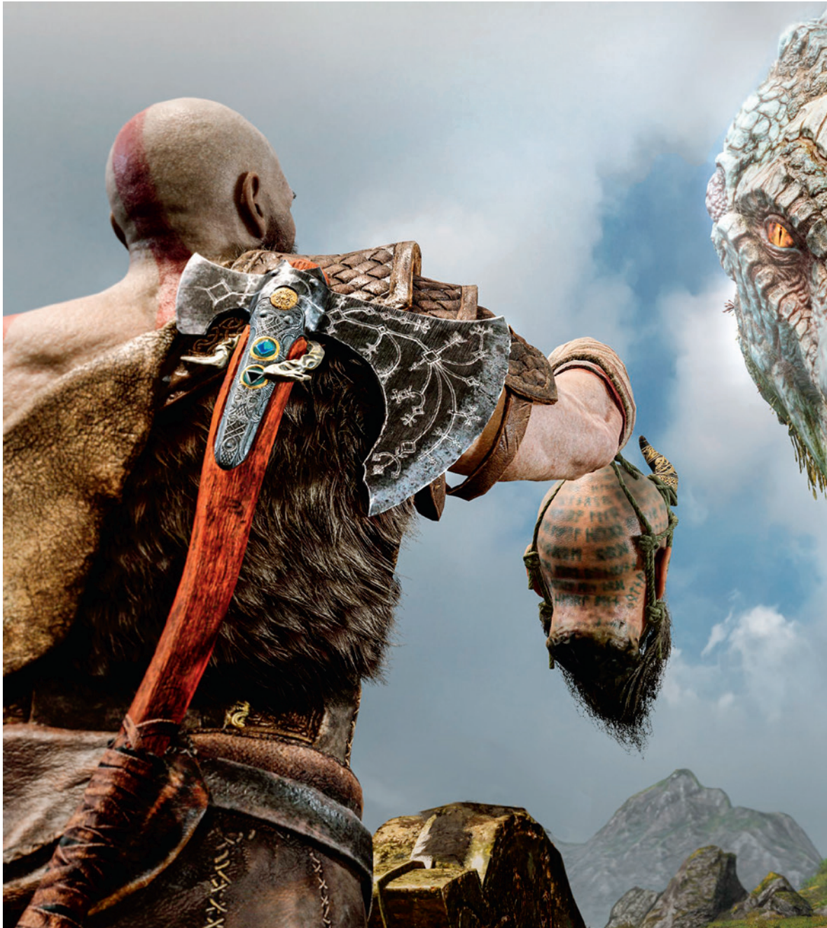
Mímir a Világkígyóval kommunikál