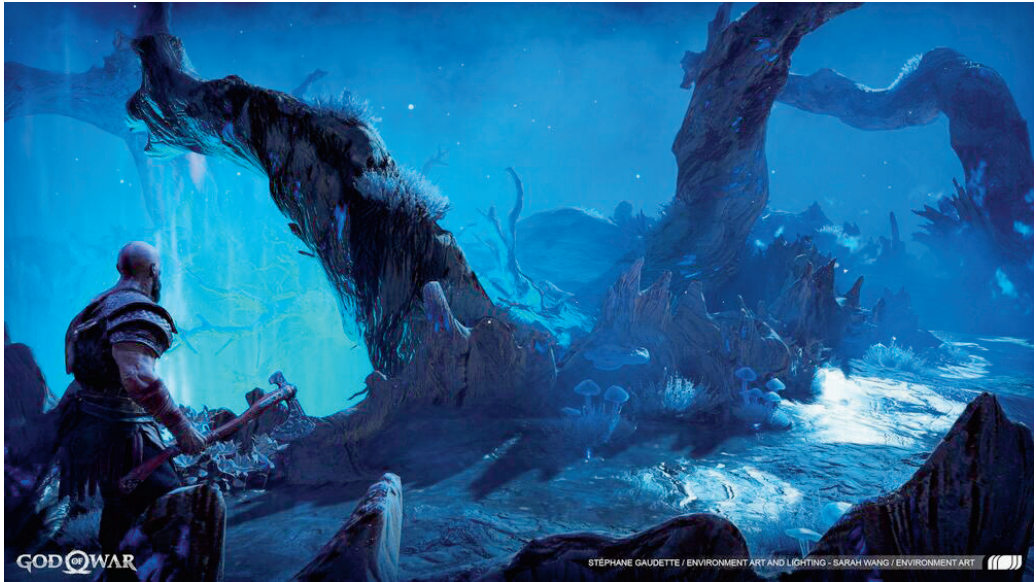
Az Yggdrasil ágai között