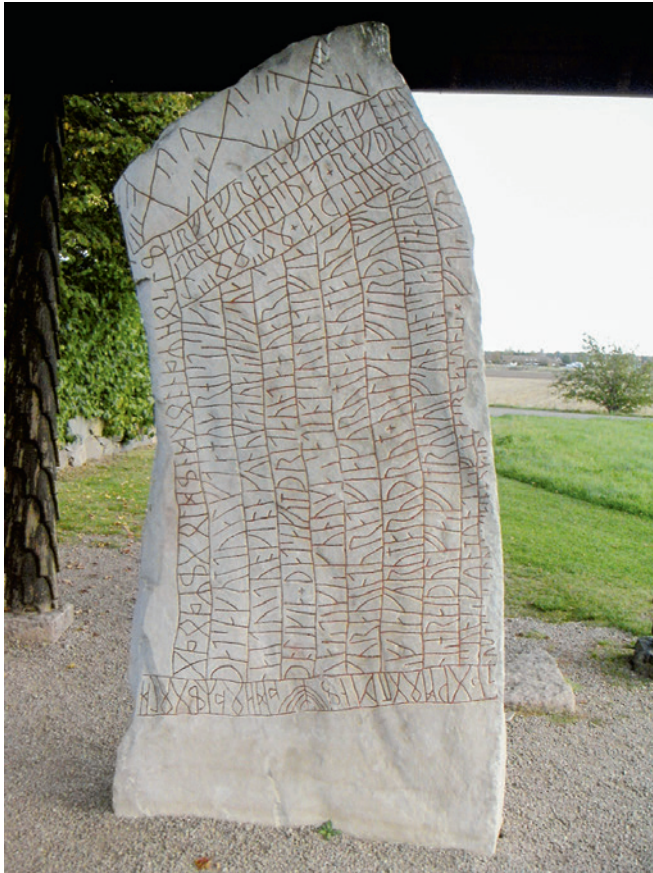
A Rök-rúna a leghosszabb ismert fuPark rúnaírással (8-9. század, rúdata ID: Ög136)