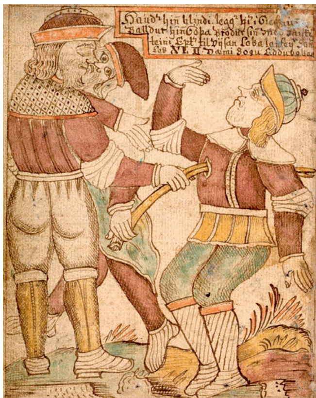
Baldur halála egy 18. századi izlandi kéziratban