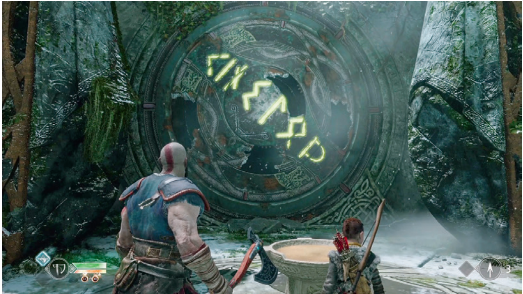
Rúnák a játék egyik logikai feladványában