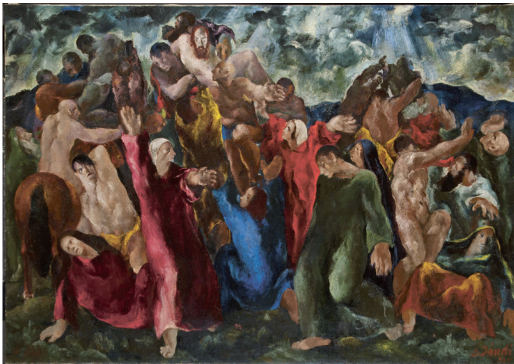
Jándi Dávid: Levétel a keresztről , 1926, olaj, vászon, 148×198 cm