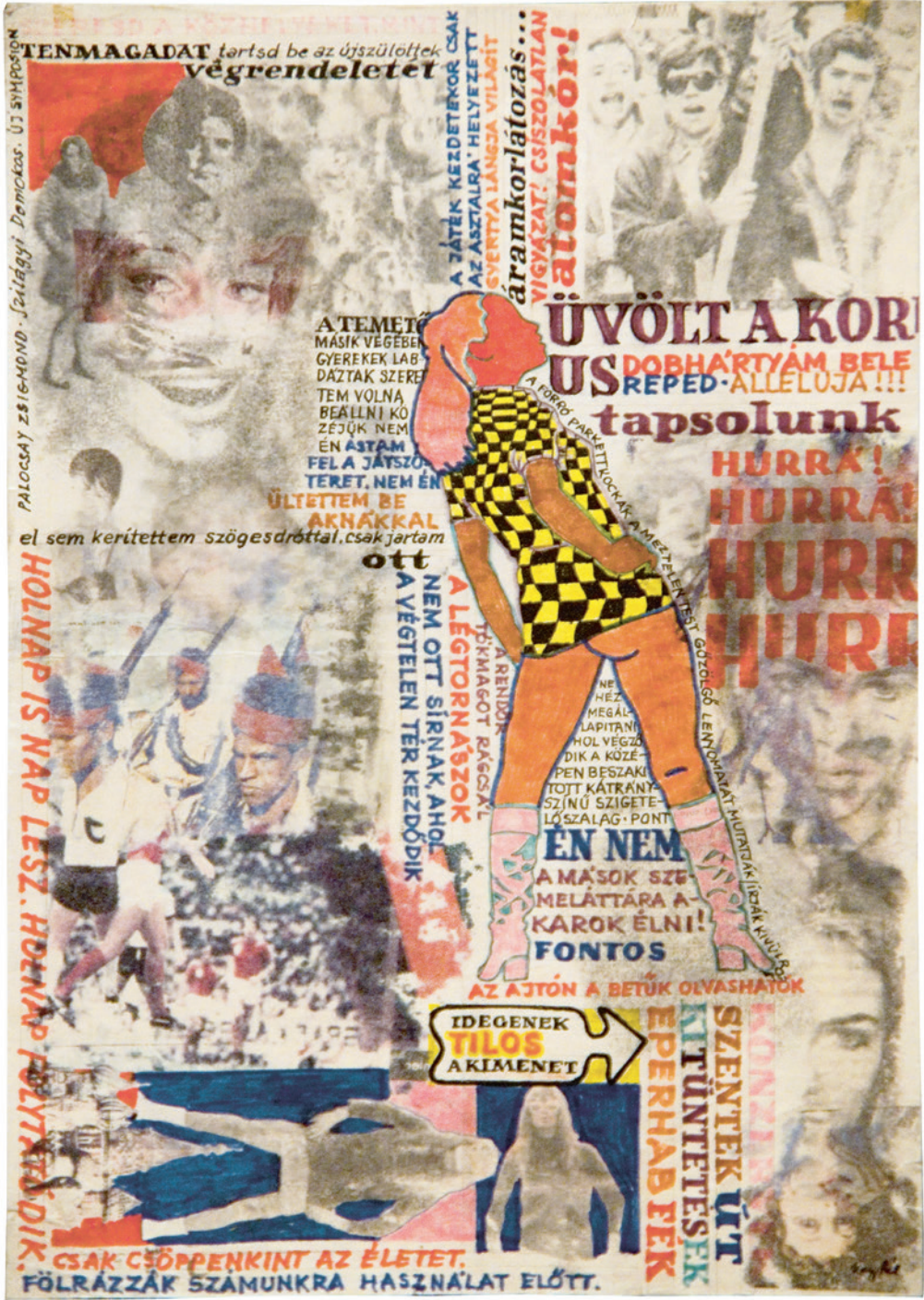
Nagy Pál: El nem küldött kép levelek 4, 1970-es évek, 24,5x20,5 cm

PALOCSAI ZSÉLE-MOND · Szilágyi Domokos. ÚJ SÍMPÓZSIUM