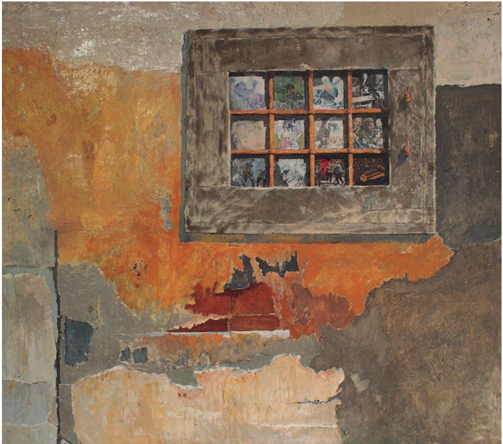
Nagy Pál: Vakablak , 1971, olaj, vászon, 118×131,5 cm