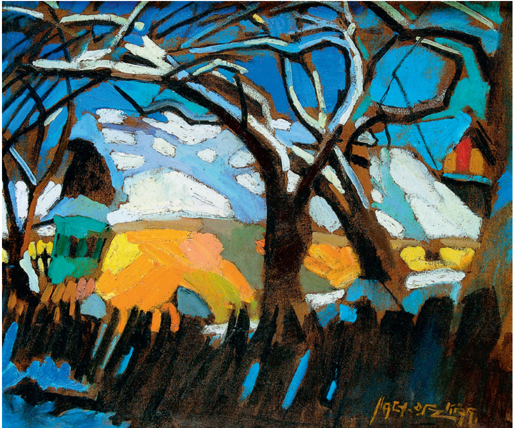
Nagy Oszkár: Felsőbányai bányászház, 1928 k. olaj, vászon, 58,5×68 cm