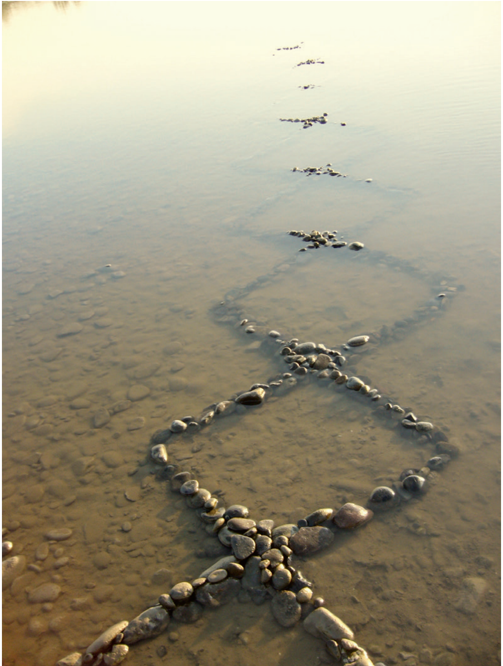
Pokorny Attila: Vízvarrás, 2007, fotódokumentáció