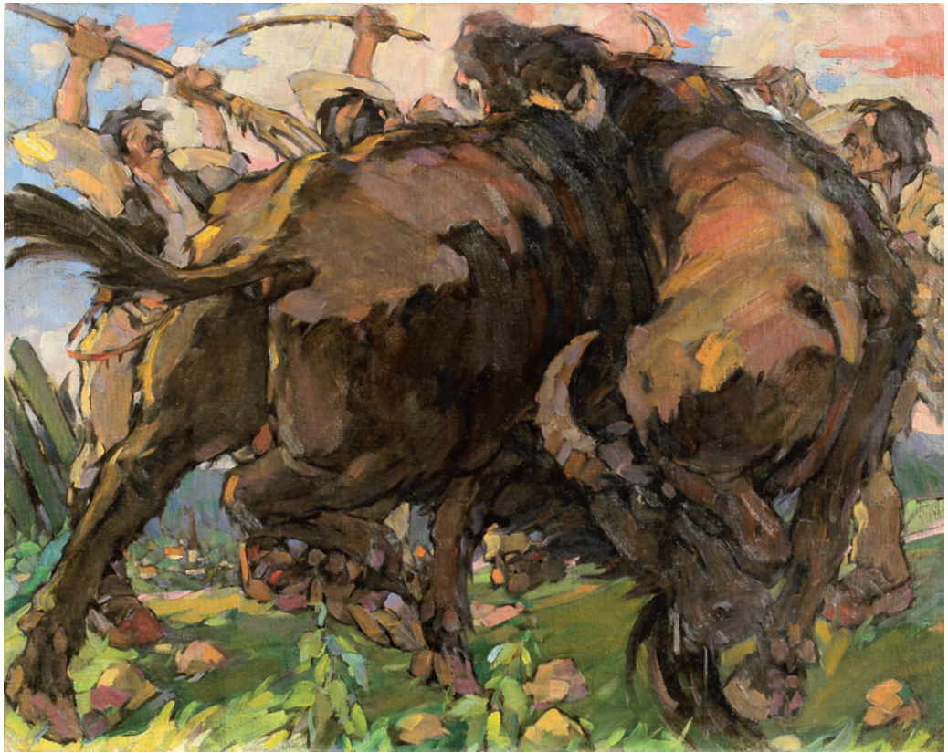
Papp Aurél (Popp Aurel): Bivalyharc , 1940-es évek, olaj, vászon, 93,5×117,5 cm