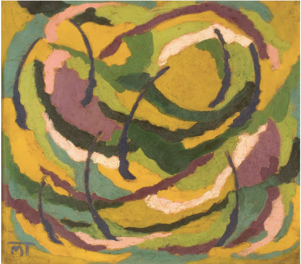
Mattis Teutsch János: Kompozíció , 1920 k, olaj, karton, 39,8×44,9 cm