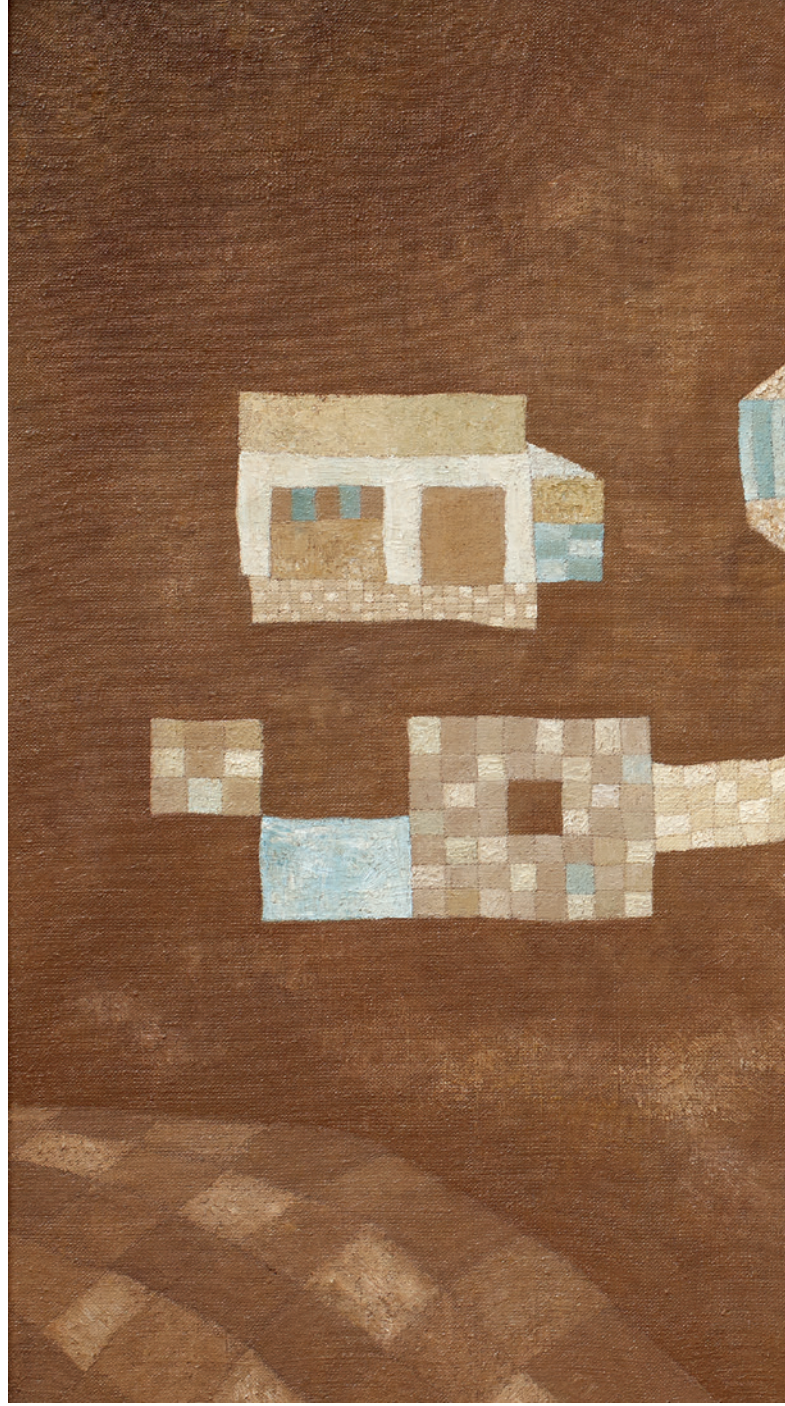
Jakobovits Miklós: Örményországi tó, 1975, olaj, vászon, 90x110 cm