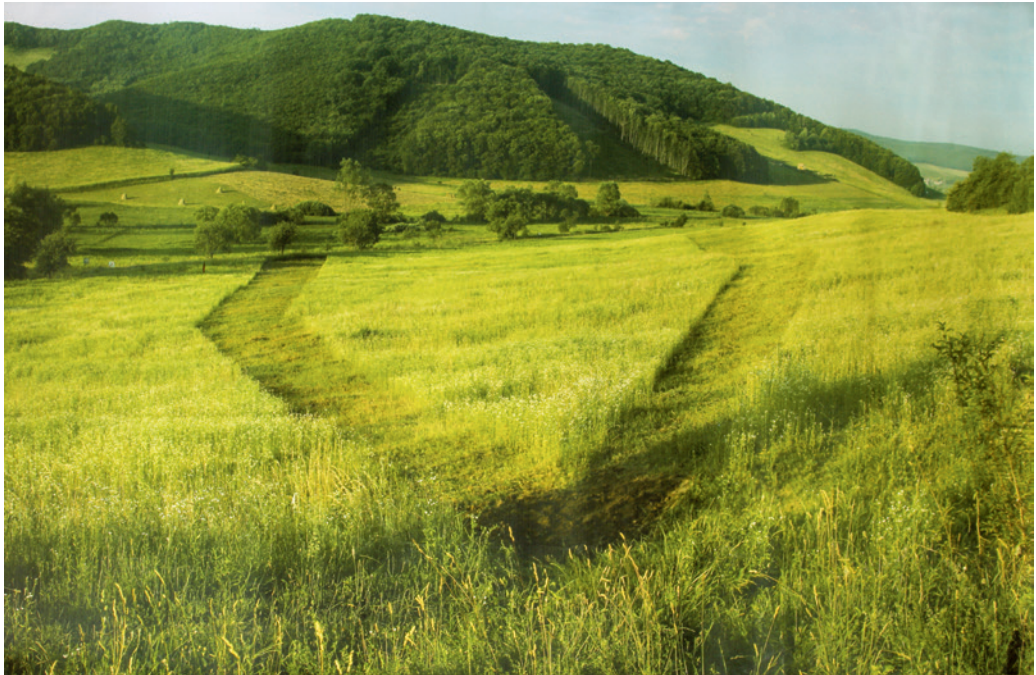
Pál Péter: Folyó-só , 2007, C print, 70×120 cm