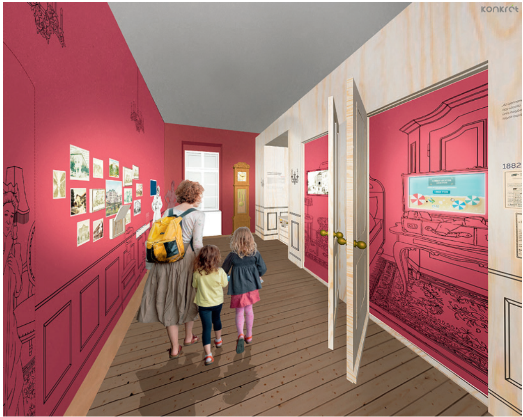
A hidegfürdőt bemutató kiállítótér látványterve Készítette: Konkrét Stúdió