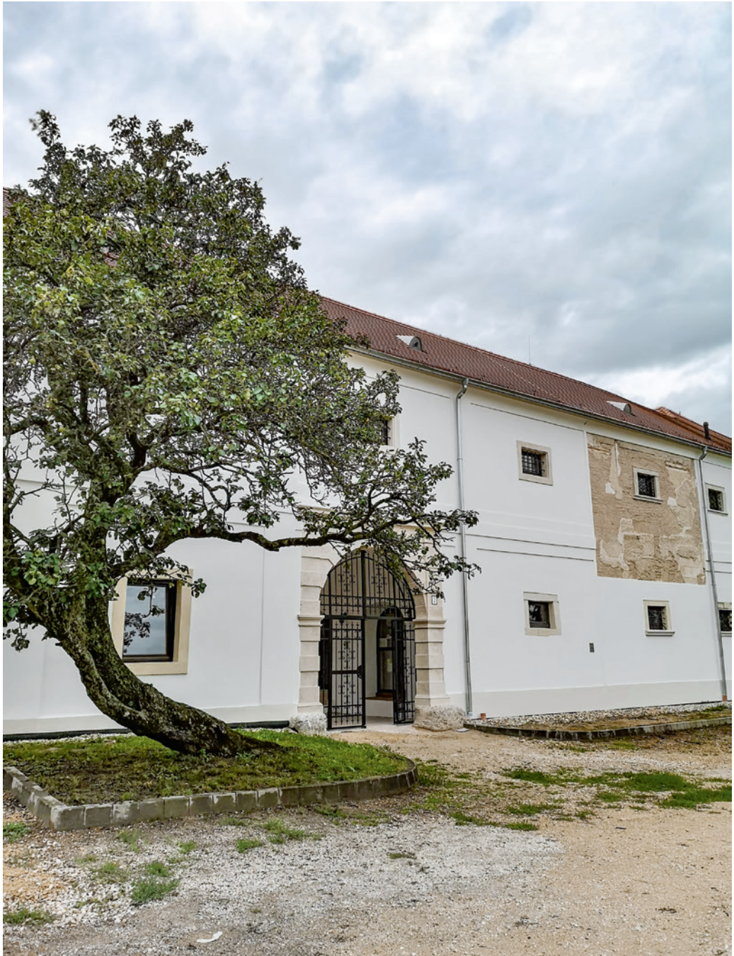
A 2020-ban felújított épület