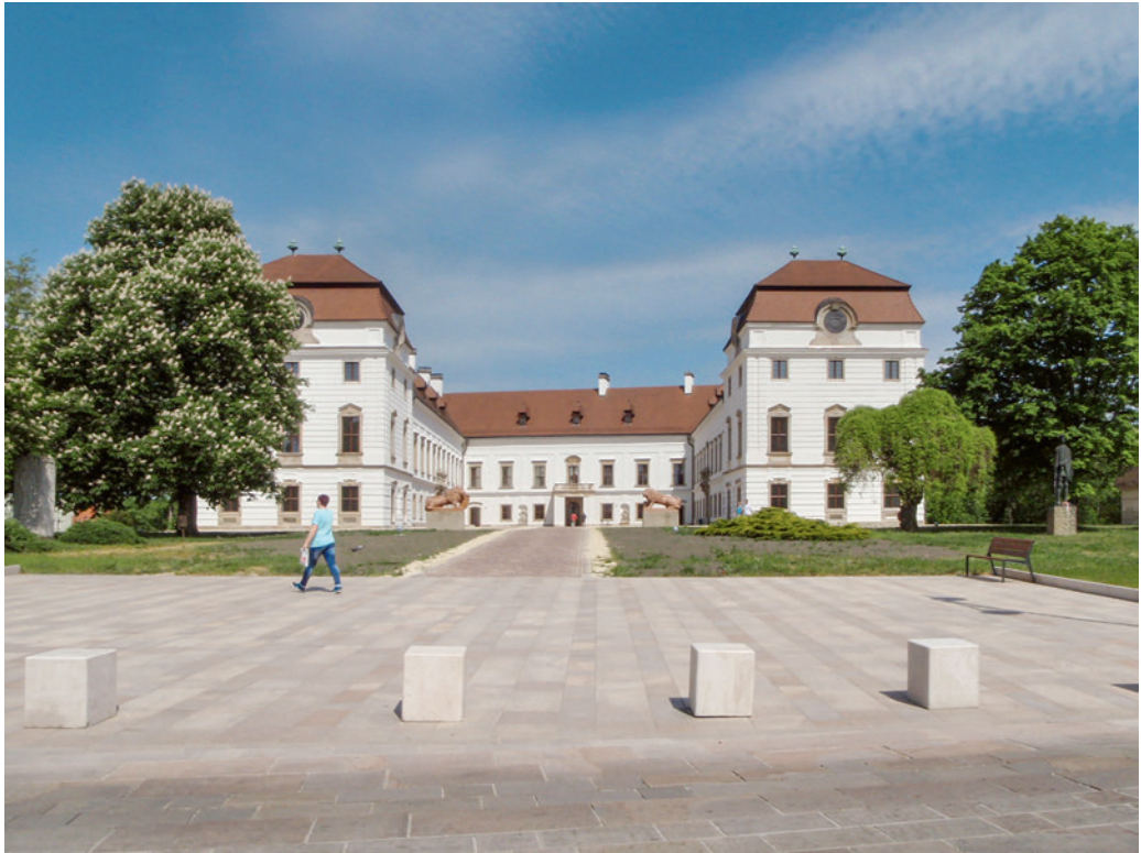
A pápai kastély a felújítás után