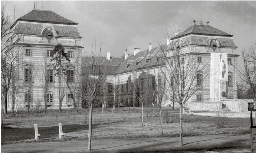
Esterházy-kastély Pápa 1961