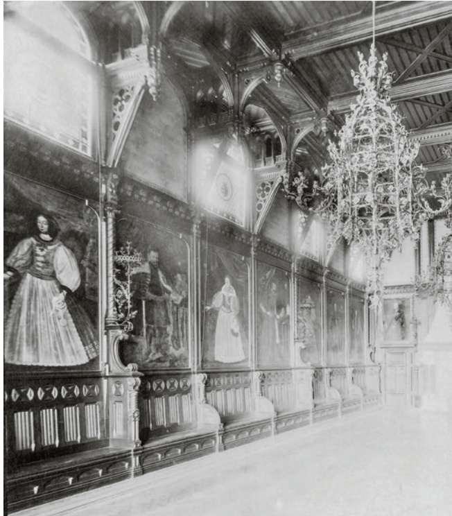
A nádasszékai „Ősök Csarnoka”