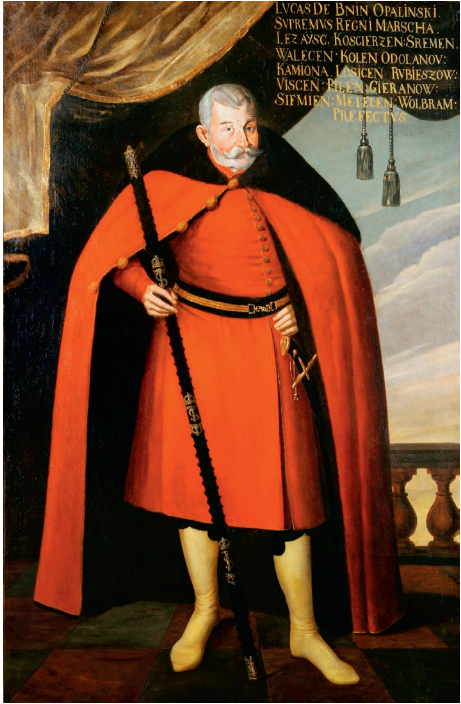
Lukasz Opaliński képmása, 1640 Czartoryski Múzeum, Kraków