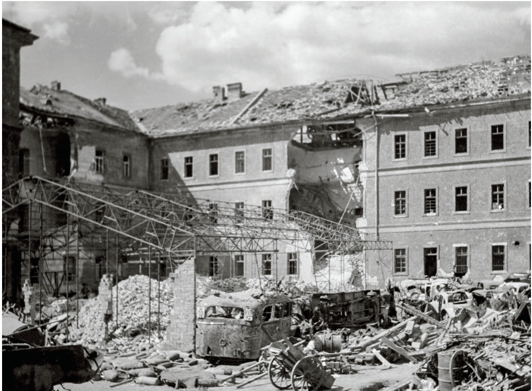
Háborús pusztítás és roncsok a múzeum belső udvarán, 1946