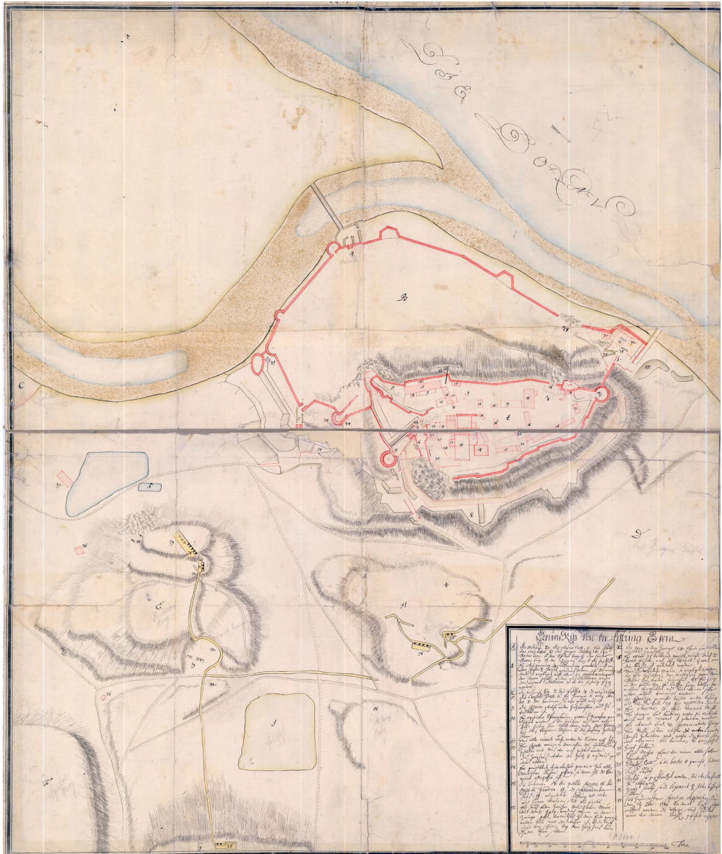
Esztergom és környékének kéziratos térképe, 1706