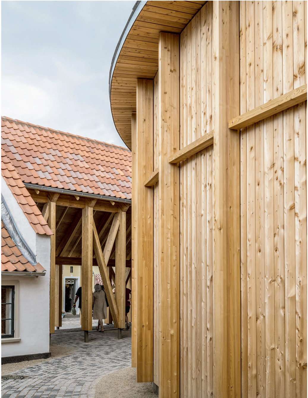
Hans Christian Andersen House, Odense Tervező: Kengo Kuma