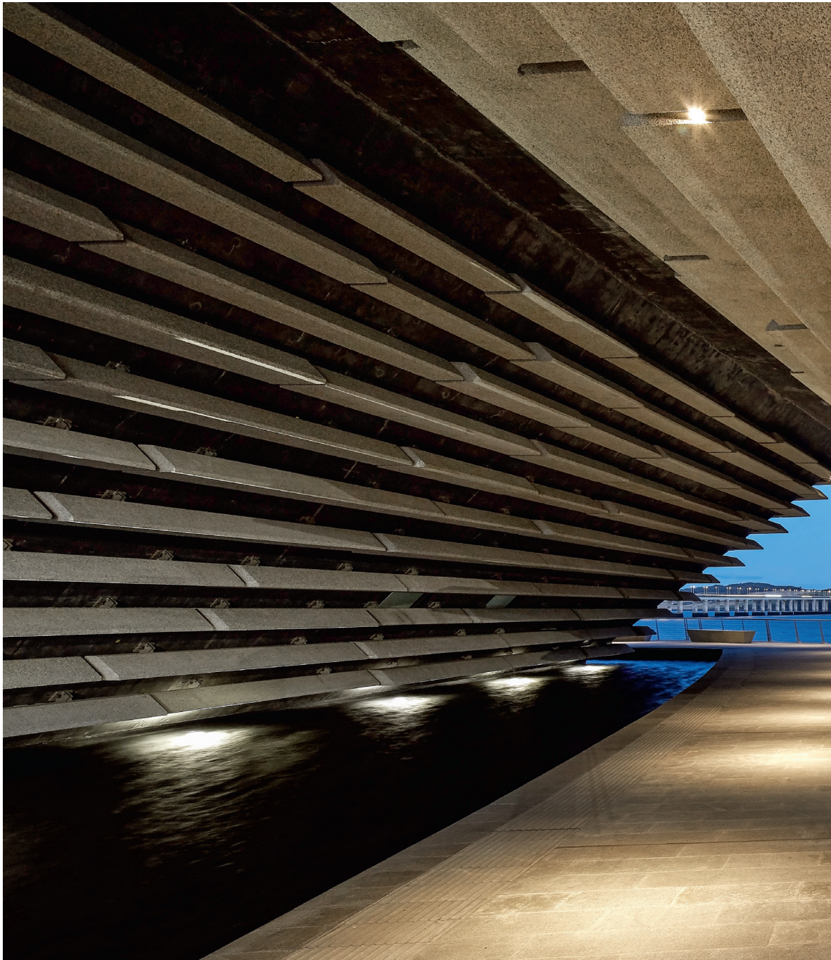
V & A Museum, Dundee, Skócia. Építész: Kengo Kuma