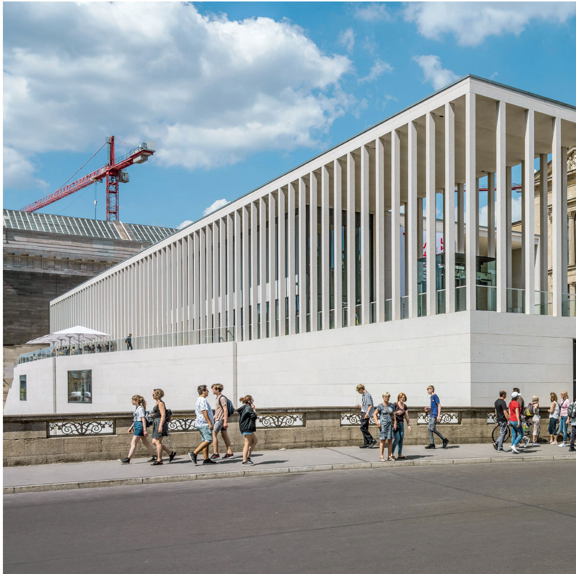
A James Simon Gallery bejárata a Múzeumsgiget felől, Berlin Tervező: David Chipperfield