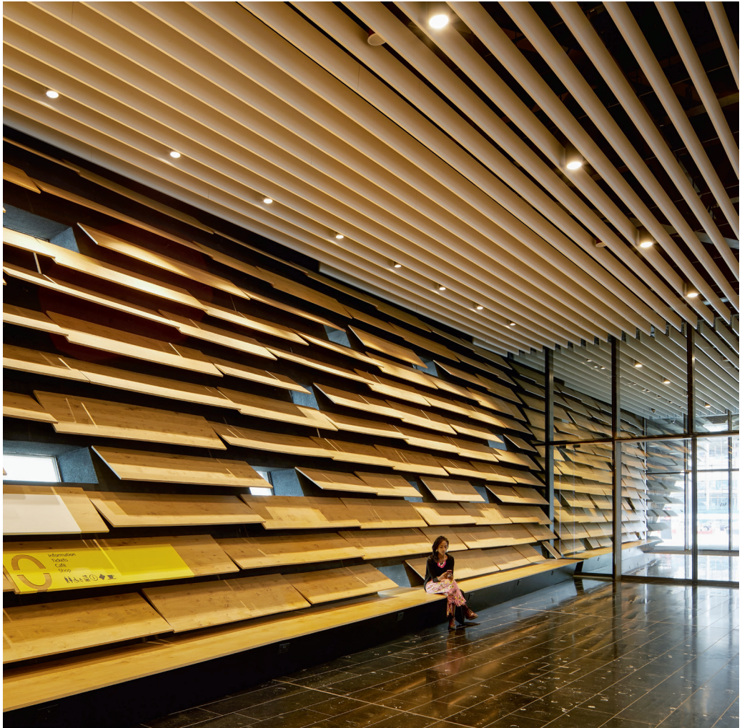
V & A Museum, Dundee, Skócia. Építész: Kengo Kuma