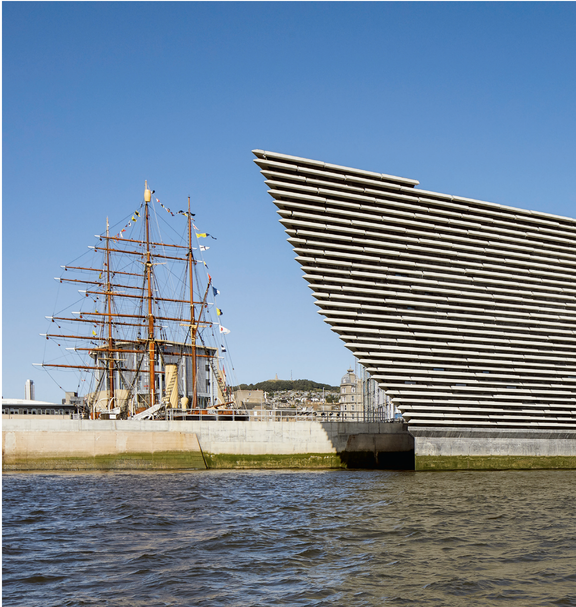
V & A Museum, Dundee, Skócia. Építész: Kengo Kuma