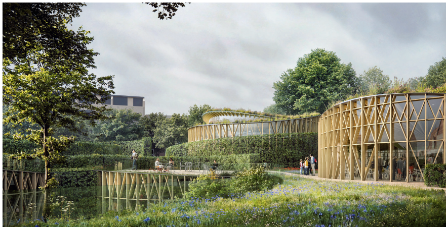
Hans Christian Andersen House, Odense Tervező: Kongo Kuma