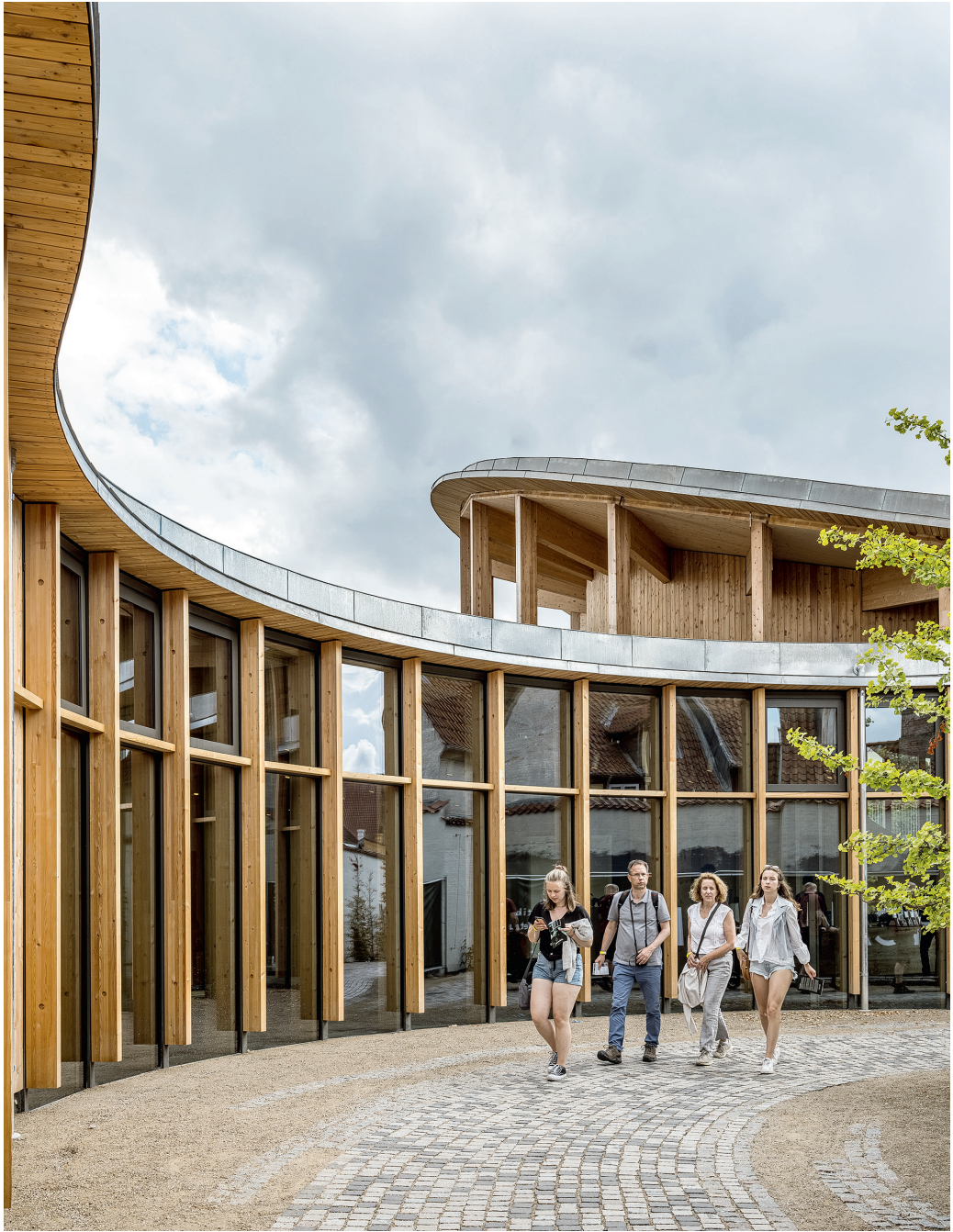
Hans Christian Andersen House, Odense Tervező: Kengo Kuma