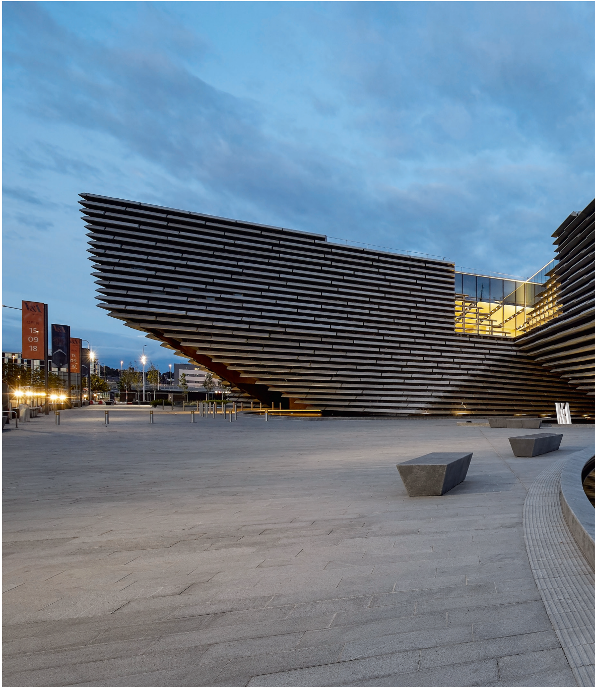
V & A Museum, Dundee, Skócia. Építész: Kengo Kuma