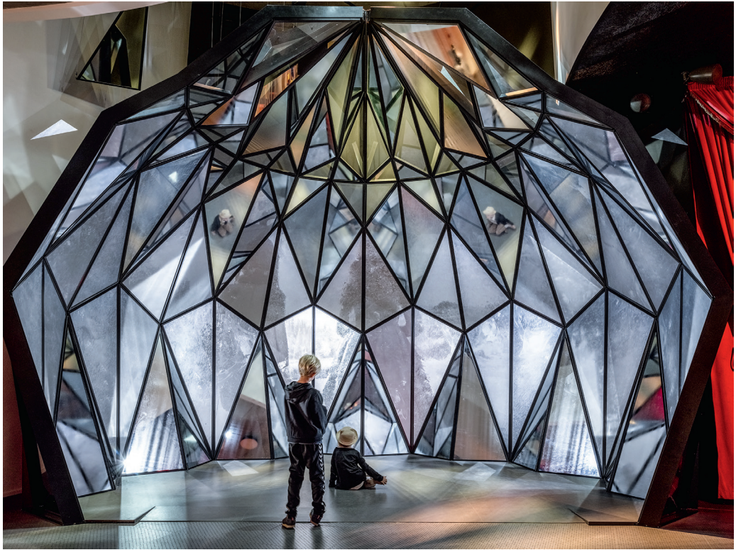
Hans Christian Andersen House, Odense Tervező: Kengo Kuma