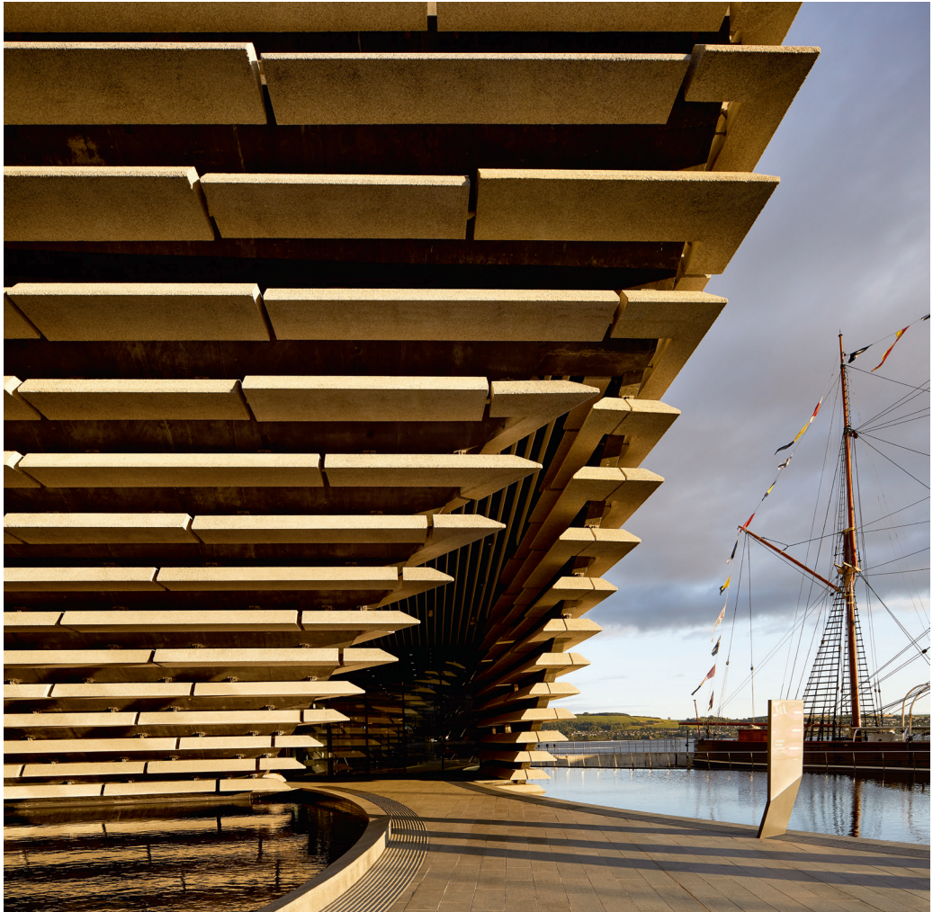
V & A Museum, Dundee, Skócia. Építész: Kengo Kuma