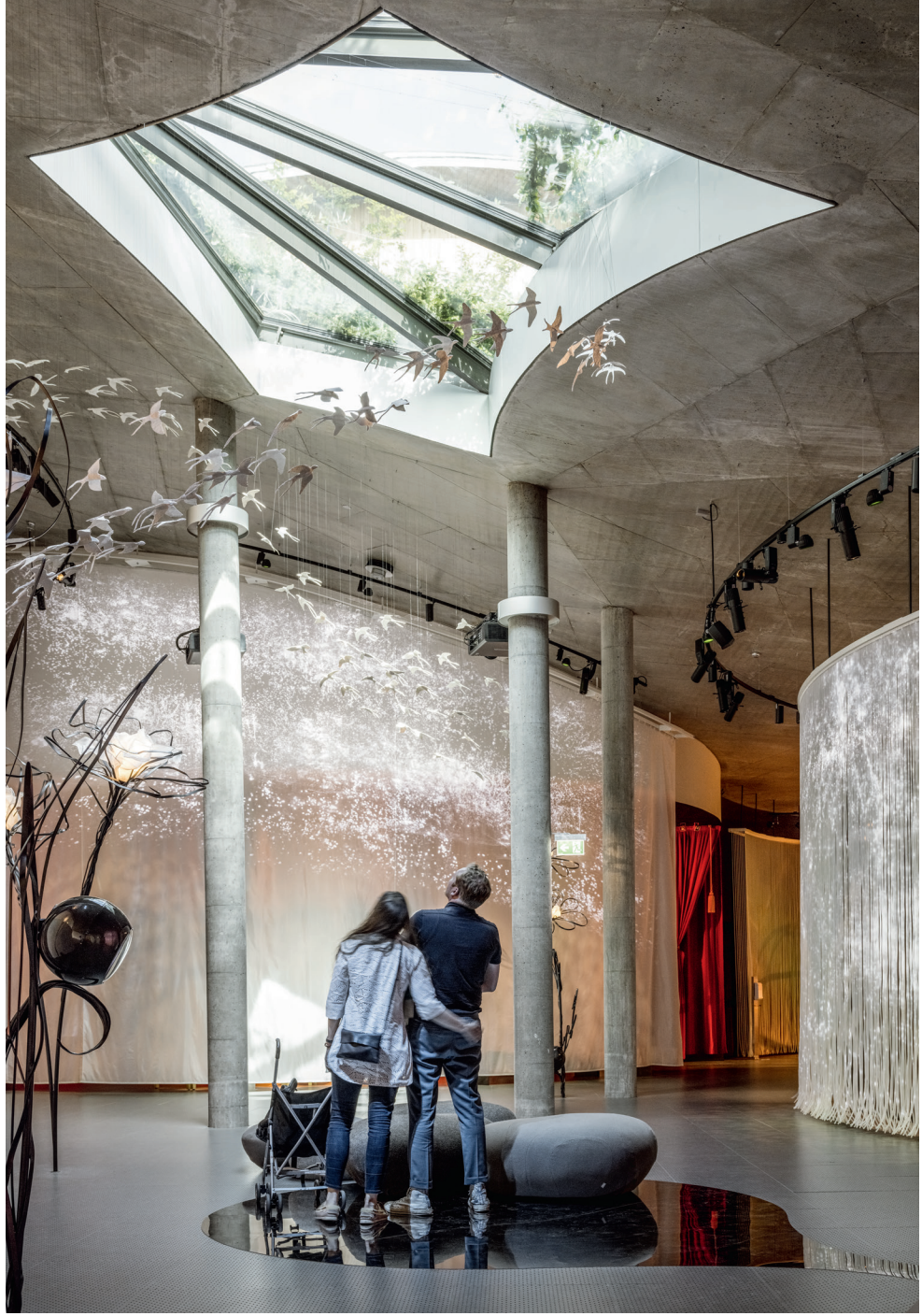
Hans Christian Andersen House, Odense Tervező: Kengo Kuma.