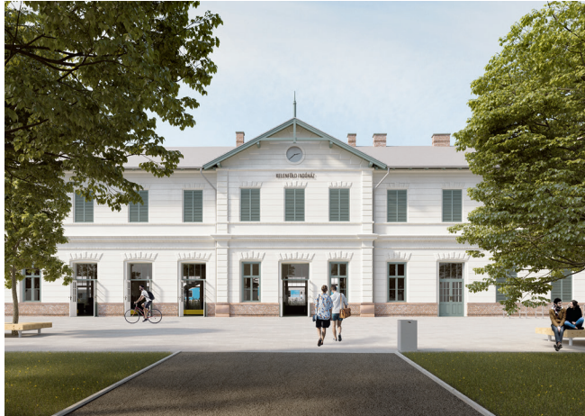
Látványtervek a Kelenföld Indóház rekonstrukciójához Magyar Műszaki és Közlekedési Múzeum