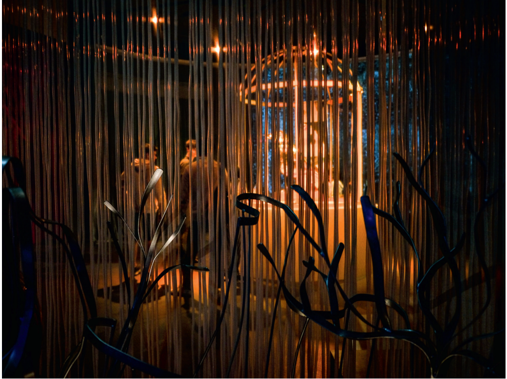
Hans Christian Andersen House, Odense Tervező: Kengo Kuma