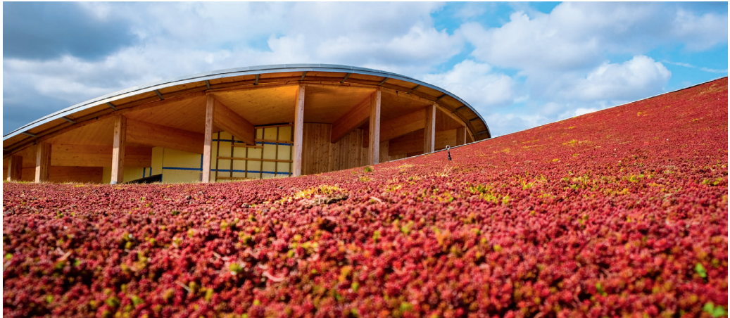
Hans Christian Andersen House, Odense Tervező: Kengo Kuma