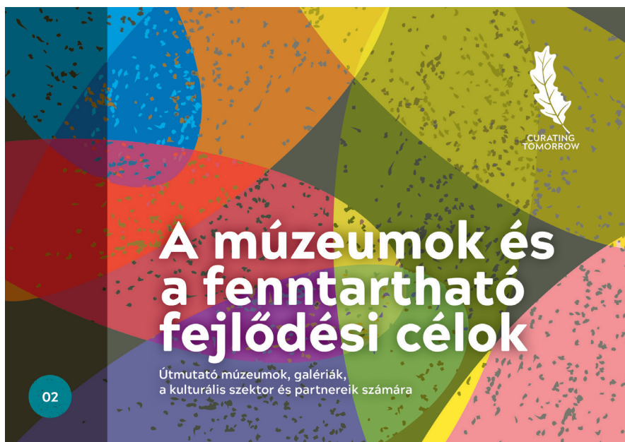
A kötet címlapja