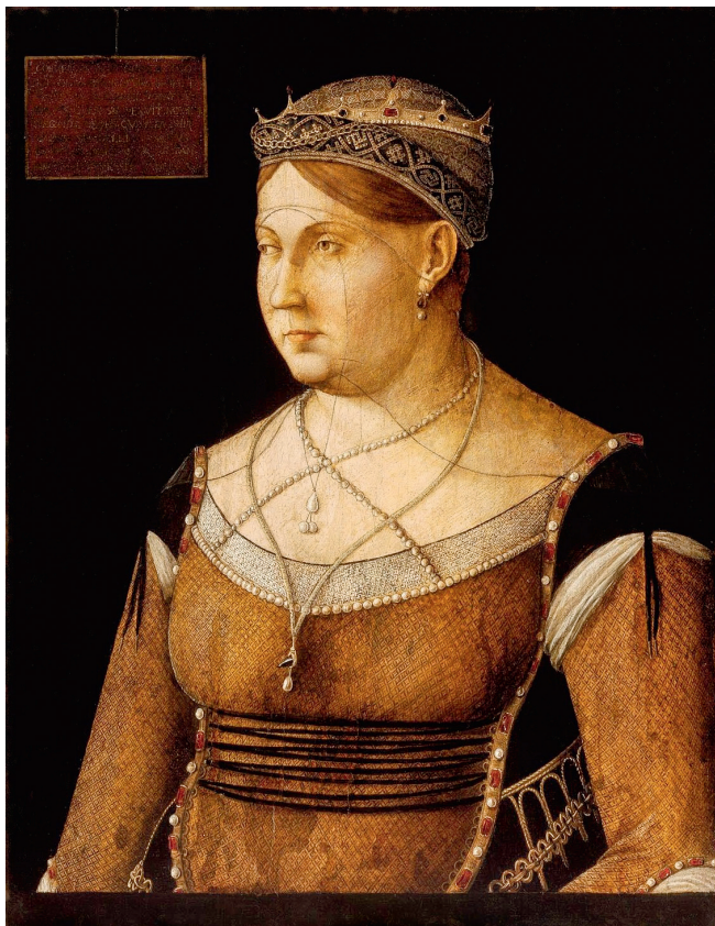
Gentile Bellini: Caterina Cornaro , 1500 körül