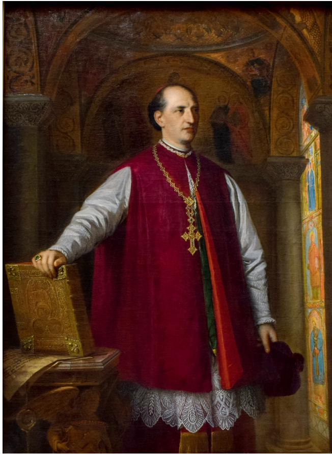
Kovács Mihály: Ipolyi Arnold , 1880