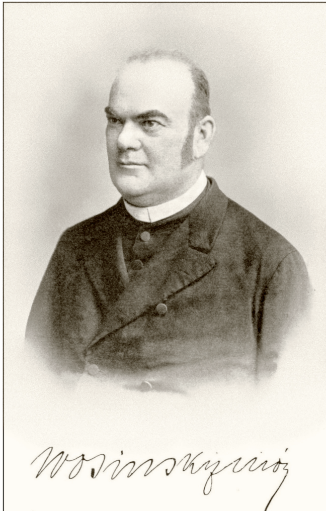
Wosinsky Mór fényképe, 1908 Forrás: Wikipedia