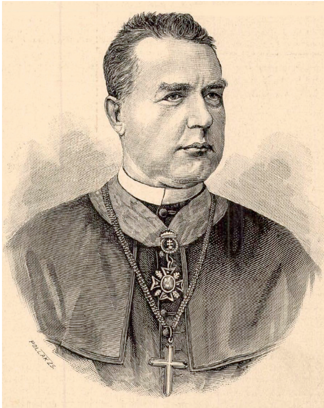
Pollák Zsigmond: Hornig Károly, 1888