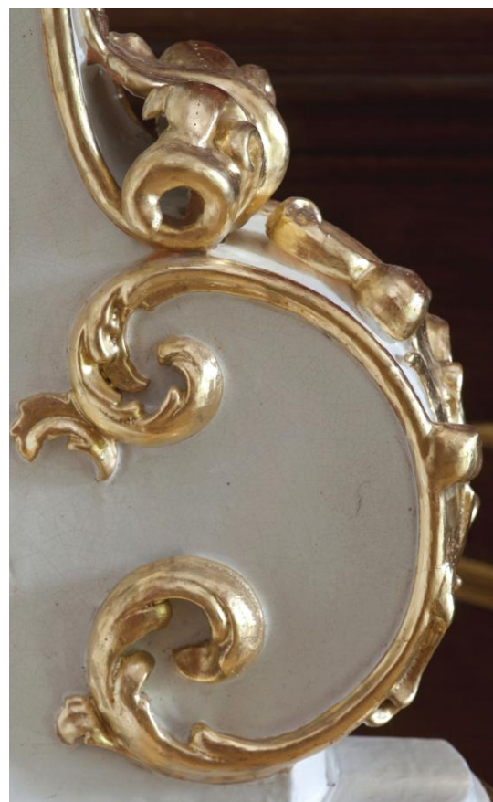
19. ábra: A plasztikus rész restaurálás után