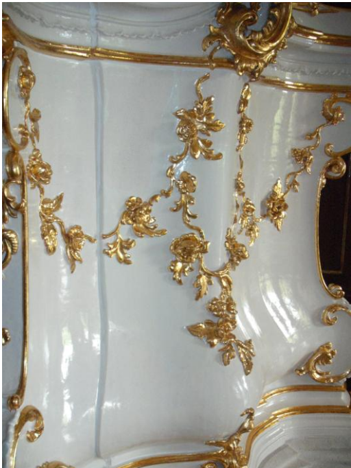
31. ábra: A formailag megfelelő gipsz kiegészítés felújítás, aranyozás után