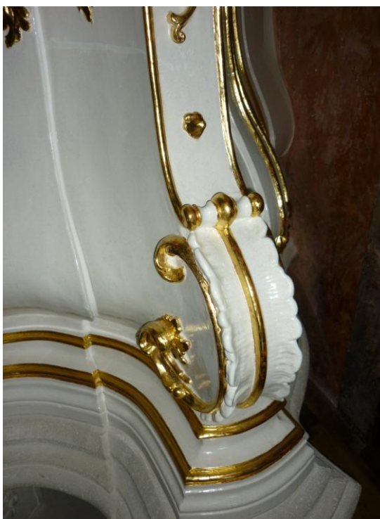
40. ábra: Alsó rész egy részlete restaurálás után

A közelmúltban, a felújítás óta eltelt közel tíz év után, a kastélyban tett látogatás alkalmával elvégzett szemrevételezés eredményeként elmondható, hogy: mindkét kályha állapota pontosan olyan, mint restaurálásukat követően, a munka átadásakor. A termekben télen fűtés van, és bár a páratartalom nagyon alacsony, a restaurált fa falburkolattal, és parkettával ellentétben ez nem okozott szemmel látható