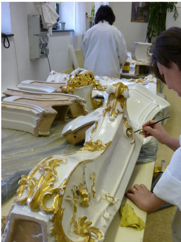
20. ábra: A hidegkréta alap egyenletes felvitele ecsettel

Az aranyozás előtt nagyon fontos volt a tökéletesen sima kréta alapozás elkészítése. A krétát ecsettel vittük fel, több rétegben. Ott ahol szélesebb volt a felület, száradás után, ha szükséges volt különböző finomságú polír-szivacsokkal és acélgyapattal segítettük a hibátlan felszín elérését. Törekedtünk azonban arra, hogy a krétát úgy hordjuk fel a felületre, hogy ne legyen szükség csiszolásra és egyéb finomításra, kivéve az acélgyapattal való felfényezést. (20. ábra)