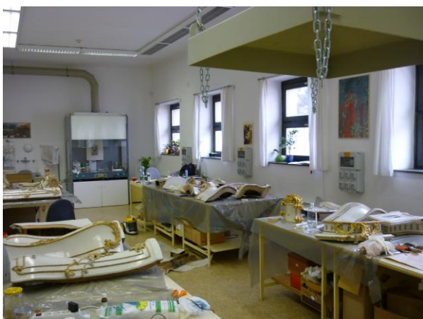
7. ábra: A lebontott elemek a restaurátor műhelyben