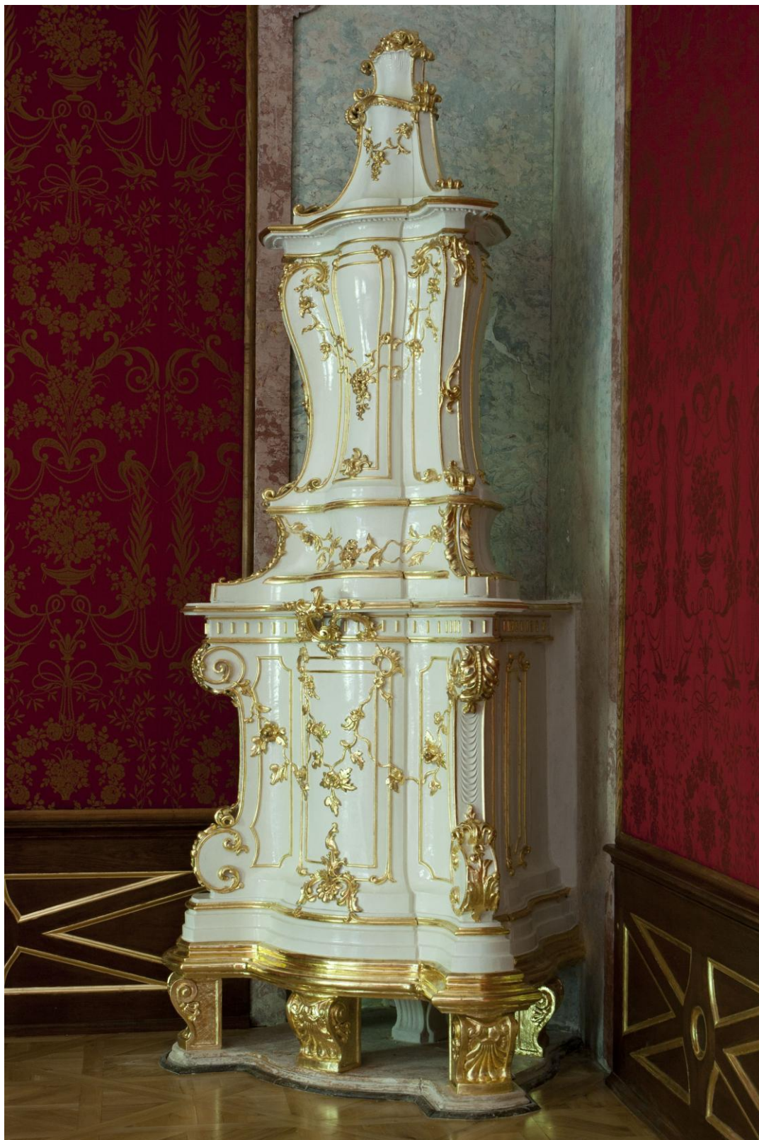
41–42. ábra: . A Vörös-szalón kályhája