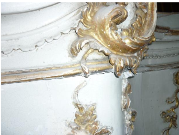
37. ábra: A központi dísz restaurálás előtt