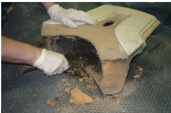
11. ábra: Az egyik elem agyagos, kormos, kátrányos szennyeződésének tisztítása