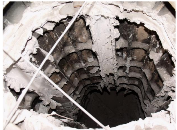
34. ábra: A kályha belül, stukatúr gipsszel van durván összeállítva

A rendelkezésre álló igen rövid határidő, valamint a kályha megfelelő szerkezeti állapota miatt az a döntés született, hogy a kályhát ne bontsuk szét, hagyjuk meg ebben az állapotában és kizárólag esztétikai felújítás történjen. Ez a döntés viszont azt jelentette, hogy a restaurálást a helyszínen kellett elvégezni.