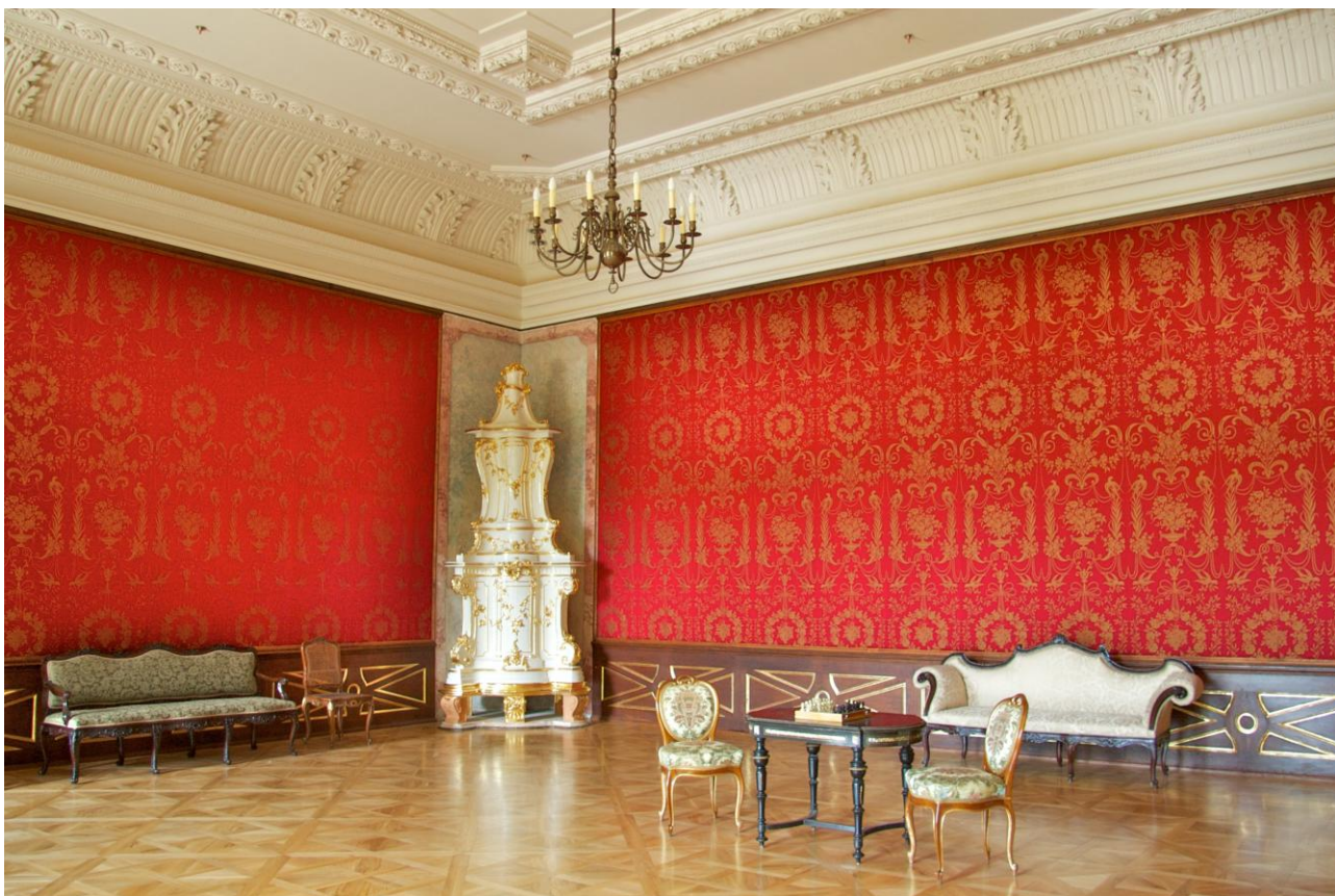
I-3. ábra: A kastély felújított reprezentatív termei