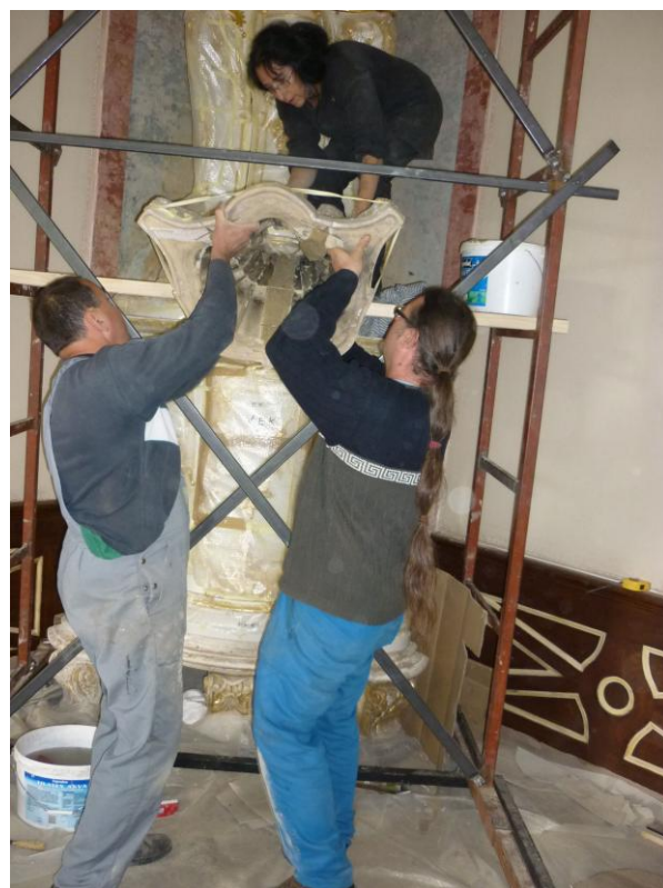
26. ábra: Az összeállított elemek felhelyezése

A talpzat restaurálása, aranyozása a kályha felépítése után a helyszínen történt. A profilos perem egyenetlen felszínű volt, a kő erősen sérült, és az aranyozás is csak nyomokban volt látható, a megmaradt kréta alap sok helyen porlott. A szennyeződést és a rossz állapotú alapozás maradványokat el kellett távolítani, ezt követően sellakkal védtük le a felszínt. Az egyenetlenségeket Ardex simítóanyaggal töltöttük