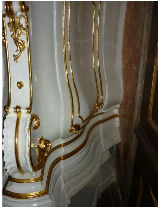
33. ábra: A felesleges gipsz eltávolítása, és restaurálás, aranyozás után

A rendelkezésre álló igen rövid határidő, valamint a kályha megfelelő szerkezeti állapota miatt az a döntés született, hogy a kályhát ne bontsuk szét, hagyjuk meg ebben az állapotában és kizárólag esztétikai felújítás történjen. Ez a döntés viszont azt jelentette, hogy a restaurálást a helyszínen kellett elvégezni.