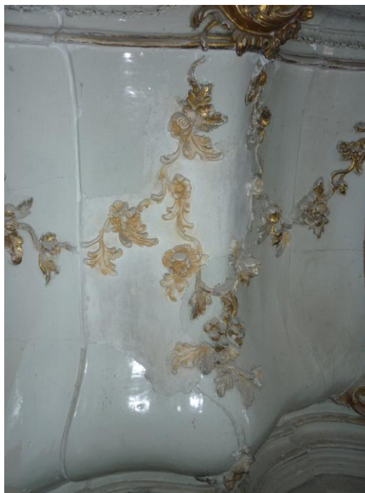
30. ábra: A formailag megfelelő gipsz kiegészítés felújítás előtt

A gipszet minden illesztésnél vastagon, összevissza kenték a mázas felületre. (32–33. ábra) Ez akár restaurálás történeti momentumnak is felfogható a korabeli módszerekről, mivel a restaurálás során (hiányzó részek pótlása, a kályha felépítése) semmilyen más anyagot nem használtak, csupán gipszet. Ez egyrészt megakadályozta, hogy a hagyományos technikával építsük újra a kályhát, másrészt viszont, mivel egységes „monolit tömbé” alakították, szerkezetileg erős lett. (34. ábra)