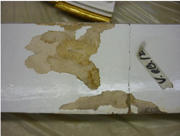
15. ábra: A lepattogzott máz restaurálás előtt