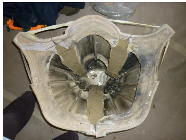
25. ábra: A felhelyezés előtt összeállított második szint

felépíteni. A 3. és 2. szint elemeit még a felhelyezés előtt összeállítottuk, az egyes elemeket akárcsak a többi szintnél agyaggal és kályhás kapcsokkal rögzítettünk, majd így emeltük fel rá. Végül a csúcspdíz is a helyére került. (25–26. ábra)