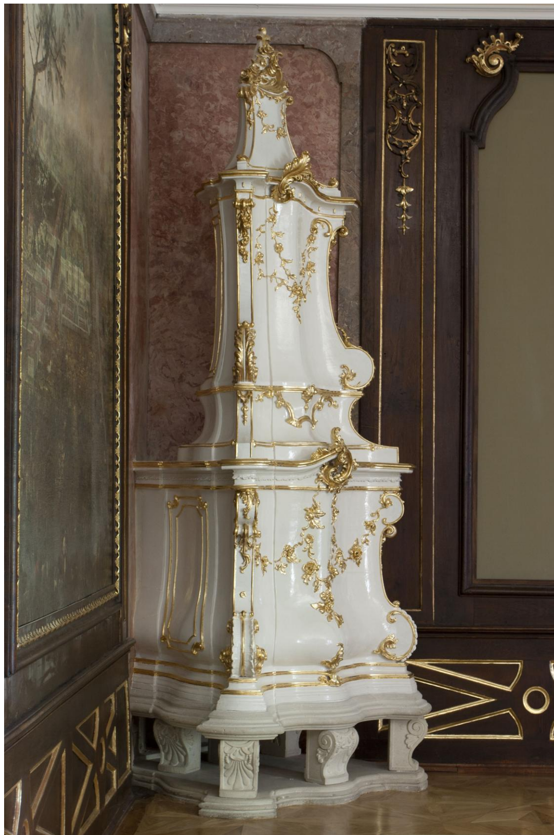
43–44. ábra: A Nádor-terem kályhája