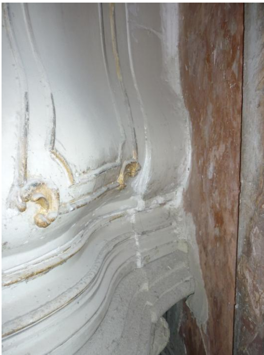
32. ábra: Gipszsel összekent felület restaurálás előtt