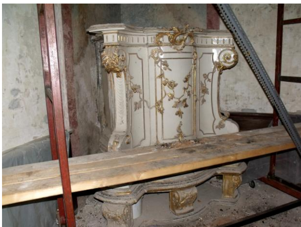
6. ábra: A félig lebontott kályha