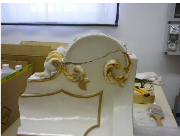
17. ábra: A hetedik szint nagy plasztikus hiányának elhagyolt kiegészítése Ardex S27W-vel

A kályha 7. szintjének nagy plasztikus hiányát Ardexszel pótoltuk. A negatív formát, a másik oldalon lévő motívumról vettük, mivel azonban ez a hiányzó rész tükörképe szükség volt némi igazításra. (17. ábra)