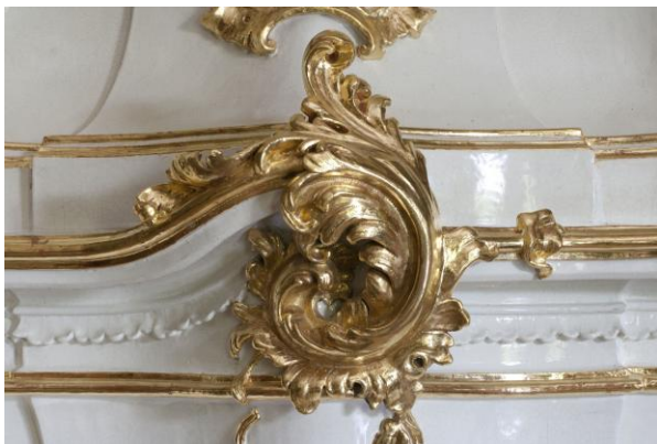
38. ábra: A központi dísz restaurálás után