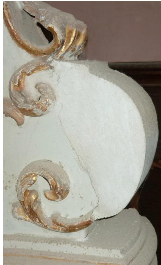
18. ábra: A plasztikus rész restaurálás előtt, még az eltávolított gipsz kiegészítéssel

Az elkészült kiegészítés felületét sellakkal vontuk be, majd több réteg autó szóró-kittel vontuk be, hogy a mázhoz hasonló, teljesen sima felületet érhesünk el. Ez a megoldás szép sima felszín ad, és jól illeszkedik az eredeti mázhoz. Az eredeti