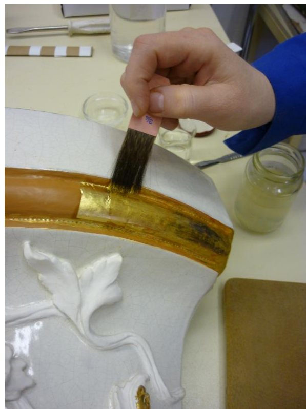
22. ábra: Az arany rögzítése a bólusz rétegre

A kályha minden elemét felül és belül is kályhádróttal összekapcsolva építettük fel, agyaggal töltöttük ki belül a réseket az illesztések