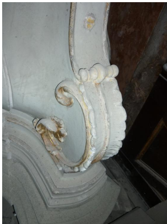
39. ábra: Alsó rész egy részlete restaurálás előtt