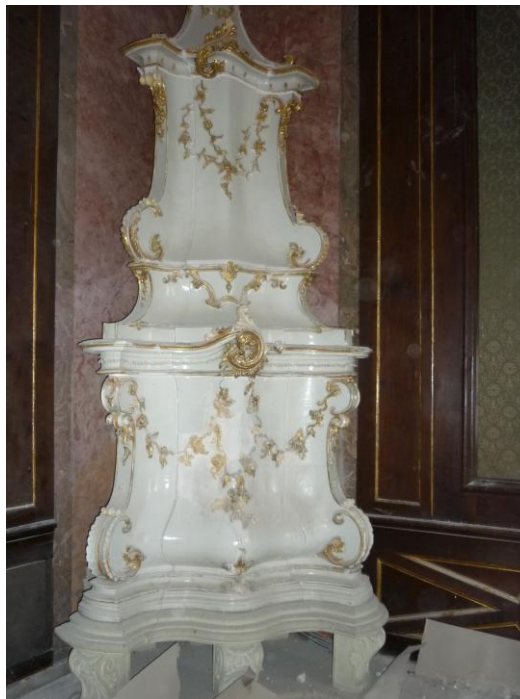
29. ábra: A Nádor terem kályhájának restaurálás előtti állapota

A talapzat feletti 8 szint 42 elemből áll. A kályha ornamentikája dúsan aranyozott, és az arany alatt szintén narancsszínű bólusz található. Hasonlóképpen a másik kályhához a fenti részekben jobb állapotban maradt meg az aranyozás. Információnk szerint a 60-as években restaurálták, a kiegészítés gipszből készült, amely formailag megfelelő, szép munka. (30–31. ábra) Az összeállítását, fugázását viszont rendkívül igénytelenül sikerült kivitelezni.