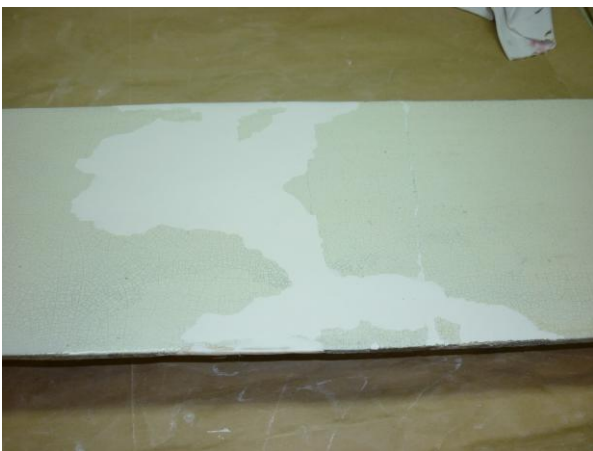
16. ábra: Kiegészítés Elastik poliészter-gyantával

A kályha 7. szintjének nagy plasztikus hiányát Ardexszel pótoltuk. A negatív formát, a másik oldalon lévő motívumról vettük, mivel azonban ez a hiányzó rész tükörképe szükség volt némi igazításra. (17. ábra)