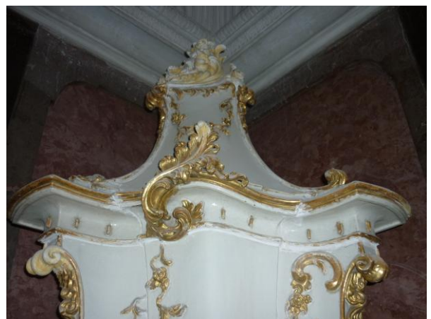
35. ábra: A felső szint restaurálás előtt

A tisztítás kizárólag a külső, mázas oldalára korlátozódott, kivéve a csúcspdísz és a 2. szintet, amelyeket a Vörös-szalón kályhájának elemeivel