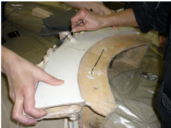
13. ábra: Egy összetört elem ragasztása ún. kályhás kapcsolás segítségével

Az aranyozott felületeket csak alkohollal tisztítottuk. Az igen óvatos folyamat után meghatároztuk, hogy a megmaradt kréta alapozásból melyek azok, amik megtarthatók, illetve melyeket lehet 5%-os nyúlenyvvvel vagy Paraloid B72-vel visszarakasztani. A teljesen porózus, tönkrement porló kréta maradványokat eltávolítottuk. Tisztítás után, a sérült elemeket kályhásdrót segítségével ún. kályhás kapcsolással összeállítottuk, majd ragasztottuk.