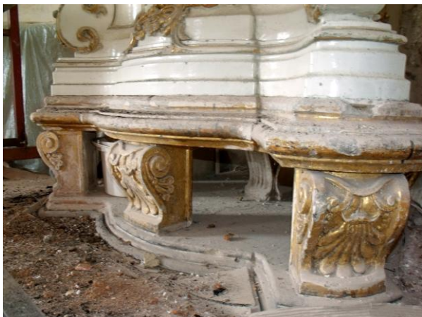
27. ábra: A talapzat restaurálás előtt

ki, csiszoltunk, majd erre sellak, és kréta alap került, végül a bólusz és a 23 karátos aranybevonat. Mivel meglehetősen széles felületről volt szó, tökéletesen sima alapot kellett kialakítani, először durva csiszolóvászakkal és hálókkaal, majd különböző finomságú polír-szivacsokkal, végül acélgyapottal értük ezt el. (27–28. ábra)