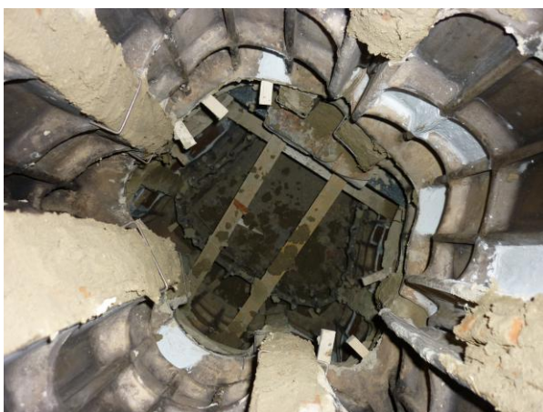
24. ábra: Az építés szokványos kályhaépítési eljárással készült

A 7. szint a kályha legnagyobb elemeiből áll, ezt a sort a kályha belsejéből lehetett építeni, előbb az elülső három elemet, majd a hátsókat. Mivel a kályhát nem fogják fűtésre használni nem képeztünk ki tűzteret. A kályha magasságára való tekintettel, valamint hogy egy váratlan ütés hatását megelőzendő az elülső nagy táblás elemet tetőlécekkel támasztottuk meg belülről. (24. ábra)