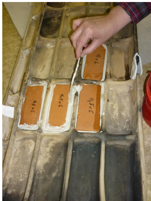
14. ábra: Összetört elem kapcsolokkal erősített ragasztással, belső béleléssel

A törött elemek mellett, minden esetben, ahol akárcsak egy kis repedés volt alkalmaztuk ezt a módszert. (13. ábra)