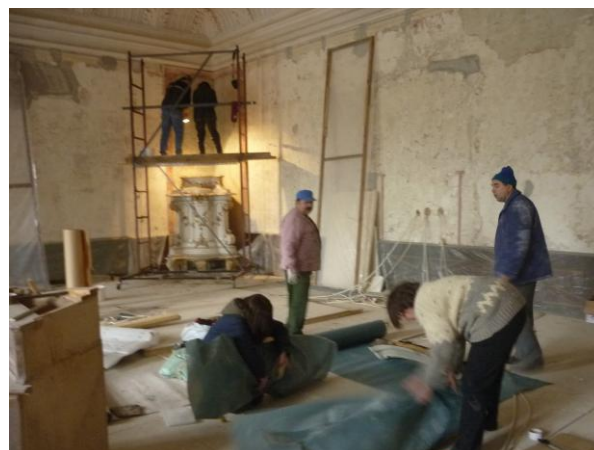
5. ábra: A kályha bontása

A kályha statikailag külső szemrevételezés alapján is gyengének látszott. Elemei sok helyen repedtek, töröttek voltak, a felső elemek szétváltak. A bontásakor pedig bebizonyosodtak következtéseink. Ez a munkafolyamat viszonylag gyorsan, 3 nap alatt történt meg. (5–6. ábra) A gyorsaságot nagyban elősegítette az elemeket összetartó drót gyengesége, a laza, pergő fugák, és a belső tapasztásnál használt agyag összehsugorodása. Minden egyes szétbontott darabot (8 szinten összesen 39 elem), a talapat kivételével a Veszprémi Laczkó Dezső Múzeum restaurátor műhelyeibe szállítottuk, ahol a további munkát végeztük. (7–8. ábra)