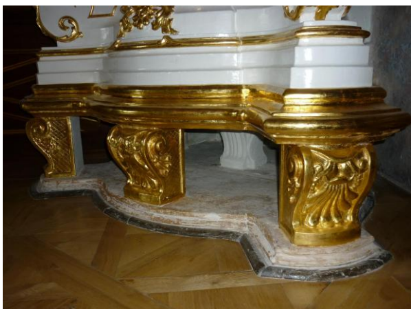
28. ábra: A talapzat restaurálás után

A Nádor-terem kályhája stílusában, szerkezetében, magasságában a Vörös-szalomban lévő kályhával harmonizál, bár kissé egyszerűbben díszített. Az eltávolítható, két szint elemeinek vizsgálata alapján, szintén Bernhard Erndt bécsi manufaktúrájában készült. (29. ábra)