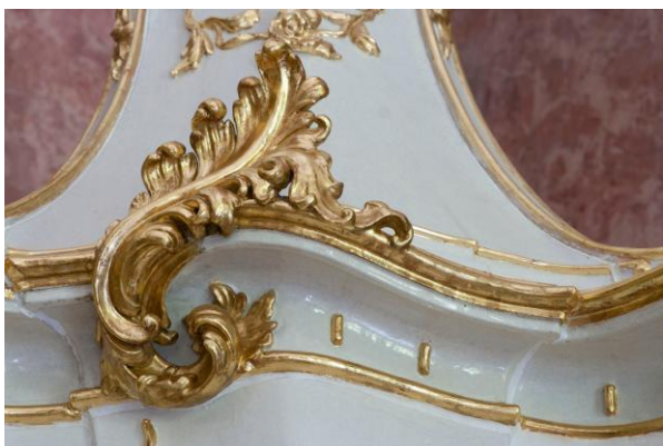
36. ábra: A felső szint restaurálás után

együtt tisztítottunk, restauráltuk. A fugázáshoz használt felesleges gipszet, amelyet vastag rétegben vittek fel a felületre eltávolítottuk. A restaurálás egyik legnagyobb kihívását ez jelentette. A plasztikus gipsz kiegészítéseket kisebb-nagyobb átalakítással, finomítással megtartottuk, mert formailag jók voltak. A kályha további restaurálása, aranyozása a Vöröszalonban lévő kályhához hasonlóan történt. A talpazatot, mivel '60-as években készített rekonstrukcióról volt szó nem aranyoztuk. (35–40. ábra)