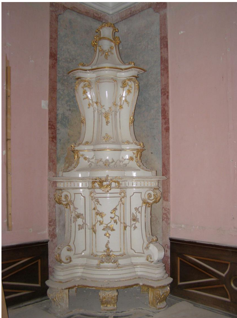
4. ábra: A Vörös szalon kályhája restaurálás előtt

aranyozás könnyebb, precízebb elvégzése indokolta volna mindkét kályha esetében a szétbontásukat. Azonban ezt csak az egyik, a Vörös-szalomban lévő kályha esetében tudtuk kivitelezni. (4. ábra)