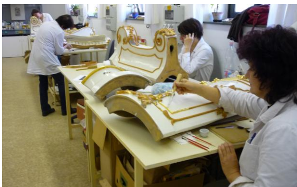
8. ábra: A munkálatok közben