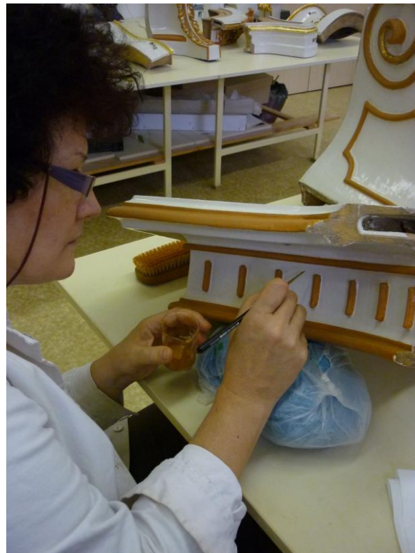
21. ábra: A bólusz alapozás felvitele a kréta alapozásra

aranyozást védje, de csomagoló anyag az illesztési felületekre nem kerülhetett. (23. ábra)