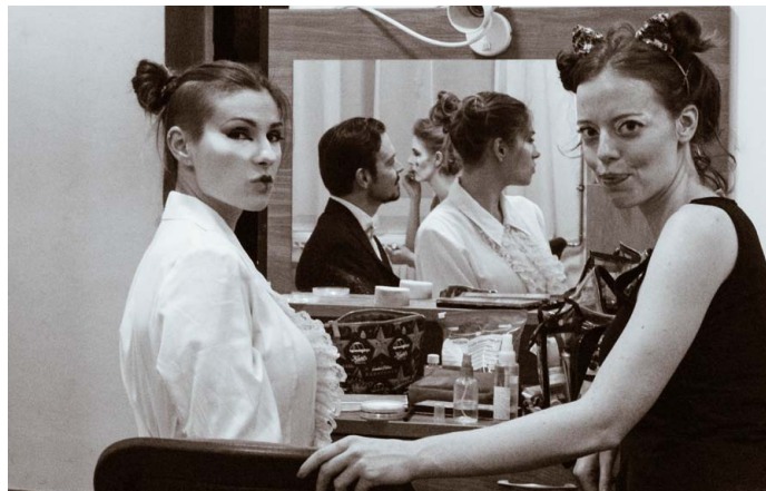
Fotó: Zsidek Barbara (Bari)

Ezúton is köszönöm a műhelyvezetőknek, a szervezőknek, a résztvevőknek – és persze a fantasztikus konyhabrigádnak – ezt a három és fél napot: hogy nemcsak tizenévesen, de harmincas családósként is ekkora élményt jelenthet egy ilyen találkozó Veletek!