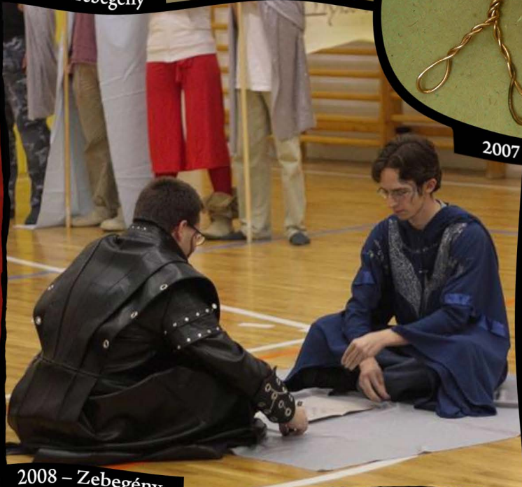
2008 – Zebegény