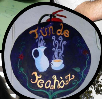
2006 – Tata