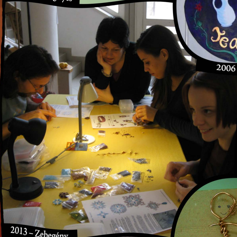
2013 – Zebegény