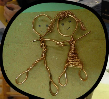
2007 – Monor