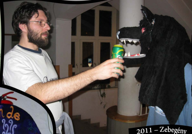
2011 – Zebegény