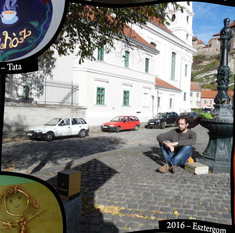
2016 – Esztergom