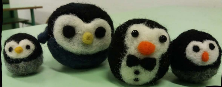
2018 – Seregélyes