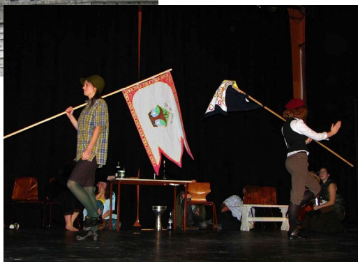
Fotó: Kostyál Zsigmond (Sú) [2009]