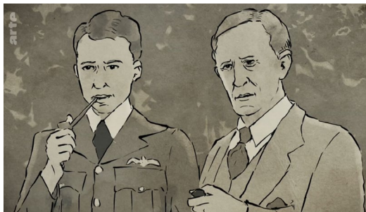
Kép a dokumentumfilmből

Ha valakit érdekel a dokumentumfilm készítésének története is, ajánlom még a Német Tolkien Társaság TolCast című podcast-sorozatának 194. epizódját, melyben a két rendező ad bepillantást a háttérmunkálatokba, illetve a 188. epizódot, amely a szeptemberi premierről számol be.