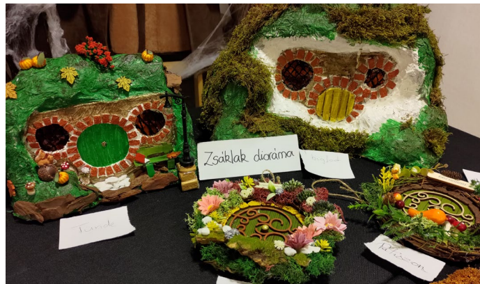
Fotó: Selmeczi Szonja (Níniel-Nienor)

dégnek számítok. A lábaim még mindig nem képesek az ütemnek megfelelő pillanatban földet érni, de mostanra már kellő önbizalommal tudok a színpadon ugrálni ahhoz, hogy a közönség laikus részét meggyőzzem arról, hogy tudom, mit csinálok. És ha már a színpadnál tartunk, nem lehet szó nélkül