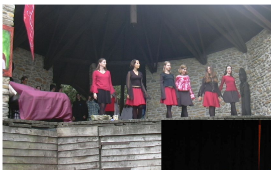
Fotó: Kápolnai Viktória [2004]

Ahogy minden izgalmas újdonság lecseng előbb-utóbb, úgy a társaságon belüli lelkesedés is alábbhagyott idővel az ír tánc irányába, de azóta is vagyunk páran, akik aktívan üzzük ezt a fantasztikus tánc-sportot. Teljesen azért nem kopott ki az MTT életéből – időről időre előbukkan egy-egy célí műhely a KÖMT-ön, táborban; illetve több Tolkien Napon is fellépett már az Erin írsztepp társulat, amelynek jómagam is tagja vagyok. Jelenleg több írtánc-iskola is akad kis hazánkban, így, ha valakinek felkeltette az érdeklődését ez a különleges táncstílus, több remek lehetőségből is választhat.