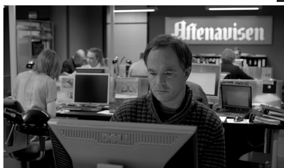
Mammon, norvég tévésorozat (2014)

Az HBO azonban az elmúlt évtizedben más területeken, az Egyesült Államokon kívül is aktív szereplő lett. A fordulat