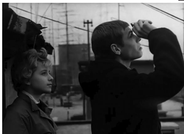
Nap a hálóban (Štefan Uher, 1962)

A szlovák filmben nemcsak a gyártási modellek, a szereplők és a stáb nemzetiségi összetétele, hanem a befogadás is gyakran transznacionális módon működik, amint azt Plicka folklórfilmjei kapcsán érintettem. Ehhez hasznos meglátásokat tartogathat Andrew Higson azon szempontja, mely a (transz)nacionális film fogyasztásközpontú elemzését javasolja. 46 Megállapítása, miszerint a brit közönség hazáiként fogyasztja az amerikai filmet, ebben a kontextusban abban találja meg a párját, hogy a cseh filmnek a szlovák nézők is természetes közönségét képezik. Ha megnézzük a mindenkori szlovák mozik műsorszerkezetét, rendszeresen szerepelnek a kínálatban cseh filmek, fesztiválokon is gyakori a csehek és a szlovákok közötti kooperáció. Ebből a szempontból felettébb ironikus, hogy Csehszlovákia felbomlása után a csehszlovákizmus „elképzelt közösségének” fikciója bizonyos fokig nagyon is valóságossá vált. A kritikai transznacionalizmus elmélete szerint a keresztmozgások nem binárisak, nem érvényes rájuk