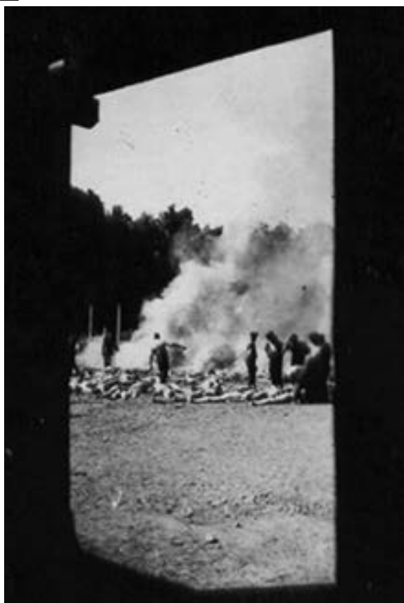
280. számú Sonderkommando-fénykép

fogyolyban testesül meg: a kegyetlen fegyelem és gépiesített erőszak közepette felvett mechanikus mozgásban, látszólagos érzelemmentességben, amellyel az eseményekhez fizikailag közel, ugyanakkor pszichológiailag távol helyezkedik el. 35 A 280. és 281. fényképek kompozíciója emblematikus: a kép oldalsó, vastag fekete keretébe maga a gázkamra sötétjében rejtőzködő ágens komponálódik bele, az ajtókereten át, a világosba kinéző szubjektív nézőponti helyzet, ami a film két dramaturgiailag kiemelkedő pontján is visszaköszön. A gázkamrát csodával határos módon túlélő fiú megvizsgálása feltűnően hasonló kompozícióban jelenik meg: Saul a háttérbe húzódva, az ajtókereten túlról figyeli ahogyan egy SS orvos diagnosztizálja, majd megfojtja a még lélegző fiút. Saul – aki általában csak maga elé „néz” a lágérben, mint aki nem akarja „látni”, mi történik – ebben a jelenetben szinte tapintható kon-