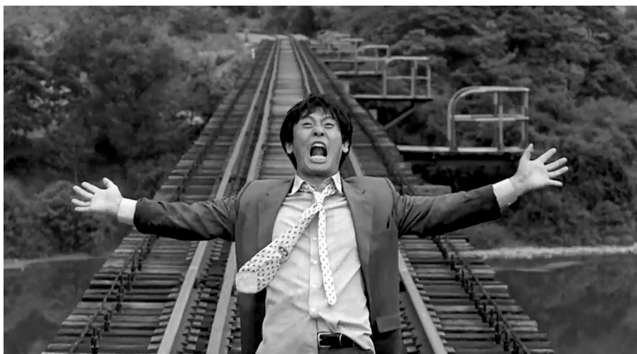
Mentolos cukorka (Sol Kyung-gu)

hiátus határol el egymástól (bennel a két esztendővel, amíg Lee a kulturális minisztérium élén tevékenykedett 2003-tól 2004-ig), úgy is tekinthető, mint a műfaj felé vezető, majd attól eltávolodó szerzői út. Legkevésbé melodrámának nevezhető művei a Zöld hal (1997) gengszterfilmje és a Gyűjtögetők (2018), a műfajhoz legközelebb álló két alkotása az Oázis (2002) és a Rejtett napfény (2007), a közöttük elhelyezkedő Mentolos cukorka ( Bak-ha-sa-tang , 1999) és a Poézis (2010) pedig egyaránt tekinthető átmeneti filmnek a két végpont között. Mindazok a motívumok, amelyek végigvonulnak a teljes életművön, szerzői egységbe foglalva a sokféle történetet, meglehetősen melodráma-kompatibilisek: Lee-t visszatérően foglalkoztatja a széthulló családok, a bűn és bűnhődés, valamint a traumafeldolgozás tematikája – a hangsúlyok azonban mindig másik elemre tevődnek, erősen befolyásolva az adott mű zsánerjellegét.