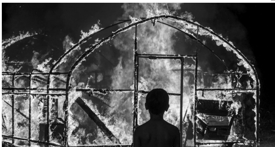
Gyűjtogatók (Yoo Ah-in)

hogy elősegítse a néző érzelmi azonosulását a melodramái tetőpontokon – ugyanakkor nem töri meg a realista ábrázolásmód „a kamera mint láthatatlan megfigyelő”-elvét. Ezt a szoros kapcsolatot az átélést szolgáló valóságosság és melodramái érzelmkitörések között jelzi az is, hogy a markánsan elidegenítő formai megoldásokat Lee éppen a vendégműfajok esetében használja, ezzel is jelezve rendhagyó – ezáltal pluszjelentéssel bíró – jelenlétüket. A legszembeötlőbb példa erre az Oázis történetébe ékelt zenés-táncos fantáziajelenet, amelyben az agyparalizise folytán tolószékhez kötött nő megelevenedett képzeletét láthatjuk a kibontakozó románcról. Gong-ju igen erős nézői érzelmeket provokáló karaktere (főként a lehengerlően intenzív színészi játék révén, amellyel Moon So-ri visszadja a betegséget) hirtelen teljesen hétköznapi nővé alakul át, miközben a látványvilág átlényegül és nem-diegetikus zene társul hozzá – ahogy az oázist ábrázoló falikép indiai alakjai életre, majd táncra kelnek a szobában, mint valami tündérmese-musicalben, a sötét, éjszakai képsor hirtelen magától kivilágosodik és megtelik színekkel.