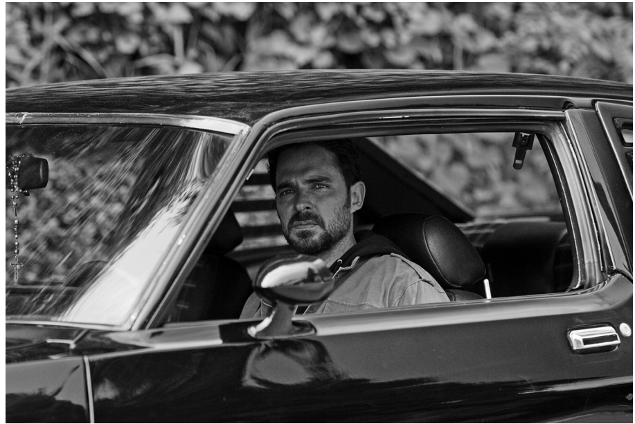
Ki ölte meg Sarát?

ritkán dolgoznak a telenovellákban. Kétségtelen ugyanakkor, hogy a gazdagság fokmérőiben volt változás az évtizedek alatt. Míg a hetvenes-nyolcvanas évek tipikus gazdagja még vagy a földből teremtette meg, vagy örökölte a vagyonát, a kilencvenes években már jogász vagy iparmágnás bőrébe bújt. Emellett változott a középosztály álommunkáról alkotott képe is. Míg korábban mosó- és tanítónők, kertészek, újságírók akartak egyszerűen csak gazdagok lenni, addig a kortárs telenovellákban a feltörekvők már sikeres reklámosok, grafikusok, divattervezők, festők, építésszek akarnak lenni.