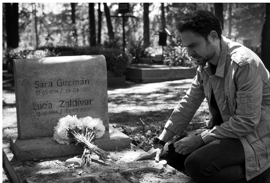
Ki ölte meg Sarát?

óta megalázza, az pedig még inkább felfoghatatlan, hogy gaztettei eltusolásában miért segítkezik. Az ezekre adott válasza mindig a „család hírnevének” megvédése lesz. Minden egyes esetben, amikor a gyerekek az apjuk ellen fordulnának, előkerül az anyagi függőség: így Rodolfo a kaszinóbirodalom megöröklését, Chema a luxusvilláját, Elisa pedig az európai egyetemi tanulmányait kockáztatja.