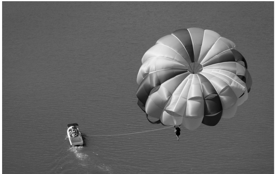
Ki ölte meg Sarát?