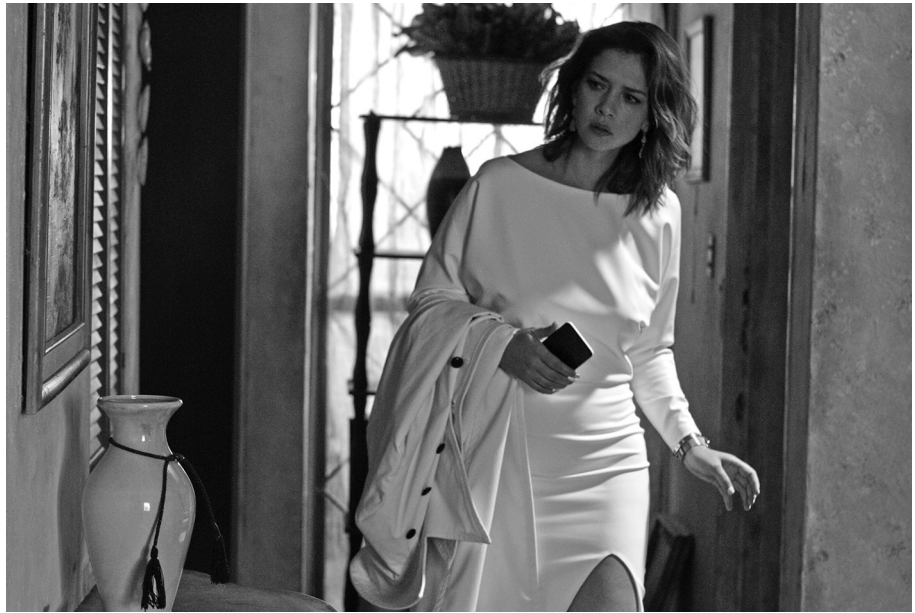
Ki ölte meg Sarát?

sokszor nem elválasztható telenovella-modellt különböztet meg: az alapmodellt, a szocialista-realista modellt és a posztrealista modellt. Az alapmodell eszerint a rádiónovellák romantikus melodramáinak egyenesen a televízióra adaptált változata. Az 1950-es évek közepétől az 1960-as évek végéig tartó időszak a telenovellák hőskora, vagy ahogy gyártási szempontból Nora Mazziotti nevezi: kézműves korszaka. 9 A telenovella ekkor még ezeknek a rádiónovelláknak a színpadra állítását jelentette: a történetmesélés egyszerű, lineáris, a cselekmény kizárólag a belső térben, általában a nappaliban játszódik, lokalizációja többnyire a vidék, a hacienda. A cselekményt két-három kameraállás veszi, a sok közeli az arcokra és a párbeszédre fókuszál. A fő konfliktust általában a két főszereplő tiltott szerelme okozza, a drámai feszültséget pedig a kiderülő titkok és szerencsétlenségek fokozzák. Az alapmodell mellőz minden társadalmi vagy történeti utalást, szereplői kizárólag saját magukkal, boldogulásukkal és érzéseikkel foglalkoznak, karakterfejlődés nincs.