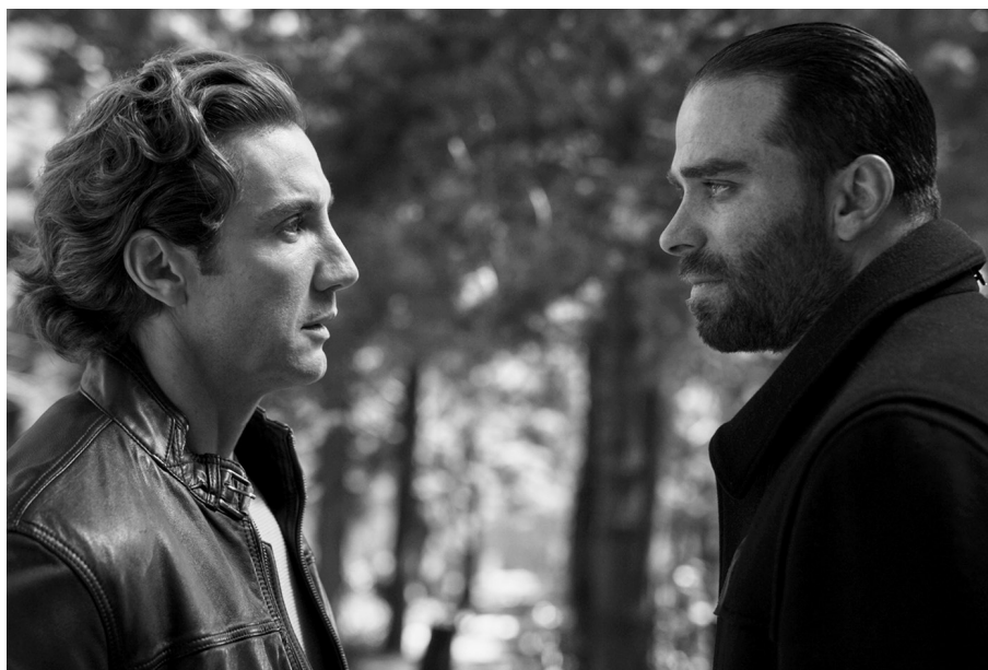
Ki ölte meg Sarát?

a mindenféle érdekességnek, városi pletykának, de még műkritikának is helyet adó betoldás az angol lapoknál alakult át a különféle történeteket, köztük románcokat sorozatokban közlő rovattá.