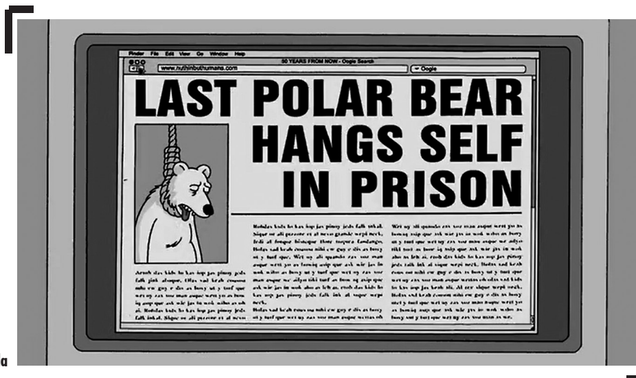
A jó, a szomorú és a ronda

Írásom fő kérdései, hogy az általam vizsgált anicomparatorkban, ahol a képi nyelv minden eleme teljességgel konstruált, milyen vizuális ábrázolásmódok, milyen szimbólumok és ikonográfia segítségével jelenítik meg a klímaváltozást. Valamint, hogyan érvényesülnek a műfaji keveredés és narratív komplexitás működési mechanizmusai a vizsgált empirikus mintában? Hogyan befolyásolja a klímaváltozás reprezentációját az anicomparódia hibrid műfaja, valamint a társadalmi és politikai kérdésekre reflektáló komplex narratív stratégia?