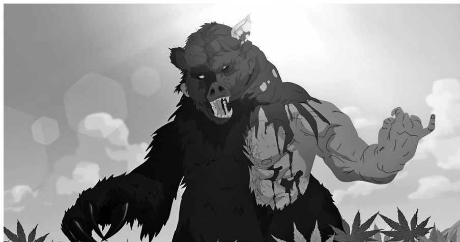
Démoni vadnyugat: Medvedisznóember

szürcsölnék az óvóhelyé avanszált közösségi házban. Az utcák kiüresednek, a szomszédos Beavertonban pedig senki nem siet az árvízkarosultak segítségére. Ez a rész már reflektál a klímaváltozás kapcsán gyakran felmerülő generációs feszültségekre: „ We didn't take care of the earth and now you inherited the problem ” – mondja Randy a fiának, Stannek, miközben autóval menekülnek a katasztrófa elől. Ez a rész a klímaváltozás okát előbb politikai hovatartozástól függően George Bush-hoz (demokraták), illetve az Al Kaidához (republikánusok) köti, de később egyértelműen a kollektív felelősséget hangsúlyozza, amikor a pánikoló tömegtől a tévériporterén át mindenki azt szajkózza, hogy „ We didn't listen ”. Még a fogyasztó egyéni felelőssége is előkerül, amikor az egyik lakos, Jimbo fejére olvassa a terepjáró-használatot: „ It's all your fault Jimbo. You drive around in a damn SUV. ” Ezeket a nagyon is valós dilemmákat azonban zárójelbe teszi, hogy az egész epizód arra épül, hogy valójában csak egy gyerekcsíny miatt öntötte el a víz Beavertont, és csak a felnőttek képzelik azt, hogy „lecsapott” a globális felmelegedés.