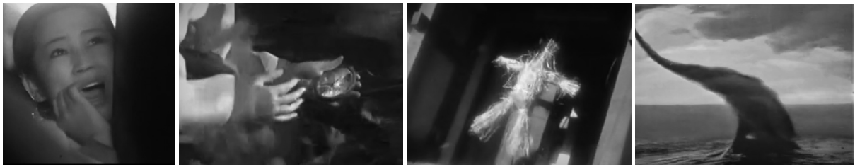
Sámánizmust idéző szimbólumok a rémálmok és hallucinációk ábrázolásában: sikoly, törött tükör, madárijesztő, tengeri tájfun – Szerelmem, szerelmem, óh, én szerelmem! (1984)

rendeltségét nyomatékosította, kiemelve Csunhjang kiszolgáltatottságát, eltárgyasított szerepét és erotikus nőiségét. Shin a korábbi északi feldolgozásokhoz képest sokkal közvetlenebb módon utal a szexualitásra és a szenvedélyes vágyakozásra a férfi szereplők (Mongrjong és Háktó) epekedő tekinteteinek, illetve Csunhjang érzéki bájának bemutatásával.