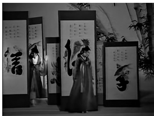
Mozi és színház ötvözetei:

Chunhyang története (2000); Szerelmem, szerelmem, óh, én szerelmem! (1984)