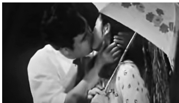
Az első nyíltan ábrázolt csók az észak-koreai filmvásznon: Ezer mérföld a vasút mentén (1984)

Az észak-koreai filmművészet a mai napig különböző szimbólumokon, utalásokon vagy természeti képeken keresztül érzékelteti a szerelmespár (átpolitizált) románcát. Az egyén szexuális fantáziáinak felvázolása helyett a kollektív eszmék dicsőítése által közvetített, nemzetszintű érzéki vágyakozás képezi a szexualitást. Mindezt az alkotók leggyakrabban a természet képeivel, vagy éppen a mezőgazdasági munkák szemléltetésével teszik még érzékletesebbé. A szerelmi vallomások elsősorban a kemény, szívós munkához való viszonyulásban, a Párt iránti elköteleződésben, a Dzsúcse-bölcsességekben, és legfőképpen a legfőbb vezető iránti feltétlen odaadásban, illetve a nem nélküli szeretetben testesülnek meg. A Kim Ir-szen iránti különleges szeretetet Sonia Ryang