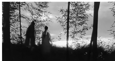
Szerelmebrázolás tradicionális koreai szimbólumokkal – Legenda Szilvavirágáról I-II.: Csunhjang legendája (1980)