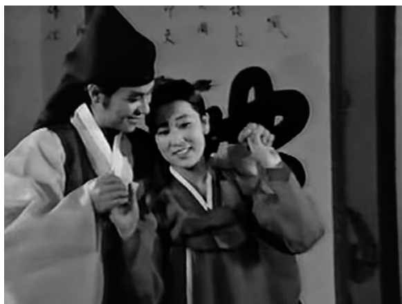
Balra: az első éjszakát indító jelenet, jobbra: szerelemtánc az együttlét után – Szerelmem, szerelmem, óh, én szerelmem! (1984) 29

A professzionális filmes illúziók, a szemet gyönyörködtető színes jelmezek, az újító, nyugati stílusú hangsáv és zenei betétek, a tömeges táncjelenetek, a gyors vágással feldolgozott kaland- és akciójelenetek, a merész szexualitás – melynek csúcspontja a vetkőztetőjelenet – rendkívüli hatást értek el az észak-koreai nézők körében, akik nem voltak hozzászokva az efféle hatáskeltéshez. Doktori disszertációm 28 kidolgozása kapcsán észak-koreai disszidensekkel készített interjúmban a legtöbben a szerelemtánc dallamát és az emlékezetes vetkőztető epizódot idézték fel a hatalmas sikert aratott filmhez kapcsolódó visszaemlékezéseikben – vagyis leginkább a felszabadult szexualitásra vonatkozó elemek hagytak kitörölhetetlen emlékeket az egykori nézőközönségben.