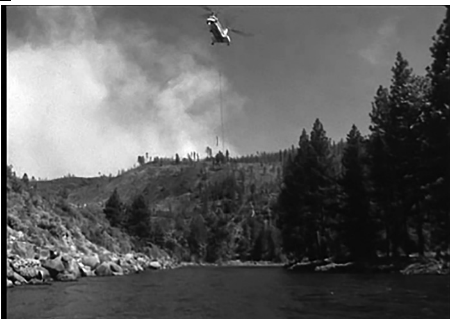
Helikopter a víz fölött (Sogobi, 2002)

ban abban nyújtanak újat, hogy formájukban gyökerezik az ökológiai törekvés, amit a tartalmuk erősít meg.