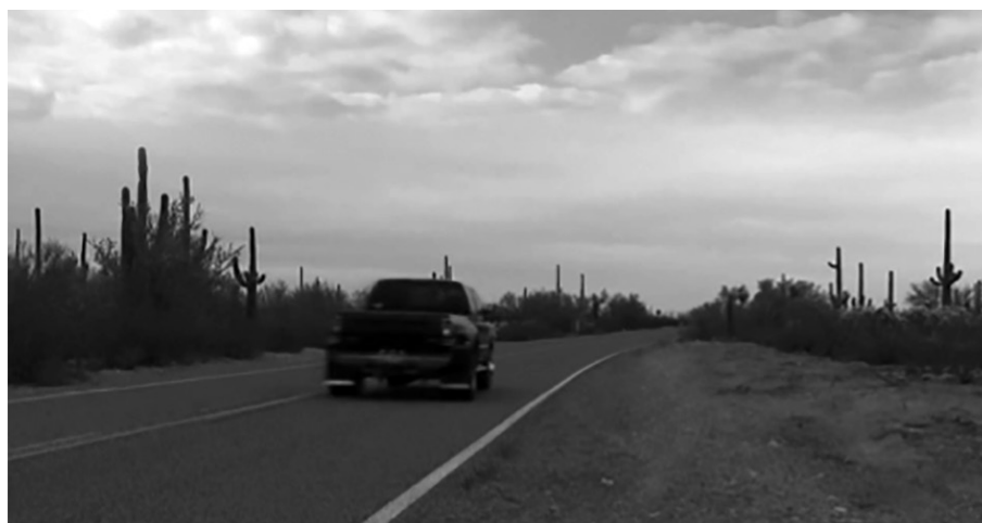
Elsuhanó autó ( small roads , 2011)

jük el akár az első jelenetet, akár a másodikat egy útszéli fa szemszögéből: egy csendes erdei tájat látunk évek óta változatlan szemszögből; ugyanazok a fák, ugyanaz az útszakasz. A szél megmozgatja a leveleket, a nap kisüt a felhők mögül, és egyszer csak két autó száguld el, hangos motorzajjal. Majd újra csend, és minden a régi. Ezt látjuk a small roads -ban. Ezt látjuk a többi filmben is, amelyről e tanulmányban szó van, csak nem feltétlenül egy autós jelenet helyszínén, hanem egy tóparton vagy egy sivatagban. Olyan nézőpontokból látjuk a helyszíneket, amiből jól érzékelhető a nem emberi környezet kiterjedt időbelisége. Így tud érvényesülni egy nonhumán vagy posztumán nézőpont, amiben nem az emberi lét a fontos. Megszűnik a szubjektum monopóliuma. Ebből a perspektívából nincs hierarchia ember és nem ember, szubjektum és objektum között, az ontológia „lapossá” válik. Ebből a kiegyensúlyozott lételméleti állapotból lehet továbblépni afelé, hogy elismerjük környezetünk önállóságát és a szubjektumtól független létezését. Vagy legalább megérthetjük, hogy egy ilyen állapot elérése a cél, amivel máris nyitottabbak lettünk környezetünk irányába.