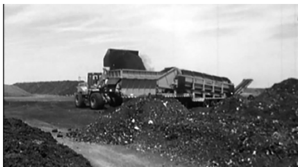
Szemétszelektáló telep ( El Valley Centro , 1999)