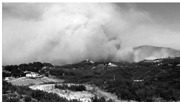
Bozóttűz ( Los , 2001)