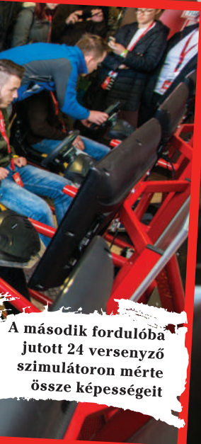
A második fordulónak jutott 24 versenyző szimulátoron mérte össze képességeit