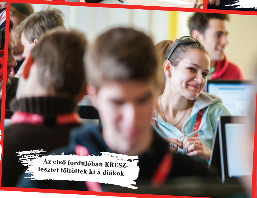
Az első fordulónak KRESZ-tesztet tölthettek ki a diákok