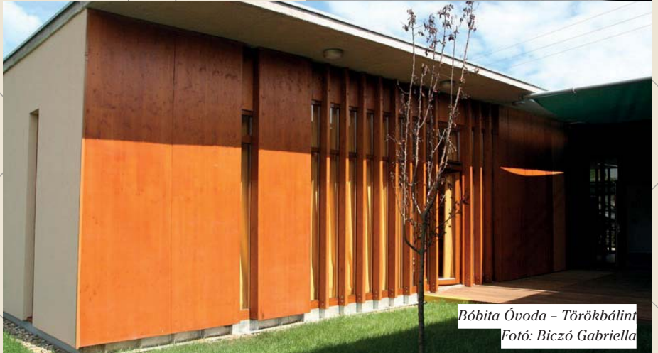
Bóbita Óvoda - Törökbalint

Isteni Irgalmasság Temploma - Győr-Kisgyőr