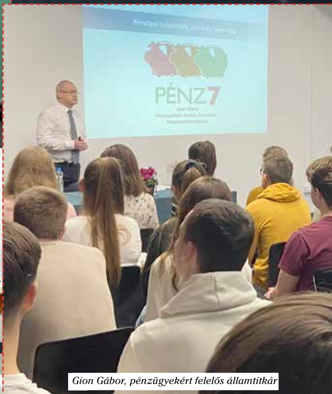
Gion Gábor, pénzügyekért felelős államtitkár