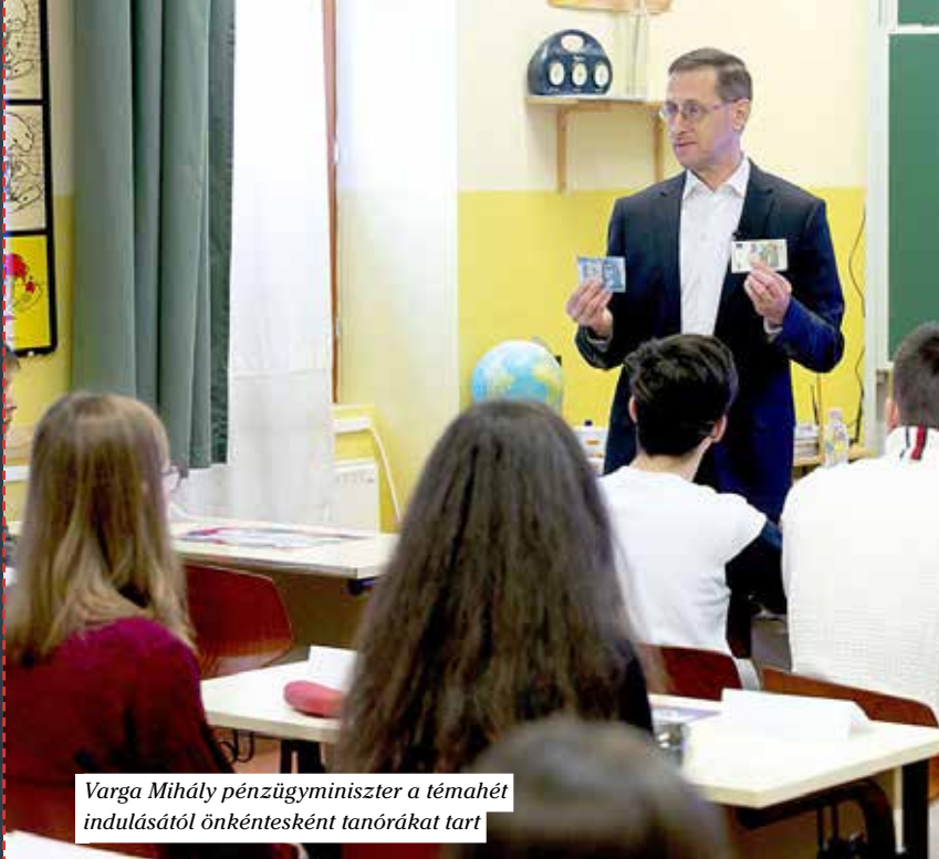
Varga Mihály pénzügyminiszter a témahét indulásától önkéntesként tanórákat tart