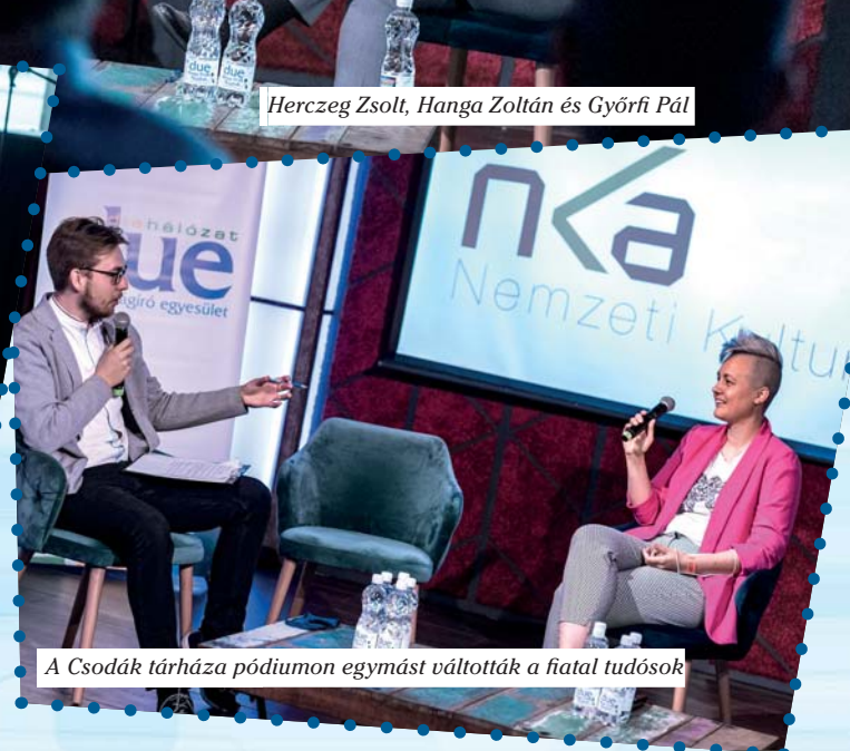
A Csodák tárháza pódiumon egymást váltották a fiatal tudósok

Fiatalok és a zene elnevezésű beszélgetés keretei között meséltek arról, hogyan folytatódik a zenei karrier egy televíziós műsor után, kik azok, akik segítenek a szárnyak bontogatásában, de arról is, hogyan dolgozzák fel, hogy ennyire fiatalon egy egész ország megismerte a nevüket.