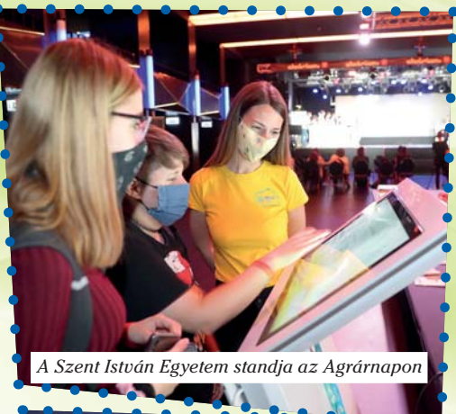
A Szent István Egyetem standja az Agrárnapon