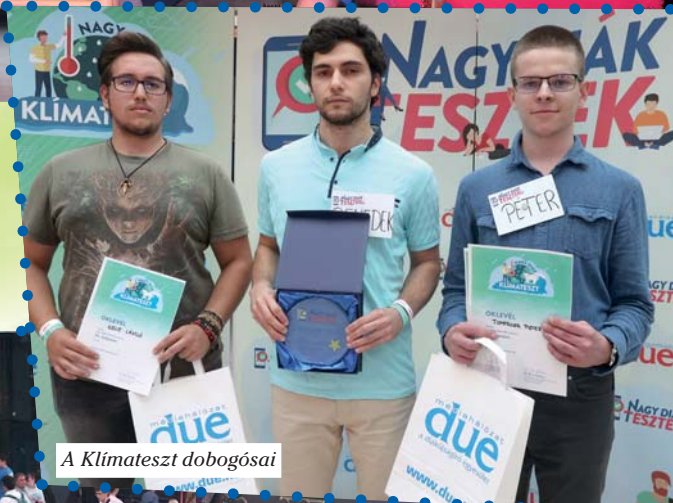
A Klímateszt dobogósai

nyitott fiatalok valós és hiteles információkra alapozva alakítsák ki véleményüket és tegyenek a környezetükért, és felelősen bánjanak a Föld javaival.