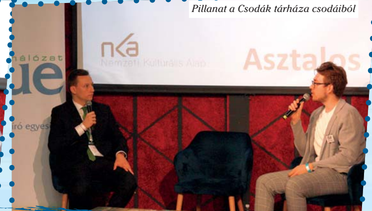
Pillanat a Csodák tárháza csodáiból