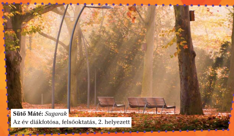
Sütő Máté: Sugarak Az év diákfotója, felsőoktatás, 2. helyezett

IMPRESSZUM • DUE Tallózó - Válogatás az ország diáklapjaiból