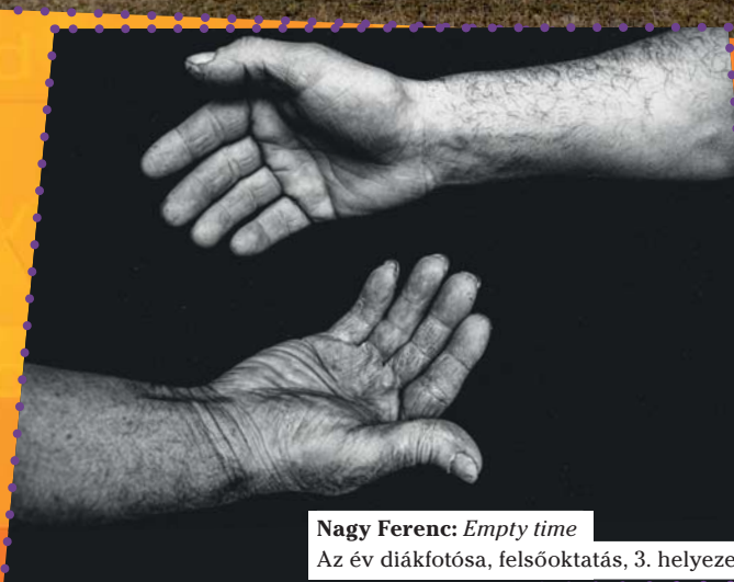
Nagy Ferenc: Empty time Az év diákfotója, felsőoktatás, 3. helyezett