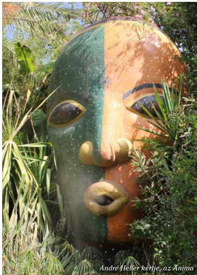
André Heller kertje, az Anima

költözött be, és meglehetősen elszegényedett a környék. Utazásunk során itt talákoztunk először a földrengés nyomaival is, leomlott házak képében.