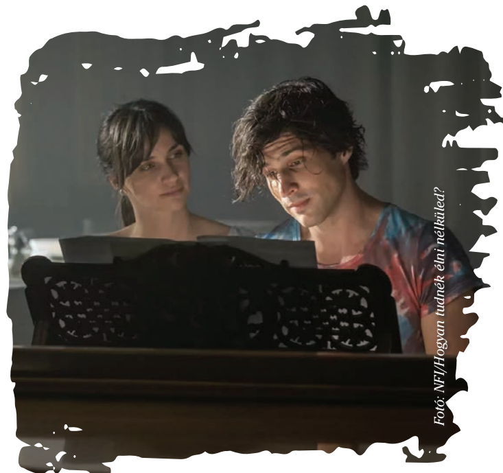
Hogyan tudnék élni nélküled?

Nem egyedülálló a magyar filmek sorában a film, hiszen olyan musicaleket, zenés romantikus vígjátékokat is láthatott már a közönség, mint például a Made in Hungaria vagy a Pappa Pia. Mitől egyedi és különleges a Hogyan tudnék élni nélküled?