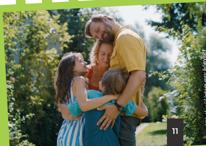
Fotó: Véletlenül írtam egy könyvet