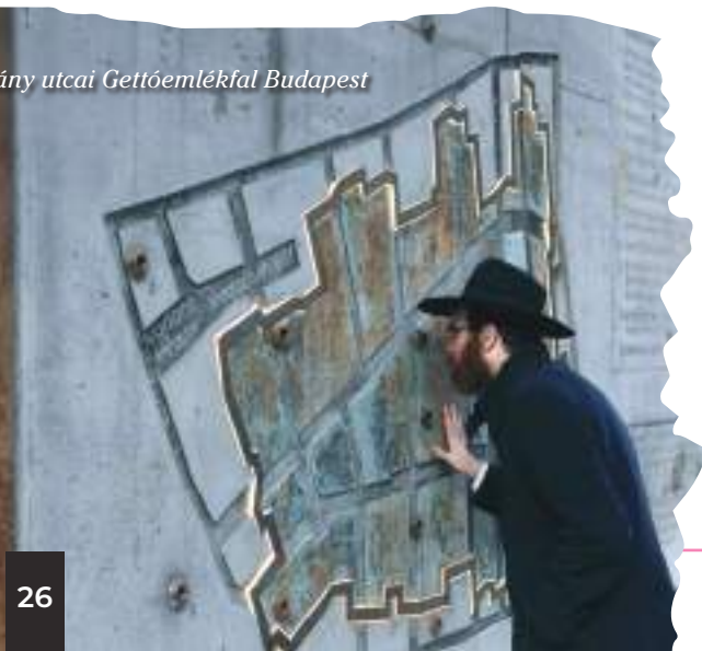
Dohány utcai Gettóemlékfal Budapest