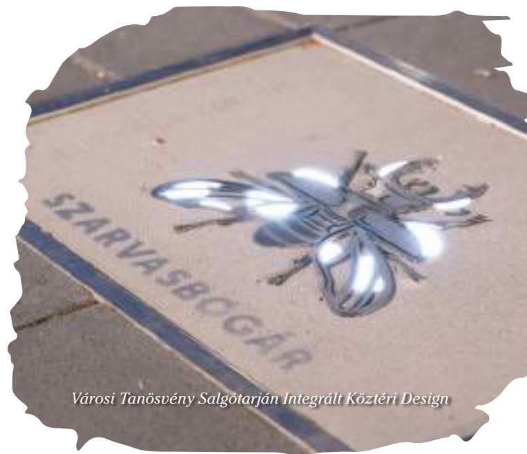
Városi Tanösvény Salgótarján Integrált Köztéri Design

Azt, hogy legyetek résen! Az oktatás nem fogja tudni lekövetni a 21. század változási ütemét. Olyan ka-