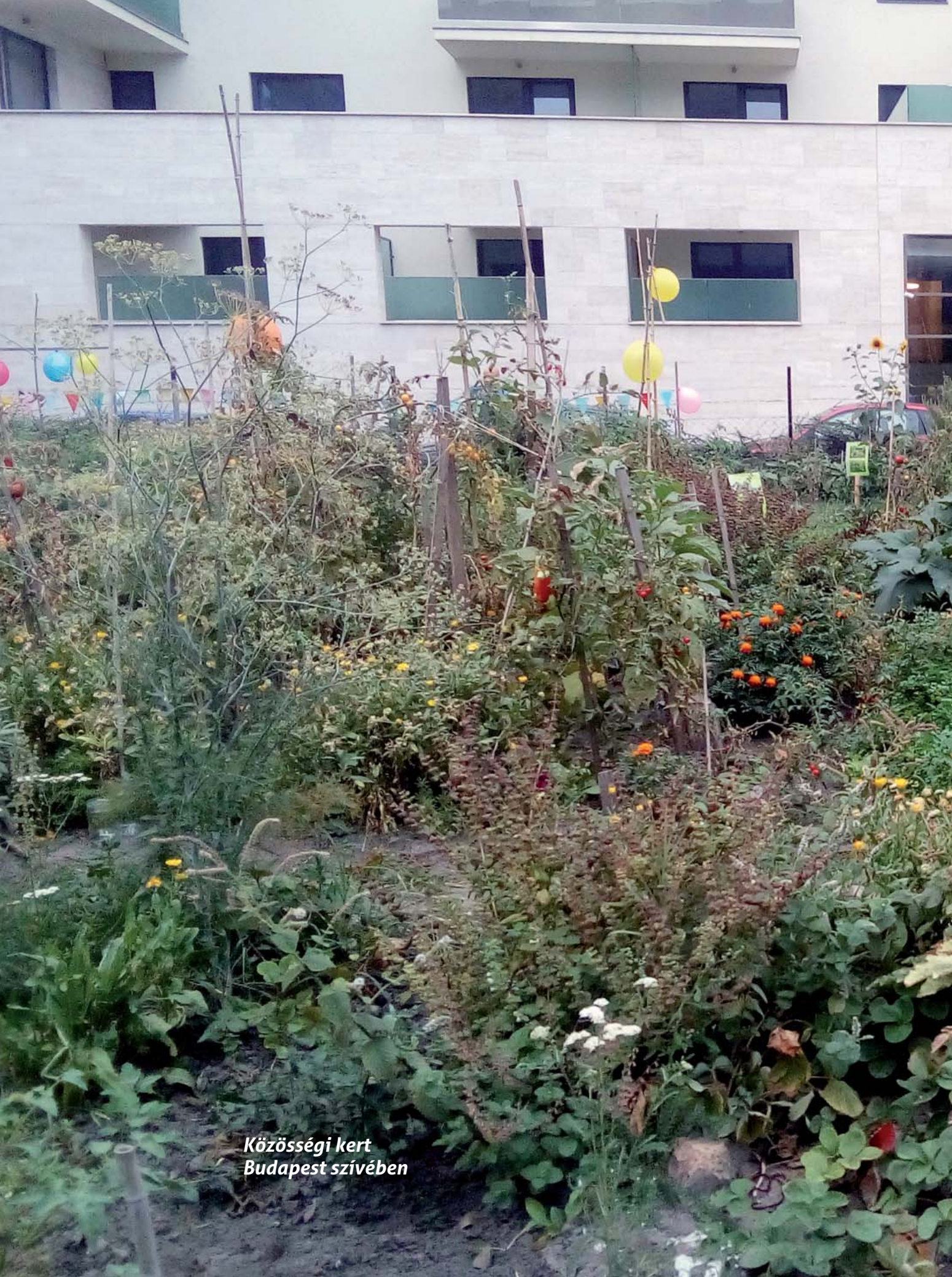
Közösségi kert Budapest szívében