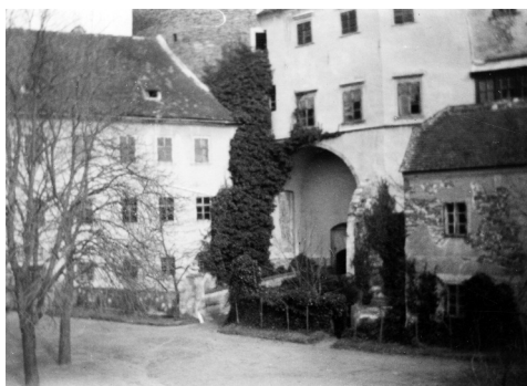
13–14. kép. A városszalónaki (Stadt Schlaining) vár (1938) és belső udvara