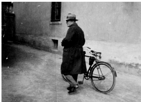
17. kép. 1931 őszén a leánygimnázium udvarán (a mai Kanizsai D. gimnázium)