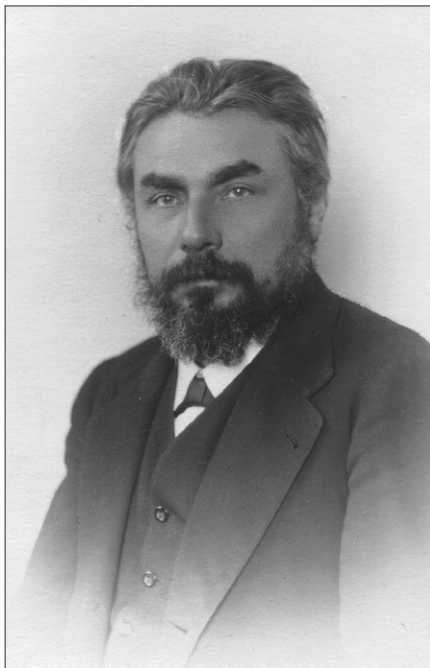
Feleség és férj portréja a két háború között