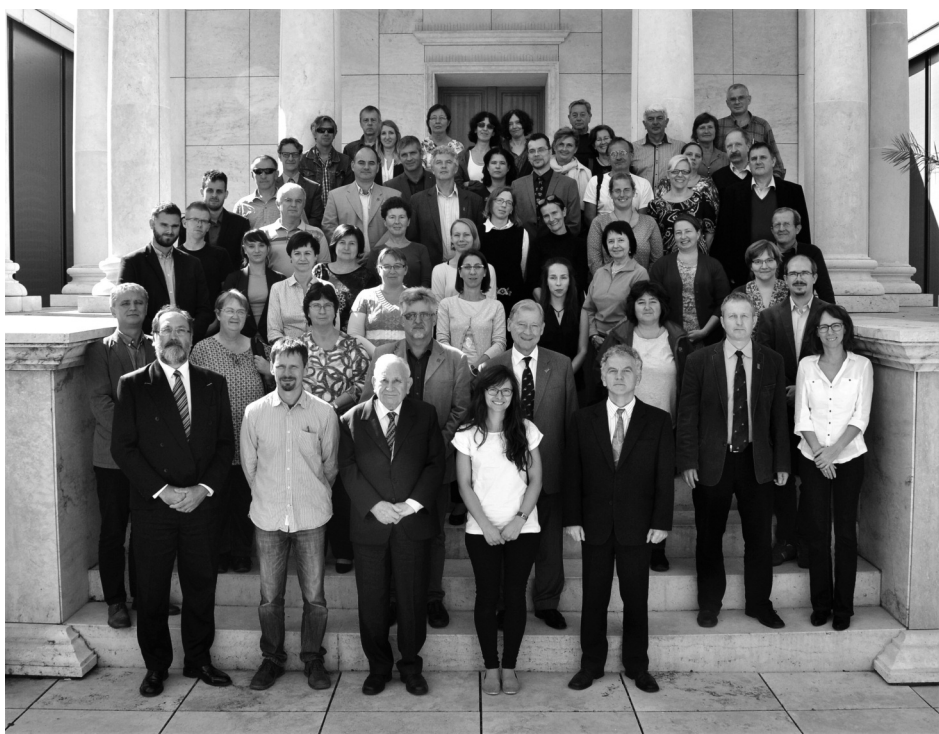
A találkozó résztvevői az Iseumban

A természettudományos muzeológusok rendszeres szakmai találkozói immár több mint harmadszázados múltra tekintenek vissza. Témaválasztásuk mindenkori kritériumai az időszűréség, közérdekűség és fejlesztés-orientáltság (továbbképzés, módszertan, struktúra, jogi szabályozás). Az évente más-más múzeum által rendezett összejövetelek résztvevői a természettudományos muzeológia különböző szakterületeit képviselő szakmuzeológusok (zoológusok, botanikusok, paleontológusok, geológusok, antropológusok), preparátorok, gyűjteménykezelők, múzeumpedagógusok, közművelődési szakemberek és kulturális menedzserek. A találkozók rendre egy szakmai tanácskozási nappól, egy terepi nappól, és egy, a házigazda intézmény gyűjteményeinek, kiállításainak megtekintését szolgáló nappól állnak (vö. Kecskeméti T. 2002 Természet Világa 133. évf. II. különszám, 102–103. o.). Mivel e találkozók sora és tematikája tudomásunk szerint eddig még nem közöltetett, hasznosnak látjuk,