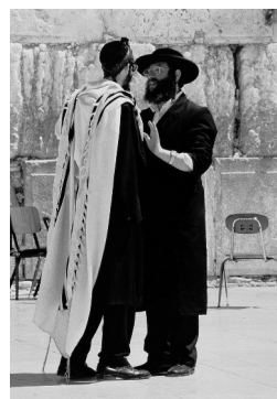
Kardos Tamás izraeli fotói