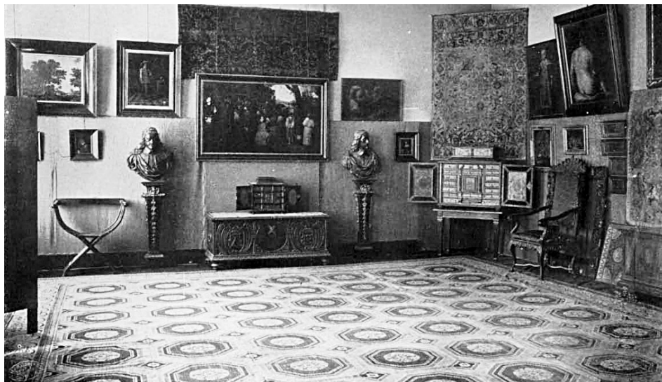
A nagyterem keleti oldalának képe az 1912-es szombathelyi tárlatból

Az 1912-es szombathelyi kiállítás német nyelvű katalógusa nem tartalmaz fényképfelvételeket, de a Magyar Iparművészet című folyóiratban megjelent egy lelkes cikk, szerzője maga Csányi volt, 12 aki 17 fényképpel mutatta be a szombathelyi anyagot. E