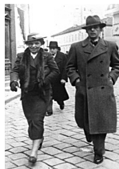
Anyám és apám az 1940-es évek kezdetén, Pozsonyban