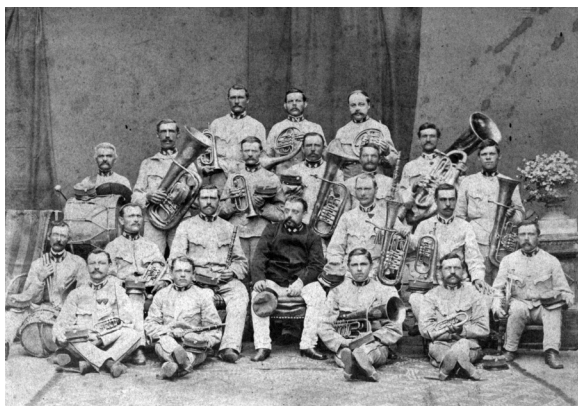
Az önkéntes tűzoltózenekar (1874) 5

Szűk tíz esztendő elmúltával újból napirendre került a zenekar ügye. Alapszabályukat a belügyminisztérium jóváhagyta (1901). Rögzítették elhatározásukat is, hogy a tűzoltózenekar „a régi alapon újra meg fog alakulni”. Nem az első és nem is az utolsó alkalommal fordultak a polgárok támogatásáért. Az intézmények, köztük az éveken át rendszeresen ada-