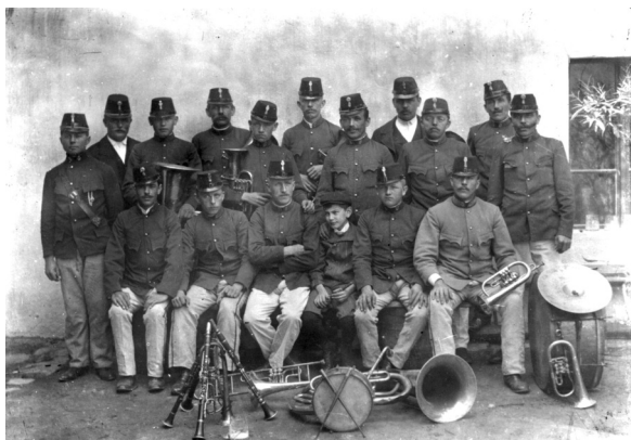
A kőszegi önkéntes tűzoltózenekar a XIX. század végén 9

Kevesebb mint egy év múlva meg is jöttek a zeneszerszámok. A közönség sem maradt érdektelen. Húszfilléres, de egykoronás adomány is érkezett szép számmal. Az önzetlen segítők névsorát folytatásban közölte a Kőszeg és Vidéke . 8 Az egyesület pénztára időről időre