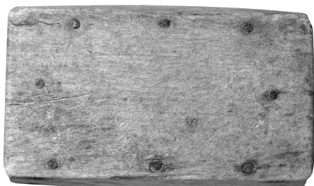
4. kép 2.