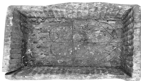
5. kép 1.