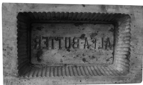
5. kép 3.