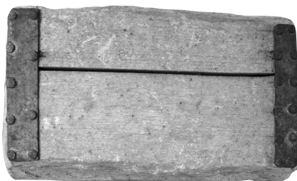
3. kép 2.