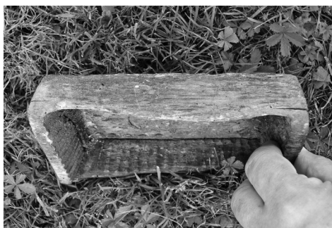
5. kép 2.