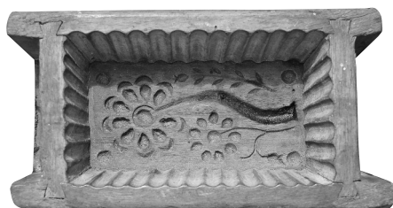
2. kép 3.