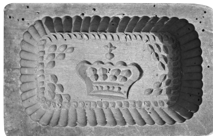
1. kép 2.