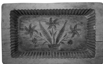
5. kép 4.