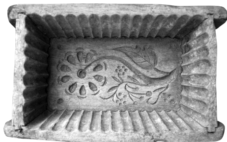
4. kép 1.