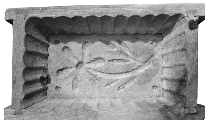
2. kép 1.