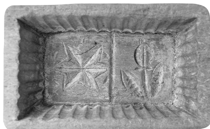
3. kép 3.