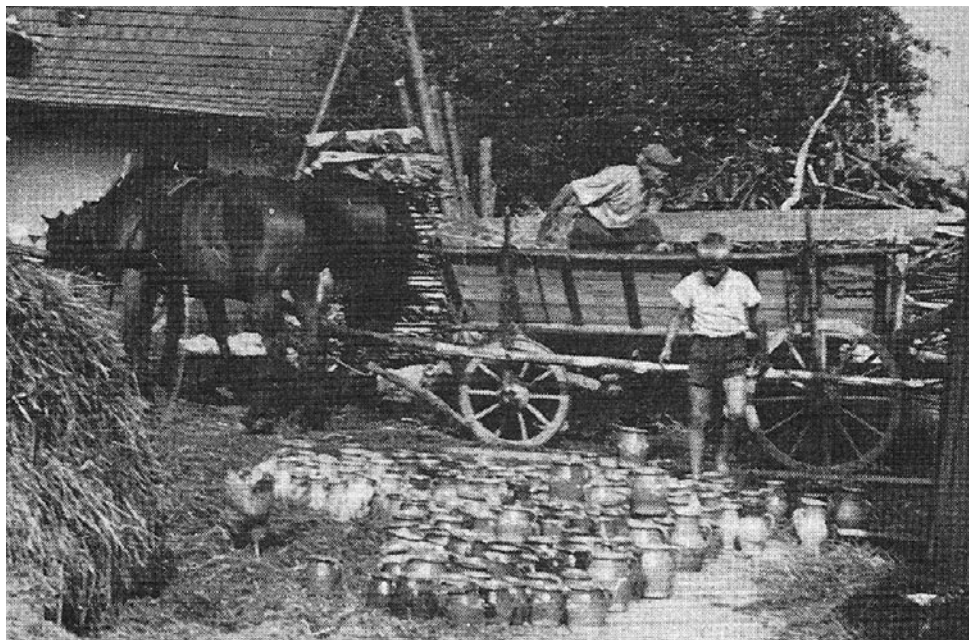
3. kép: Velemér völgyi gerencsér felrakodik a szekérre. Gödörháza, 1970.