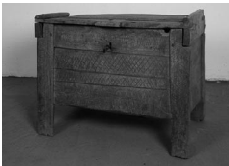
7. kép: Ácsolt láda. NM 71.68.69. Gödörháza. Gráfik Imre gyűjtése, 1970.