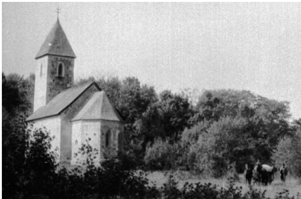
5. kép: Veleméri templom. NM F 236418. A gerencsér szekere a „Magyar fazekasok” című film forgatása alkalmával. Velemér, 1970.