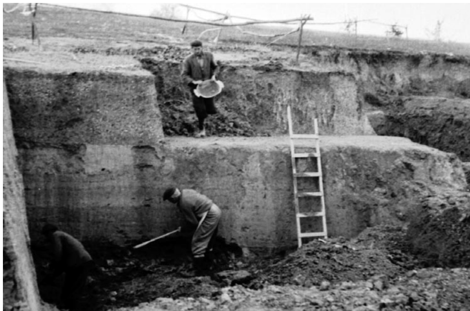
1. kép: Fazekasmunka, agyagbányászat. Néprajzi Múzeum (továbbiakban: NM) F 236420. A fénykép a „Magyar fazekasok” című film forgatásakor készült. A külszíni fejtés 1945 óta folyik. A felvétel idején még használták a bányát. Velemér, 1970.

Ebből kiderül, hogy a film egyes, jelentős részei az Őrségben, pontosabban veleméri völgy falvaiban kerültek forgatásra.