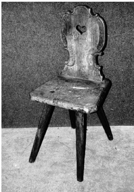
10. kép: Szék (Támlás szék). NM 71.68.68 Gödörháza. Kresz Mária gyűjtése, 1970.

A kiállító hely tárgyában ugyan számításba jöhetett valamely területileg is illetékes múzeum vagy kiállító intézmény, de indokoltabbnak tűnt – a fővárosi filmbemutatót is figyelembe véve – valamely, nagy kiállító térrel rendelkező budapesti helyszín. Erre is sikerült megoldást találni. Az 1970-es években több rangos eseménynek és kiállításnak helyet adó, mára már lebontott, XI. kerületi Fehérvári úti körépületben valósulhatott meg az elképzelés. A jó látogatottságú, látványos kiállításról érdemes idézni azt a rövid beszámolót, amely a vezető néprajzi szakmai folyóirat, az Ethnographia hasábjain jelent meg.