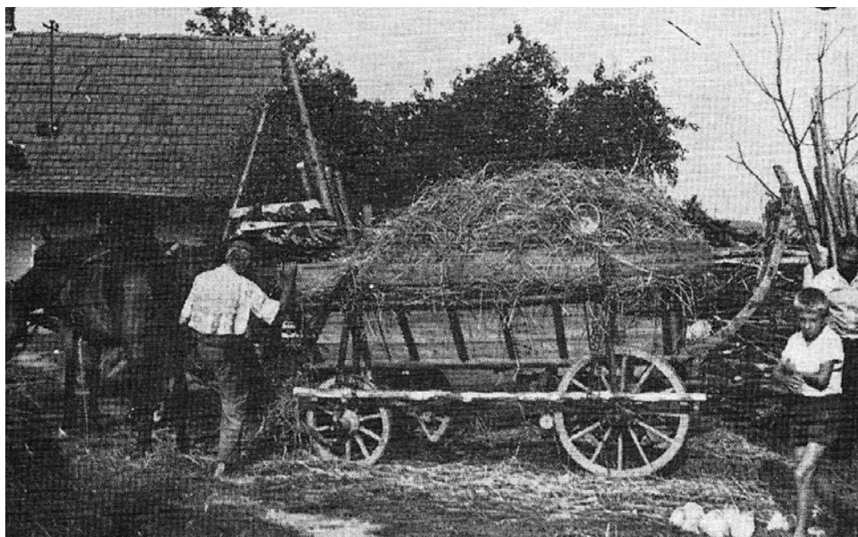
4. kép: Útra készen a somogyi szekér. Gödörháza, 1970.