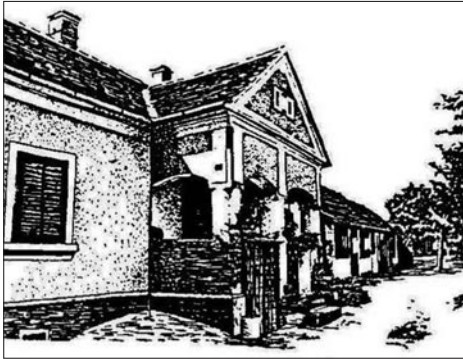
11. kép: Vendéglátóim előtornácos, úgynevezett „kódisállásos” háza Magyarszombatfán. 15 (A grafikát Gráfik Imre fényképfelvétele alapján Garzó Ágnes készítette)