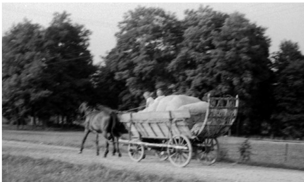
6. kép: Fazekasmunka – edénykereskedelem. NM F 208743. A megrakott szekér néhány napig a fuvarosnál áll, amíg a fazekassal együtt elindulnak Somogyba. Gödörháza, 1967.