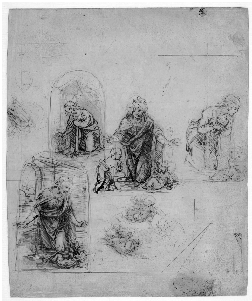
Tanulmányok a gyermeket imádó Máriához, Metropolitan Múzeum, New York 5