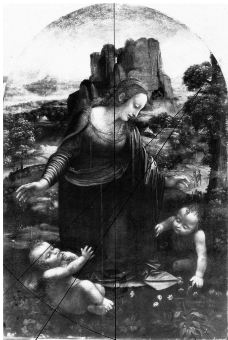
A Szépművészeti Múzeum festménye a geometrikus ábra rávetítésével 19