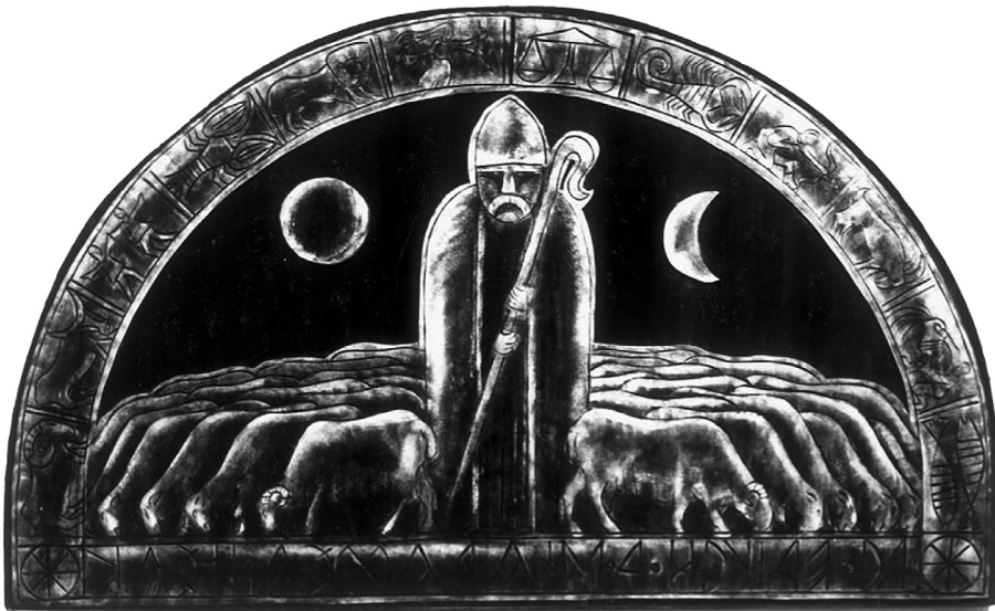
5. kép. Jó pásztor világfelügyelő, vegyes technika, 1980. k.