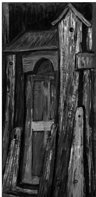
2. kép. Böszörményi kapu, olaj, farost, 1973.

Forrás: http://www.festomuvesz.hu/lakatosjosef/ www.festomuvesz.hu/lakatosjosef/