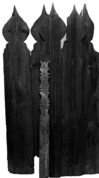
3. kép. Mementó, vegyes technika