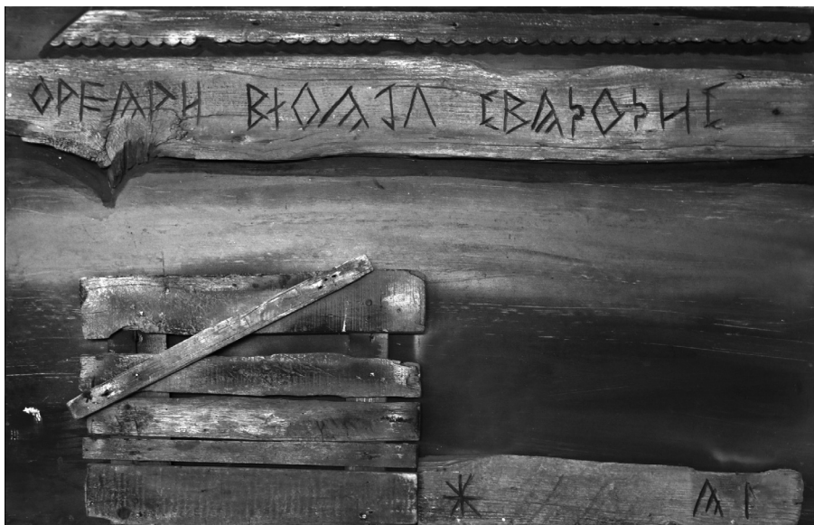
6. kép. Káplár Miklós emlékére, vegyes technika, 1983.