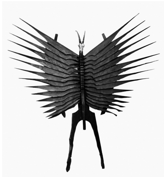
10. kép. Kék démon, vegyes technika, 1993.