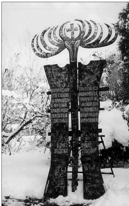
12. kép. Dozmati regösének, festett fa, 1990.