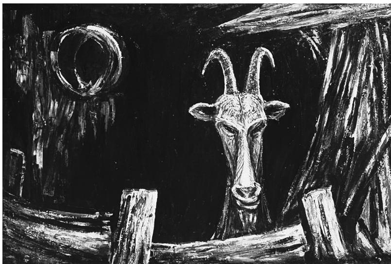
1. kép. Lidérc, olaj, farost, 1965.

Forrás: http://www.festomuvesz.hu/lakatosjosef/ www.festomuvesz.hu/lakatosjosef/