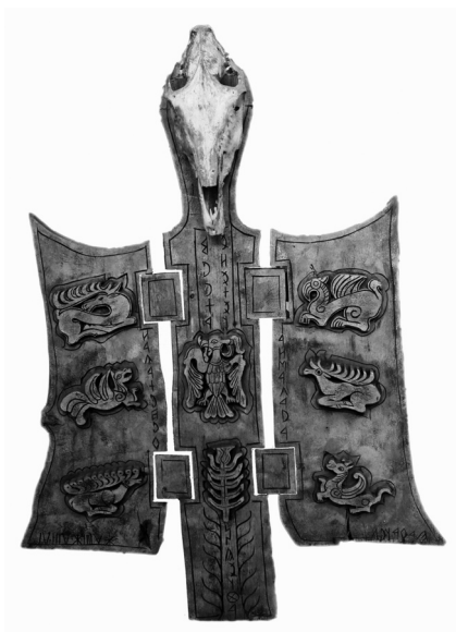
9. kép. Eredetmonda, vegyes technika, 1986.