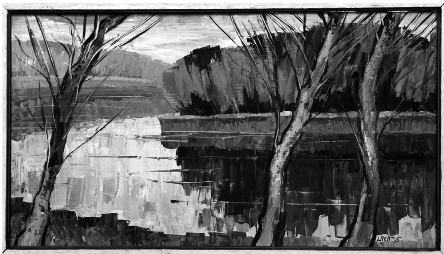
7. kép. Tükröződés, olaj, farost, 1986. Fotó: Benkő Sándor