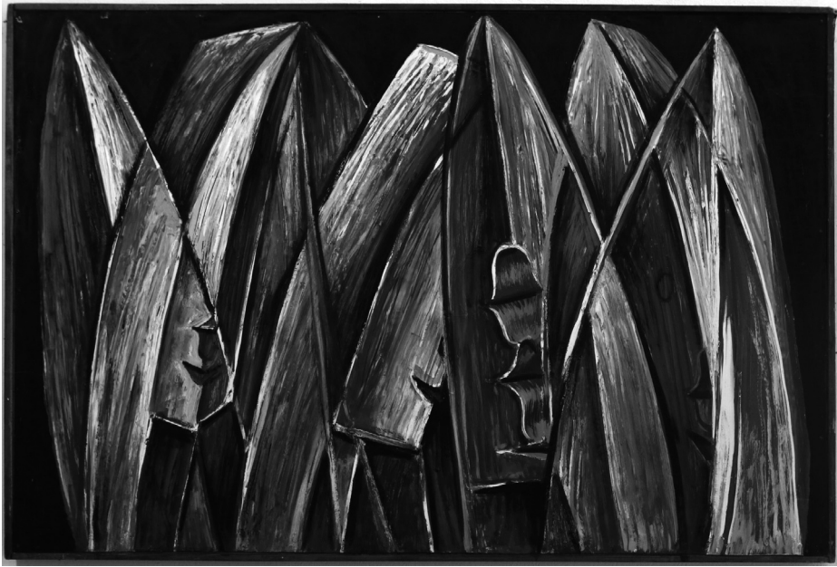
4. kép. Csekei fejfák II. olaj, farost, 1975.