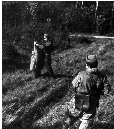
Szimulációs gyakorlat határsértő elfogására.