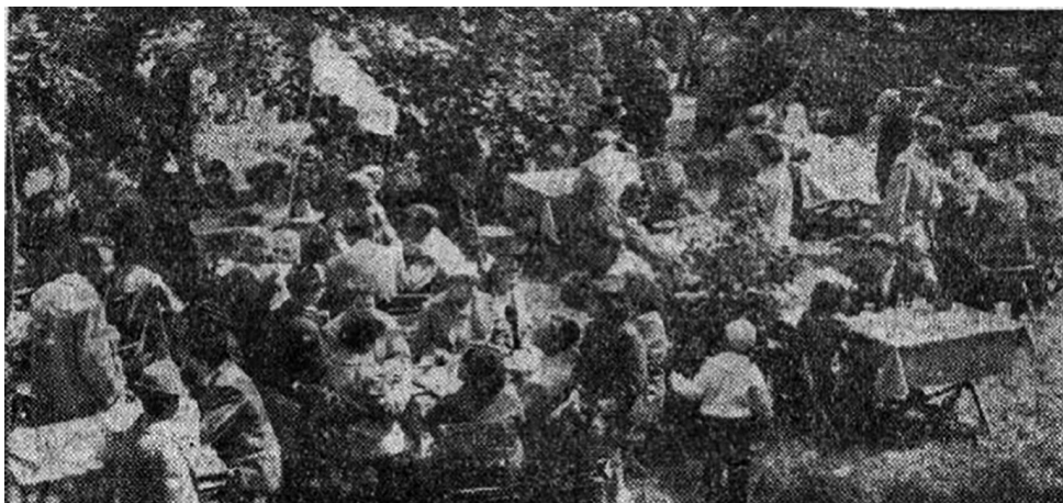
3. kép. A Május 1. Söröző vendégei a nyitás napján, 1961. május 1-jén

liget (ma Brenner park) és a Jókai park közül – így, a későbbi események ismeretében visszatekintve – inkább utóbbi számított központnak, bár tribün mindkét helyen volt, és beszédet is mindkét helyen hasonlóan magas beosztású elvtársak tartottak, mint ahogy lacikonyhák, kifőzdék, sörözők és gyerekjátékok is álltak. Ami miatt mégis különbséget tesztek, az azért van, mert az újabb és újabb közterek és helyszínek megnyílásával a város rendezvényközpontja egyre a Jókai park körzetébe tolódott. Az Emlékmű mellett már korábban, 1965-ben megnyitották a Csónakázó-tavat, amely azóta is színes rendezvények megtartására nyújt lehetőséget. 38 Az eseményeket átélő interjúalanyaim többsége nem is volt tiszt-