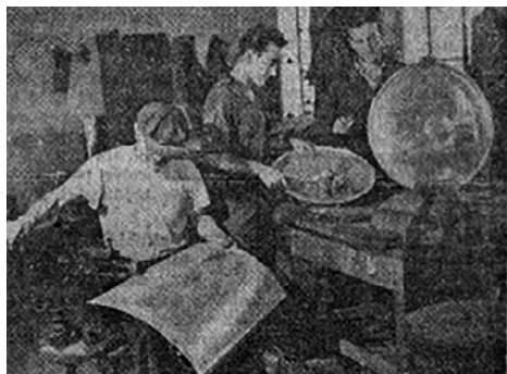
2. kép. Készülnek a rómaiak pajzsai a karneválra 1961-ben.