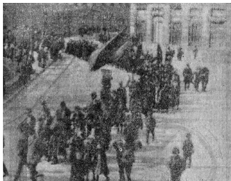
1. kép. Május 1-jei felvonulás 1919-ben

Forrás: Pósfai H. János: „Jöjj, ó szép dicső nap!”