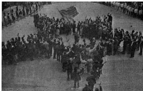
4. kép. A tanácsköztársaságot ünneplő munkások vörös csillagot formáznak