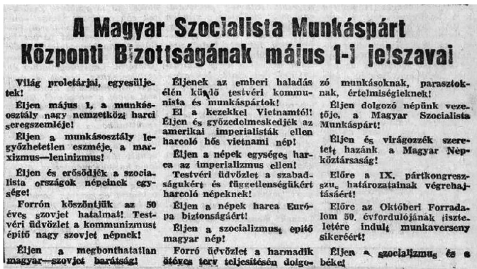
7. kép. Az MSZMP 1967. május elseji jelszavai