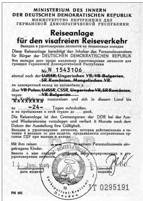
1. kép. Magyarországra érvényes utazási betétlap.