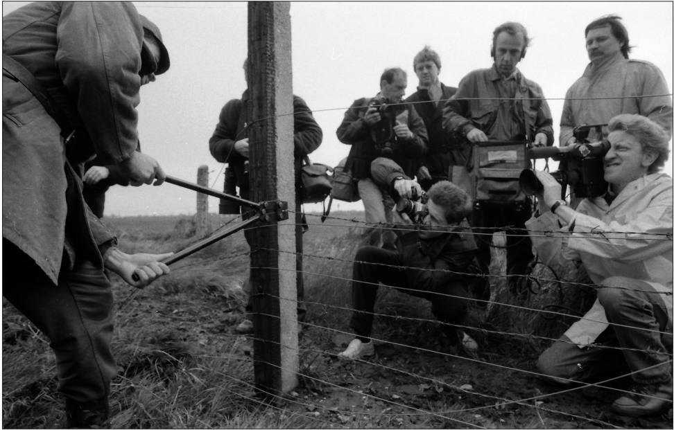
2. kép. A vasfüggöny lebontása a magyar–osztrák határon.