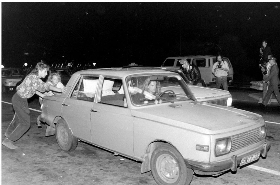
7. kép. NDK-s Wartburg a magyar határátkelőnél.