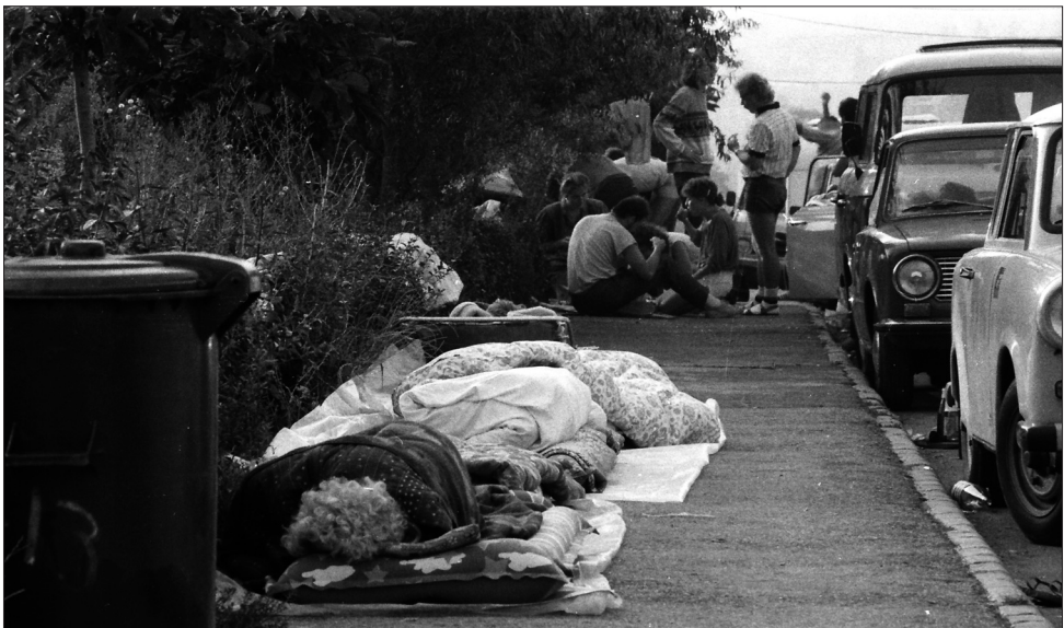
3. kép. Az NSZK Nagykövetség Konzuli Osztálya előtt NDK-s turisták várakoznak.