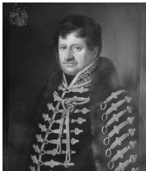
3. kép: Szentgyörgyi Horváth (III.) János (Anton Einsle, 1834) Fotó: Magassy Lajos, 202414 (Széchenyi István Emlékmúzeum, ltsz.: K. 98.2.4.)

résztevőit bemutató, több mint száz rézkarcot tartalmazó album Magyar Pantheon címen, és ebben Békés vármegye követének portréja is szerepel. 6 A diétai arcképcsarnokot laponként is árusították, a kiadványról Kazinczy Ferenc (1759–1831) írt recenziót a Felső-Magyarországi Minervában , 1827-ben. 7