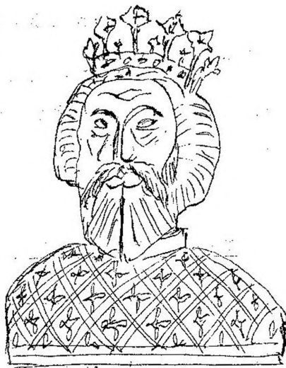
Szent László győri hermája.

pogányok ellen folyó hadakozásokban. Mikor édesapja, I. Béla király után királlyá koronázták, akkor már sok hőstettéről tudott a magyar nép, fejével magasabb volt legmagasabb vitézeinél is, hősiessége messze földön ismert volt.