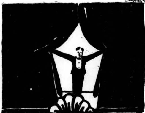
A · JÓVÓ · SZÍNESZ · GENERÁCIÓ.

...jelen sorok írójának pénz-árcája 2000 korona tartalommal. A tárcában egy nadragomb is volt. A b. megtaláló a pénzt megtarthatja, de a gombot helyezze a Hitelbanknak erre a célra fentartott safe-depositjába „Valuta” jelige alatt.