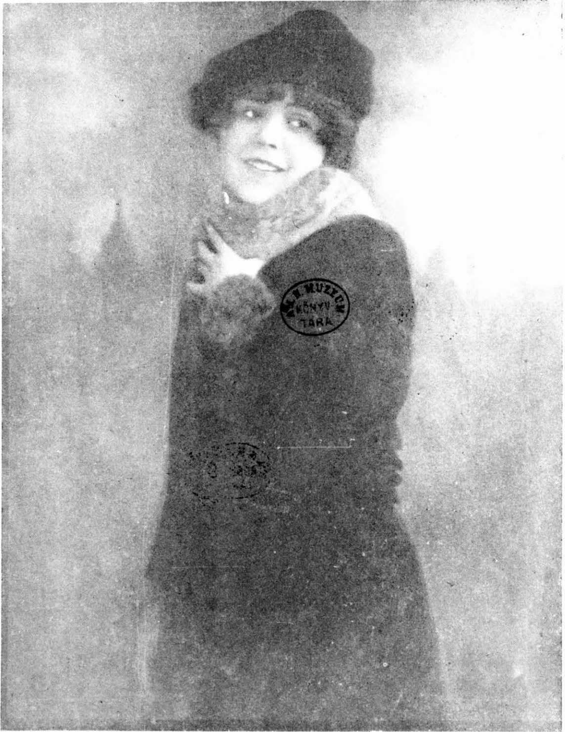
ANDAUER PIRI. énekművésznő