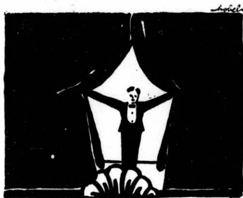
A · JÓVÓ · SZÍNESSZ · GENERÁCIÓ.