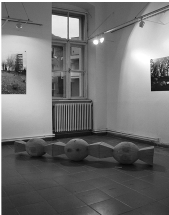
Gólyaváró, 2010 (fa, 35x240x35 cm)

ezüstpengő, tört korral számvetés. Kezet fog, lassan elindul hazafelé, az éjszakát átadta, megőrizte. És ahogy ballag az Árpád utcán a kabátra vidám hajnalfolt ragad. Még néhány méter meg néhány perc lesz, egy reumás, frusztrált panelajtón simán túljut, a rozsdát megbeszéli. Most bent van. A lépcső tiszteleg, és otthon az egész család várja.