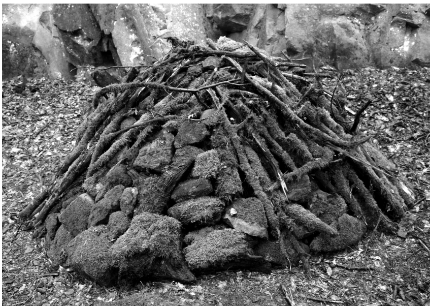
Cím nélkül, 2015 (fa, kő, moha, 100x130x114 cm)

Nem sír s csak néha tépi ruháit Ha cigije elfogy bárkit szájába vesz Soha és senki nem érhet hozzá Úgy szereti ha magától adhat.