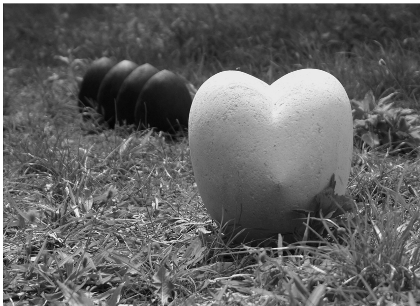
Igazságmag, 2015 (kő, 19x26x15 cm)

Aztán a bűnösök egészséges, mély álmával elaludt.