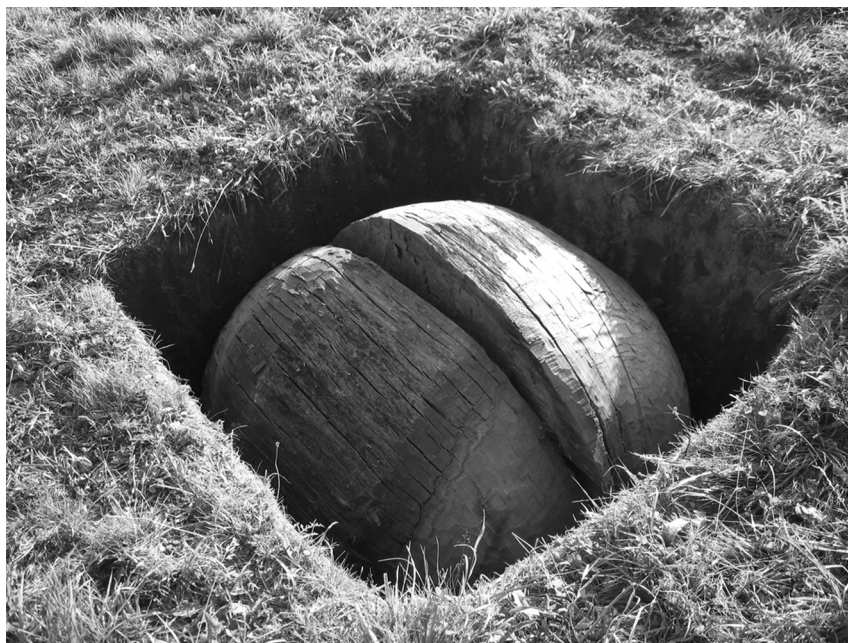
Földszem, 2009 (fa, föld, 100x100x100 cm)

Néha hallgatom őket, csak úgy kopognak a szavaik, mint a betonra hulló dió, egy másfajta, letagadhatatlan érés fejlődés gyümölcsei, hogy végül is itt vannak, nem kell bánniuk a rád pazarolt időt, hisz mindenük megvan, tulajdonképpen semmit sem vesz tettek el. Már csak néha kutakodnak az ellopott pénztárcákból kiszedett személyi igazolványok között, hátha megtalálják azokat, akik lehetek volna nélküled.