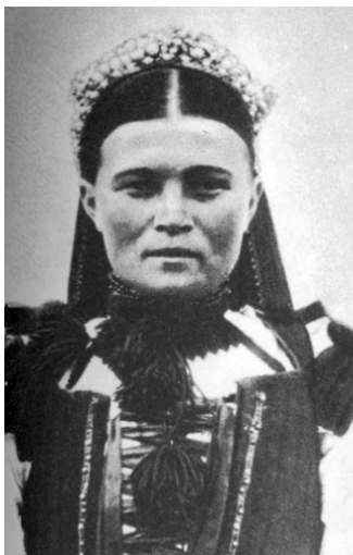
A. Leány gyöngyös pártában (Magyarvalkó, Kolozs vármegye, 1894) ( http://mek.oszk.hu/ 02100/02115/html/img/4-