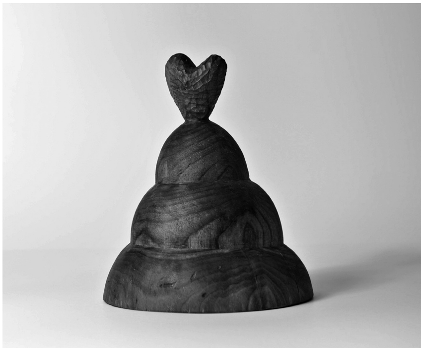
Hegycsúcs, 2012 (fa, 28x22x22 cm)