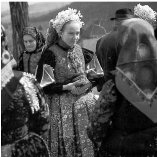
B. Leányok gyöngyös pártában, templomból jövő asszonyok között (Vista, Kolozs megye, 1970-es évek) ( http:// mek.oszk.hu/02100/02115/html/img/4-160r.jpg )

A fejezet második részében Radu Claudia az antropológiai leletanyag elemzését végezte el ( A humán csontanyag embertani elemzése , 97–106. oldal). Csak sajnálni lehet, hogy eredményeit nem hasonlította össze a Benkő Elek által vezetett csoport eredményeivel. 25 Ennek a résznek tudománytörténeti vetülete is van, ugyanis az Erdélyi-medencében Botár István, Tóth Boglárka és Grynaeus András munkásságára méltán vonatkoztatható a jó értelemben vett úttörő jelző. (107–128. oldal)