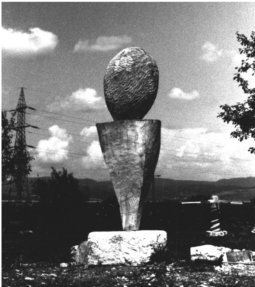
Cím nélkül, 2003 (fa, kő, 180x50x50 cm)

- A világ olyan irányba halad, hogy nagyon nehéz ma megőrizni az optimista szemléletet. Nemcsak az a baj, hogy fogyunk, hanem az is, hogy őrlődünk, marjuk egymást. De vallom Reményikkal együtt, hogy a sírba is magammal kell vigyem a reményt.