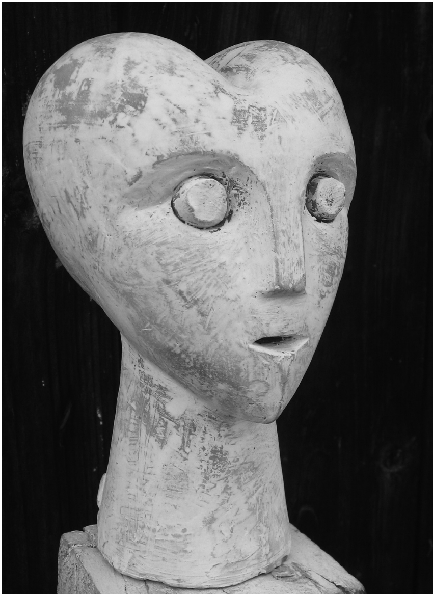
Én, 2013 (kerámia, 19x11x14 cm)