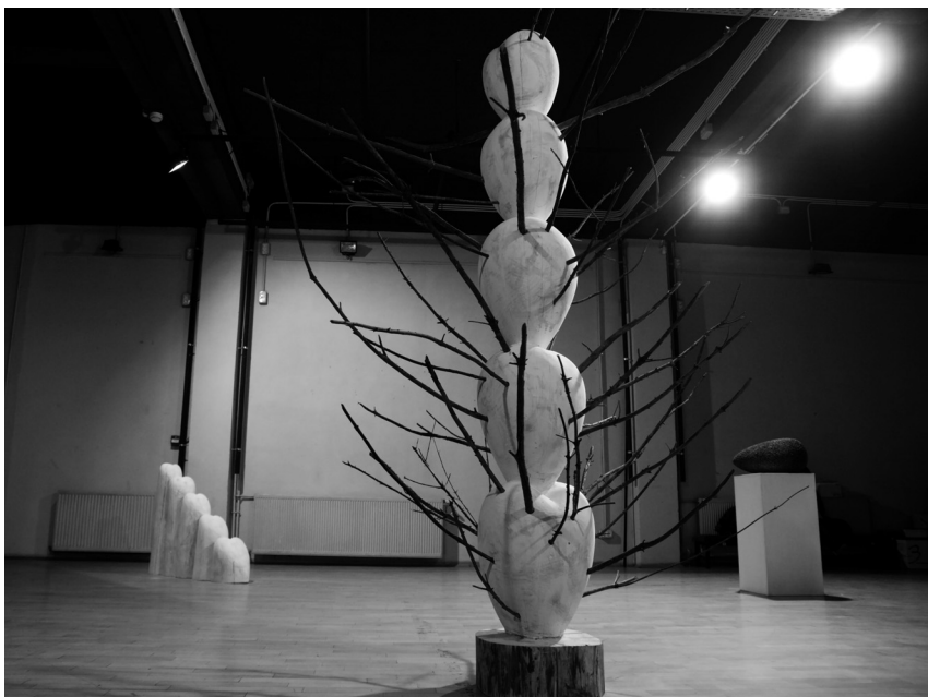
Életritmus, 2013 (fa, ágak, 250x150x143 cm)

Zarathustra Biblia Korán nem ad választ miért is vagyok s miféle világon A Nincs van mindenütt Az Értelem sehol Mit mennyit és mért kell még kívárnom