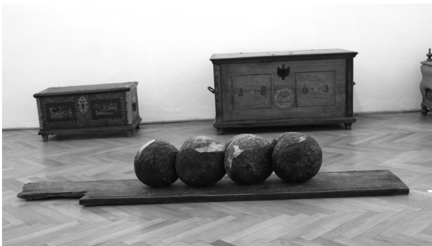
Gyöngysor, 2013 (fa, 20x74x19 cm)

Nem hagy békén, hiába van máshol. Plüssmajmot tartok azóta. Üldögél rendben a polcon. A porszaggal nincs baj. Néz a majom. Megborzongat tőle a jóérzés, hogy nem szed szanaszét. Plusz az emlék, amikor kaptam, salátát ettem rántott sajt mellé. Üde, édes, fokhagymás uborkát télen.