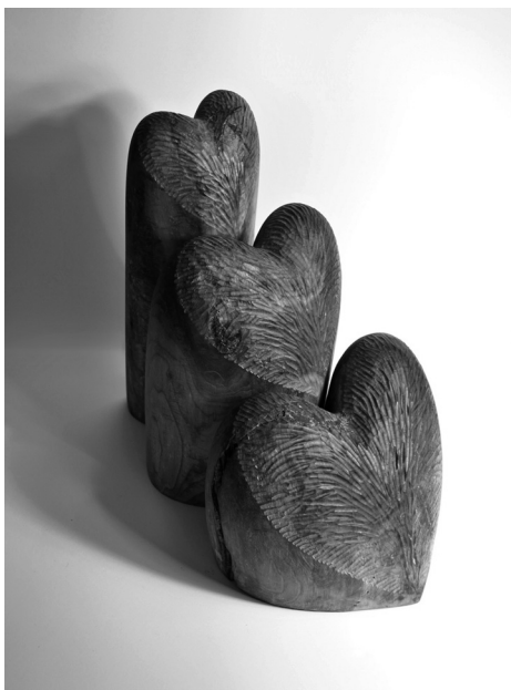
Félhegy, 2012 (fa, 53x56x34 cm)

és egy kopott hátizsák volt a világ autóstoppal jártuk az országot meg gyalog Velencén a tóparton botlottunk egymásba s én bekérezkedtem a sátradba másnap mentünk tovább ki erre ki arra címet sem cseréltünk csak a keresztnedre emlékszem és most nézlek hallgatlak már az unokádról mesélsz nem sejtve hogy titkunk közös bennem a hallgatás most is ösztönös a busz megáll s a leszállók közül még visszanézel talán felszisszenő emléket keresve de már indulunk tovább s a nyár befurakodó langya lassan feloldódik a zötykölődés klimatizált egyhangúságában