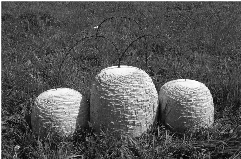
Szagrális ívek, 2016 (fa, ágak, 32x73x29 cm)

Benedek Elek Pedagógiai Líceum, XI. osztály (Székelyudvarhely)