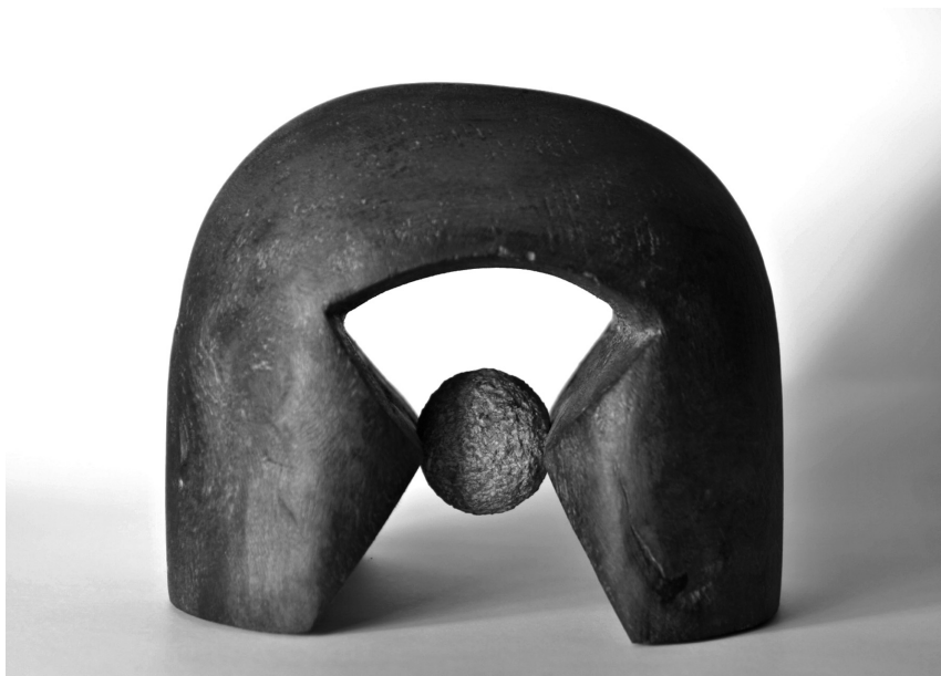
Magma, 2012 (fa, kő, 17x20x15 cm)

Lehet, hogy utazásai elején még idegen helyek voltak ezek Stasiuk számára, de ismétlődő látogatásai közben valami nagyon megváltozott: „Szeretném, ha mindazokon a helyeken el lehetnék temetve, ahol jártam és valaha jární fogok. A fejem a Zemplén zöldellő dombjai között, a szívem valahol Erdélyben, a jobb kezem Montenegróban, a bal Szepesbélában, a szemem Bukovinában, az orrom Resinárban, a gondolataim talán mifelénk...” ( Molnár Vilmos )