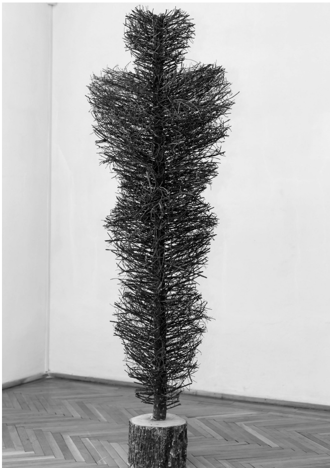
Ego, 2013 (fenyőágak, 180x48x43 cm)

irodalomtörténeti szempontból. A művészi értelemben fontos episztolák között jól megférnek az írójuk esendőségéről árulkodó, „földhözragadt” levelek is, ezekkel együtt válik teljessé a kép, bízom benne, hogy sok Rilke-kutató fogja haszonnal forgatni e kiadványt, hogy az alkotás-lélektani háttérrel jobban megértve, a művészetelméleti koncepciókat elemezve teljesebb képet alkothasson költészetéről.